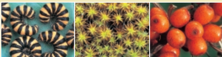
Chenilles de la Goutte de sang

Ministerie van de Vlaamse Gemeenschap afdeling Natuur