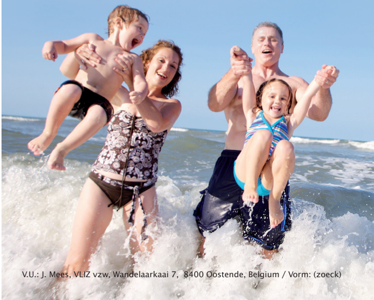
V.U.: J. Mees, VLIZ vzw, Wandelaarkaai 7, 8400 Oostende, Belgium / Vorm: (zoeck)