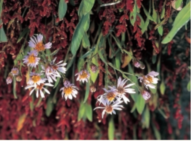
Végétation halophile avec Aster maritime et Salicorne

Ce sont les vastes champs de roseaux qui, au premier abord, sautent aux yeux. Ils séparent les étendues d'eau centrales, des prairies. Ces marécages de roseaux ne sont pas uniquement un paradis pour nombre d'oiseaux (voir plus loin), ils offrent également un milieu propice pour des espèces, telles que la Laièche des marais , l' Epière des marais et le Pigamon jaune .