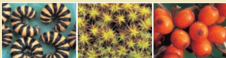
Chenilles de la Goutte de sang

La Division Nature du Ministère de la Communauté flamande est chargée de la préparation et de la mise en oeuvre de la politique flamande en matière de la conservation de la nature, de l'acquisition et de la gestion des réserves naturelles de la Région flamande. La Division Nature apporte également un soutien financier aux achats et à la gestion de réserves par les associations agréées de protection de la nature.