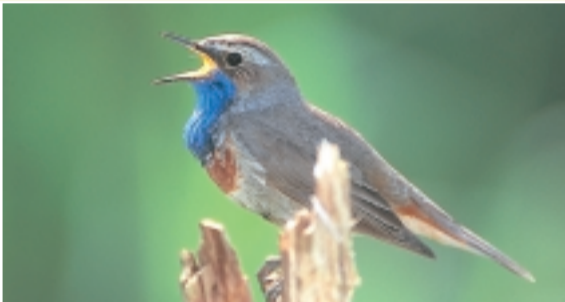
Gorgebleue à miroir

Les prairies humides et riches en relief représentent un biotope de prédilection pour bon nombre d'oiseaux côtiers (tels que le Tadorne de Belon , l' Avocette élégante , le Chevalier gambette et l' Huîtrier pie ) et de près (tels que le Vanneau huppé , la Barge à queue noire et le Canard souchet ). Un ancien champ labouré, transformé en 2000 en une prairie riche en relief, a attiré en 2002 une colonie de Mouettes rieuses qui y a trouvé son aire de nidification. Le long des cours d'eau et dans les vastes marécages de roseaux un grand nombre d'oiseaux aquatiques caractéristiques, tels que le Grèbe castagneux , le Râle d'eau , la Gallinule poule-d'eau , le Foule macroule , l' Oie cendrée , le Canard colvert , le Canard chipeau , la Sarcelle d'hiver , la Sarcelle d'été et le Fuligule morillon , trouvent un endroit pour nicher. Le Busard des roseaux , un rapace élégant affectionnant, tel que son nom l'indique, les roseaux, y trouve un lieu de prédilection en compagnie d'une ribambelle de passereaux ( Bruant des roseaux , Panure à moustaches , Rousserolle effarvate , Phragmite des joncs , Locustelle lusciniode , Gorgebleue à miroir ). A ces derniers se joignent de plus en plus souvent des espèces méridionales telles que Bouscarle de Cetti et Cisticole des joncs ainsi que le Tarier des prés , devenu extrêmement rare. Dans les broussailles il faut guetter e.a. le Pouillot fitis , la Locustelle tachetée et le Tarier pâtre .