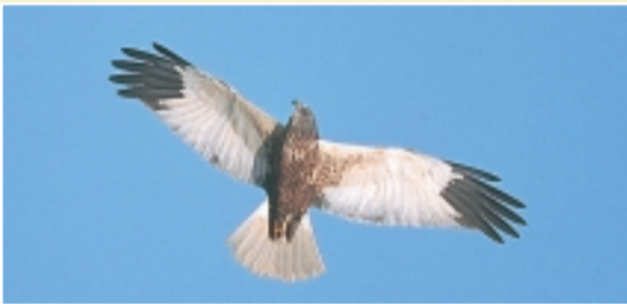
Busard des roseaux