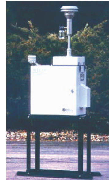
Parisol-Plus luchtbemonsteringstoestel voor het meten van zware metalen in fijn stof (VMM). Appareil d'échantillonnage d'air utilisé afin de mesurer les métaux lourds contenus dans les poussières fines (VMM).

La zone d'étude du projet AEROSOL se situait en majeure partie dans les arrondissements de Dunkerque et de Veurne et dans la zone côtière de la mer du Nord. La qualité de l'air a été mesurée au sol, au-dessus de la zone côtière, et depuis l'espace selon les méthodes les plus récentes et avec un important éventail en appareillages, d'échantillonnage et d'analyses, en tenant compte des normes internationales. Au sol des campagnes de mesures ont été organisées des deux côtés de la frontière, en différentes saisons, avec des échantillonnages dans des stations fixes faisant partie des réseaux de mesures flamands (Vlaamse Milieumaatschappij, VMM) et français (Opal'Air), ainsi qu'avec des laboratoires mobiles, couvrant aussi bien des régions rurales et urbaines qu' industrialisées. Le navire océanographique RV Belgica fut mis à la disposition des chercheurs afin de prélever des échantillons d'air au-dessus de la zone maritime le long des côtes. Grâce à la télédétection spatiale, des données ont été relevées par l'observation et le suivi des panaches de fines particules au-dessus de la région de Dunkerque et de la zone frontalière.