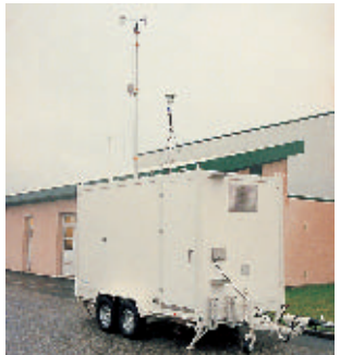
Meetwagen (Opal'Air). Laboratoire mobile (Opal'Air).