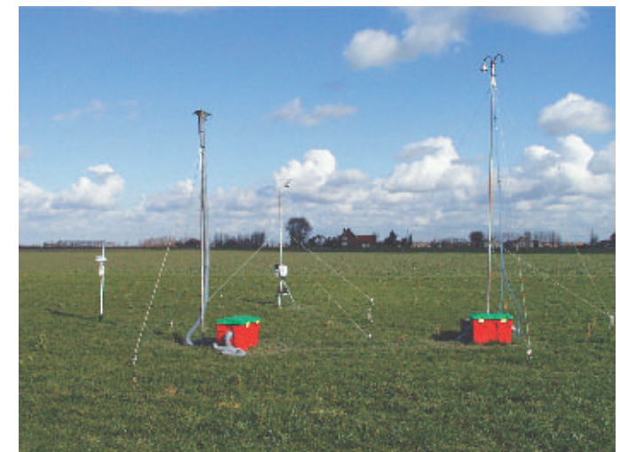
Staalnamen aan de grond (ULCO). Échantillonnage au sol (ULCO).