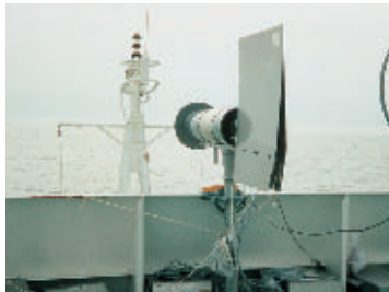
Monstername aan boord van het oceanografisch schip RV Belgica (UIA). Échantillonnage à bord du navire océanographique RV Belgica (UIA).