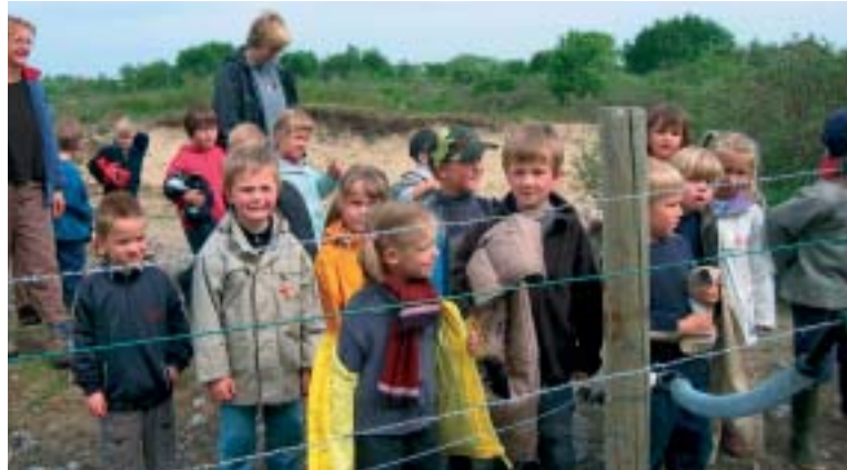
* We slaan al eens de verkeerde weg in, je moet er geen 'artiest' voor zijn

Verken de omgeving van het 200 ha-grote natuurgebied De Doornpanne. Dit beschermd landschap groepeerd een aantal uiteenlopende duintypes zoals stuifduinen, duingraslanden, dicht begroeiende pannen en gefixeerde binnenduinen. Het gebied ontleent zijn naam aan een centraal gelegen brede en struweelrijke depressie (panne). Vanuit het bezoekerscentrum van de IWVA dat de duinwaterwinning en het natuurbeheer in deze duinen belicht, leidt de wandeling naar de Hoge Blekker. Deze hoogste duintop van de Vlaamse kust (33 m) biedt een panoramisch uitzicht over de duinen en de achterliggende polders. Via de Schipgatduinen, verwijzend naar een voegere zee-inham, waarlangs schepen het binnenland konden invaren, bereikt de wandelaar het strand. Bij helder weer is van op de hoge zeereepduinen een groot deel van de kustlijn zichtbaar. Via de residentiële verkavelingen van Sint-André en Witte Burg komt men opnieuw bij het vertrekpunt.