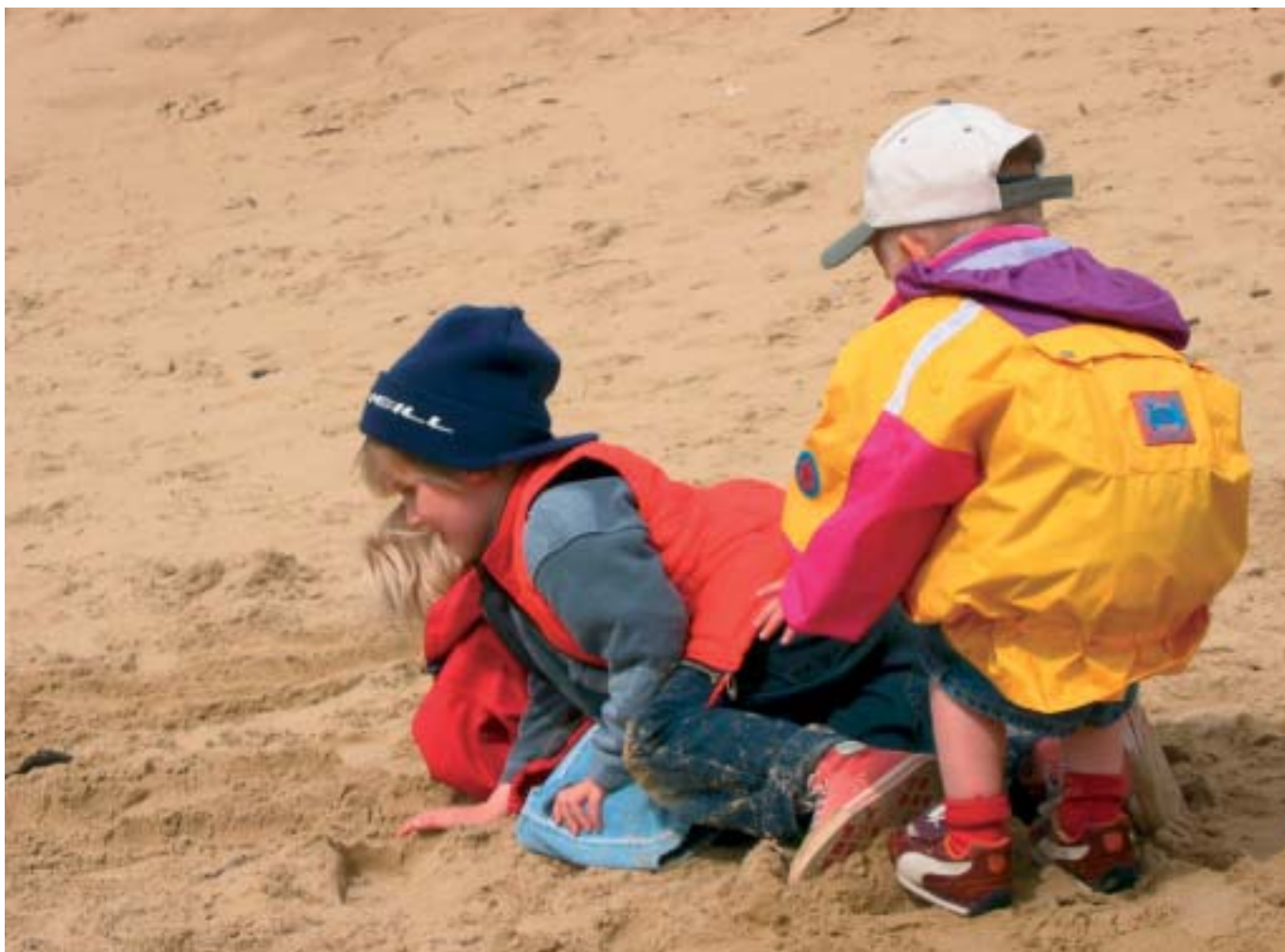
Een wandeling kan soms een moeizame start kennen ...

Een bijzondere aanrader voor gezinnen is de 'Duinpieper' (zie 1.11, p.29). Nee, niet die zeldzame vogel die tijdens de trek een enkele keer wordt gezien langs de kust. Wel een rugzakje met allerlei opdrachten en materialen (determinatiekaart, verrekijker, loep, ...) die je helpen duin en strand verkennen.