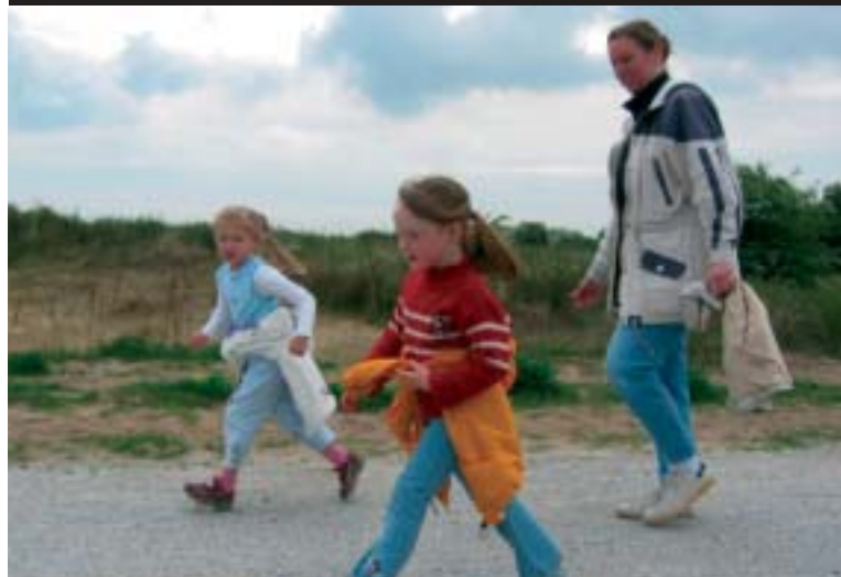
Bij wandelpaden in de duinen wordt gekozen voor natuurlijke verharding, zoals hier een schelpenpad.