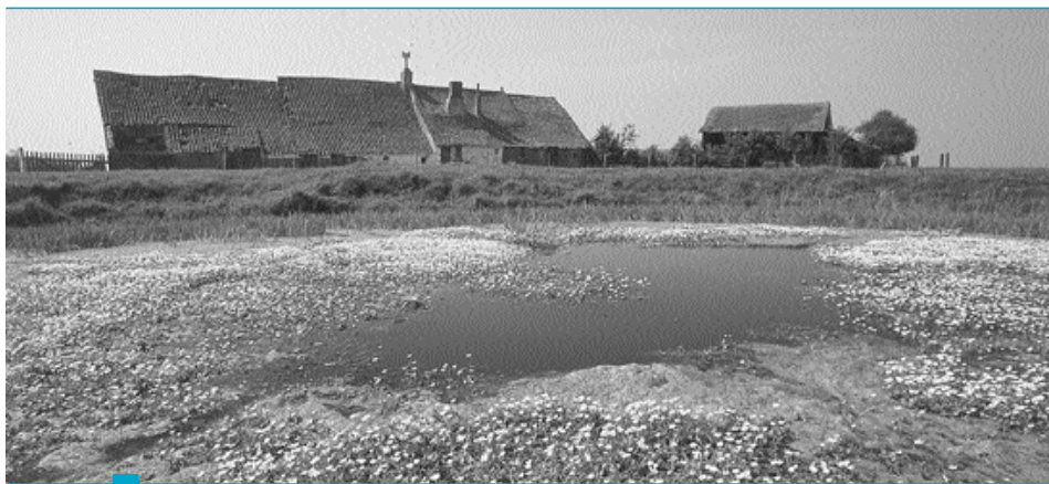
Het gerommel in de polder is de voorbije jaren geluwd. Landbouwers willen nu helpen zoeken naar gemeenschappelijke oplossingen en hierin als volwaardige (gespreks)partners worden betrokken

in deze context door sommige landbouwers als 'controleposten' gezien, van waaruit het reilen en zeilen van landbouwers 24 uur op 24 uur in het oog wordt gehouden. De uitrusting van natuurliefhebbers met verrekijker, fotomateriaal en telescoop versterkt nog deze ervaring.