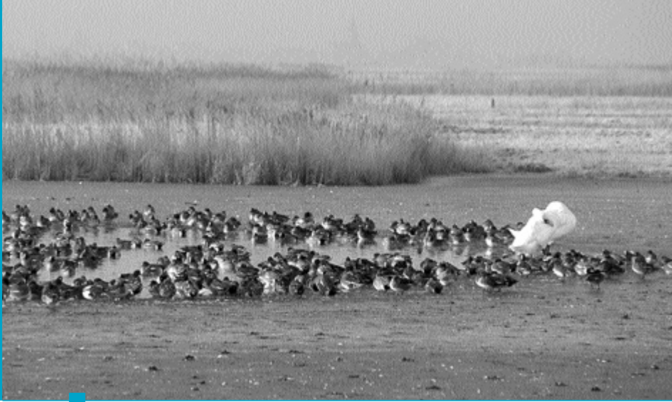
MD Als gevolg van het open karakter, de aanwezigheid van graslanden en de nabijheid tot de zee is de Uitkerkse Polder erg belangrijk voor tal van vogelsoorten en planten