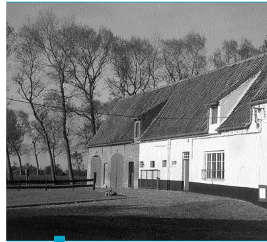
MD De Uitkerkse Polder is ook een waardevol landbouwgebied, met tientallen actieve bedrijven

volle poldergebied geniet zowel een Vlaams beschermd statuut (erkend natuurreservaat, natuurinrichtingsproject, natuurgebied en landschappelijk waardevol agrarisch gebied) als een internationale bescherming (volgens de Europese Habitat- en Vogelrichtlijn). Sedert eind 1990 werkt Natuurpunt vzw aan de uitbouw van een natuurreservaat door terreinverwerving, natuurbeheer, natuurherstel en natuurontwikkeling (zie kader). Zo wordt de papieren bescherming van fauna en flora in dit ecologisch waardevol gebied ook een effectieve bescherming. De Vlaamse overheid – meer in het bijzonder de Vlaamse Landmaatschappij (VLM) — van haar zijde startte vorig jaar met het uitwerken van een natuurinrichtingsproject in het gebied. Tegelijkertijd is de Uitkerkse Polder sinds de middeleeuwen in landbouwgebruik. Tot vandaag hebben tientallen bedrijven landbouwpercelen in gebruik in deze