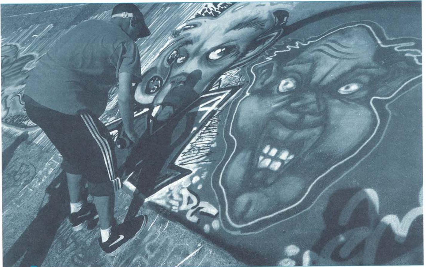
DD Een grote meerderheid van de kustbewoners is tevreden over de netheid van de straten. Een niet onbelangrijke groep (42%) is ontevreden met de voorhanden zijnde speelruimte voor kinderen in de buurt

kinderen in de buurt (NB: 77% van de respondenten heeft kinderen). Wel is ongeveer 80% tevreden over de natuurlijke omgeving, de netheid van de straten, het lawaai en de verbindingen met het openbaar vervoer.