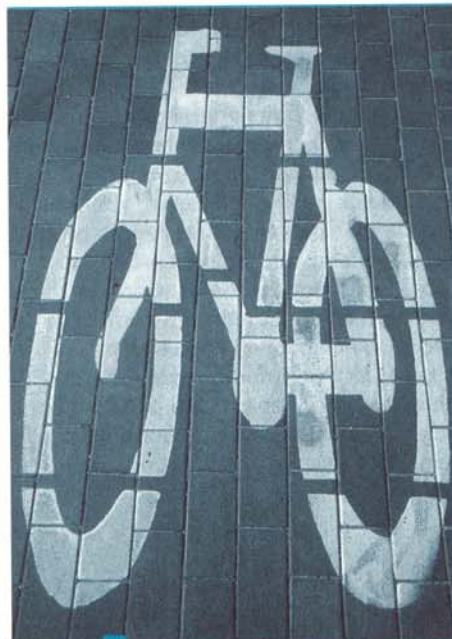
DD Er bestaat ook een groot draagvlak voor maatregelen om het probleem van de verkeersdrukke aan te pakken: 71% van de kustbewoners vindt de overlast die door het autoverkeer veroorzaakt wordt een (matig tot groot) probleem. Een verbetering van de fietsinfrastructuur - gewenst door 72% van de respondenten - zou het intense auto-gebruik kunnen helpen terugdringen, aldus de ondervraagden

Er bestaat ook een groot draagvlak voor maatregelen om het probleem van de verkeersdrukke aan te pakken: 71% van de kustbewoners vindt de overlast die door het autoverkeer veroorzaakt wordt een matig tot groot probleem. Toch houdt het een meerderheid niet tegen zelf te blijven zweren bij de heerschappij van koning auto. Een verbetering van de fietsinfrastructuur - gewenst door 72% van de respondenten - zou het intense auto-gebruik kunnen helpen terugdringen. Bijna de helft van de kustbewoners wenst meer inspanningen op het vlak van openbaar vervoer en meer dan 70% is van mening dat er niet moet worden gestreefd naar nog meer autovrije straten.