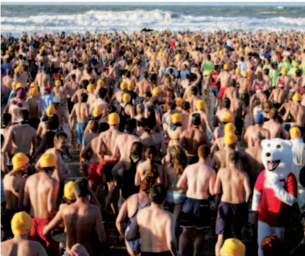
■ Vanwaar die aantrekkingskracht voor de zee? (MD)