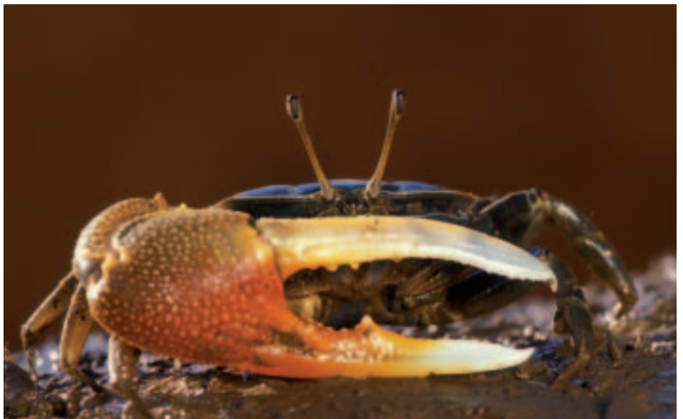
■ Zeeën en oceanen herbergen een grotere diversiteit aan leven, vertegenwoordigd door 38 fyla of 'stammen' tegenover slechts 15 aan land. Dat er nog maar 210.000-275.000 mariene soorten bekend zijn, toont vooral aan dat de zeeën nog grotendeels onverkend terrein zijn (MD)

Het 'Ocean Biogeographic Information System' (OBIS: www.iobis.org ) omvat momenteel 78.000 verschillende soorten zeedieren en -planten. De hoop is om tegen 2010 alle bekende 210.000-275.000 mariene soorten in de databank ingevoerd te krijgen. Dat dit slechts 15% is van wat aan soorten op land is gevonden (1,7-1,8 miljoen, wat zelf vermoedelijk slechts ca. 10% van de werkelijke biodiversiteit is), geeft niet aan dat de zeeën soortenarmer zijn, maar vooral dat ze veel minder intens onderzocht zijn. Een illustratie hiervan is dat in zee 38 fyla of stammen aan leven voorkomen, waarvan 19 exclusief marien (bv. stekelhuidigen, zakpijpen, kamkwallen,...), terwijl op land maar 15 fyla zijn aangetroffen, waarvan slechts één exclusief terrestrisch (de Onychophora of fluweel-