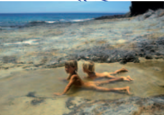
■ Watersport, strandtoerisme, walvisvaarten, duikactiviteiten op koraalriffen zijn maar enkele voorbeelden van de immense toeristisch-recreatieve functie die zeeën wereldwijd vervullen (MD)