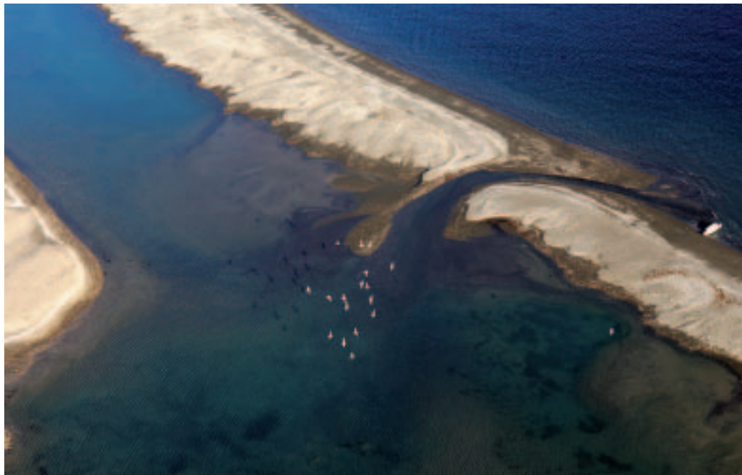
■ Zeeën en oceanen bedekken 71% van het aardoppervlak en omvatten 97,5% van alle water op aarde (MD)

Gemiddeld zijn de wereldzeeën 3.729m diep, terwijl de gemiddelde hoogte aan land slechts 840m bedraagt. Theoretisch kan het globale landvolume dus zonder probleem in de oceanen worden geborgen. Met hun totale oppervlakte van 362.000.000 km 2 en hun volume van 1.350.000.000 km 3 hoeft dit niet te verwonderen. Overigens is het grootste deel van die oceanen duizelingwekkend diep: de abyssale diepzeevlaktes en de mid-oceanische onderwaterbergketens vormen samen ca. 75% van het totale oceaanoppervlak en situeren zich op duizenden meters diepte. Het ons meest vertrouwde, ondiepere en productiefste deel (de zogenaamde continentale platen en hellingen) maakt er slechts 15% van uit.