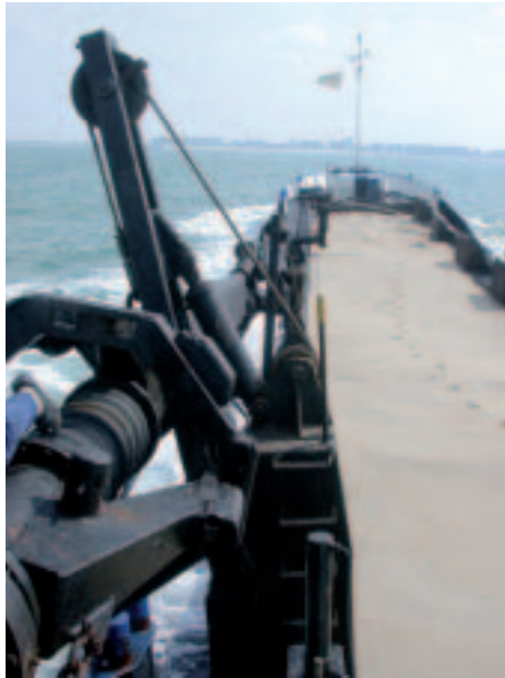
■ In 2002 produceerde Europa naar schatting 2-3 miljard ton zand en grind, waarvan een goeie 100 miljoen ton uit zee afkomstig was (MD)

Zout, het meest kenmerkende element van de zee, was lange tijd een waar luxeproduct, een status die nog verderleeft in de woorden 'salaris' of in uitdrukkingen als 'het zout in de pap niet waard zijn' (zie ook het boek 'Zout' van Mark Kurlansky). Nog steeds is zowat een derde van alle tafelzout uit zee afkomstig. Maar ook kaliumzouten (kunstmest en chemisch reagens), broom (medicijnen, plastic en petrochemie) en magnesium (lichtgewichtconstructies bv. auto- en