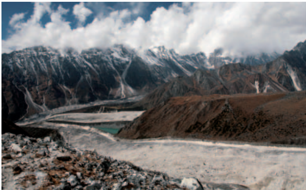
■ Gemiddeld zijn de wereldzeeën 3.729m diep, terwijl de gemiddelde hoogte aan land slechts 840m bedraagt. Theoretisch kan het globale landvolume dus zonder probleem in de oceanen worden geborgen (MD)

De meeste oceanen bevatten zo'n 35 g zout per liter, en de druk kan op grote diepte oplopen tot meer dan 1000 atmosfeer.