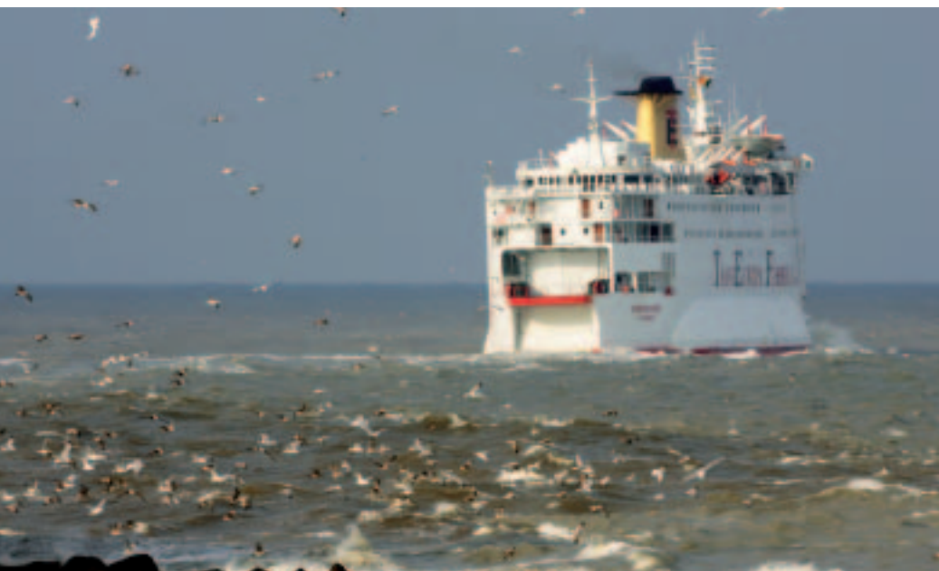
■ Wereldwijd zijn er meer dan 1 miljoen zeevaarders en ca. 48.000 schepen (MD)

Scheepvaart en toerisme zijn wereldwijd de belangrijkste economische maritieme sectoren. Watersport, strandtoerisme, walvisvaarten, duikactiviteiten op koraalriffen zijn maar enkele voorbeelden van de immense toeristisch-recreatieve functie die zeeën wereldwijd vervullen. Meer dan 90% van het goedertransport gebeurt over zee, met een behandeld volume dat de voorbije veertig jaar is verviervoudigd. Wereldwijd zijn er meer dan 1 miljoen zeevaarders en ca.