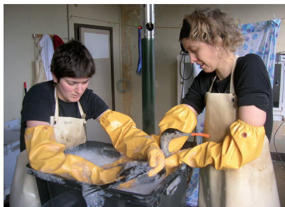
■ Het wassen van een olieslachtoffer, hier een Roodkeelduiker, moet snel en nauwkeurig gebeuren (CV)