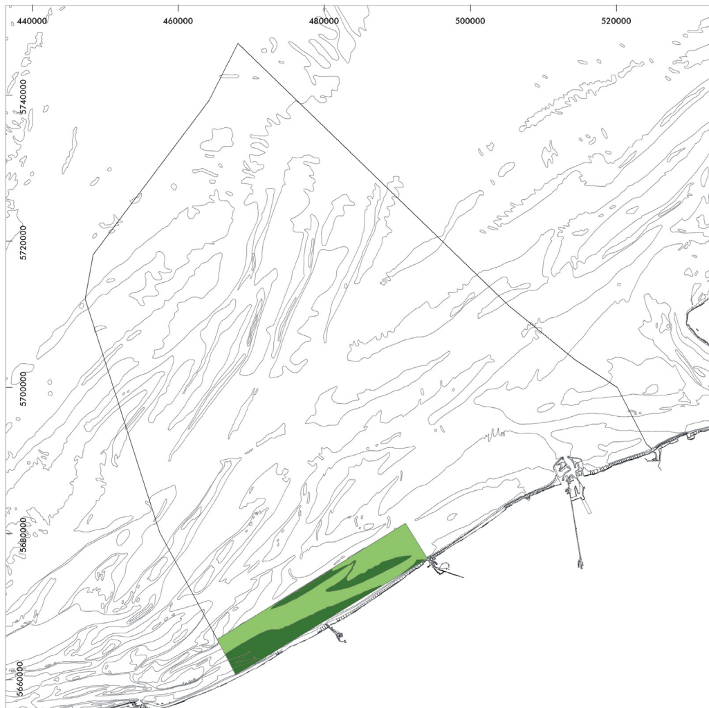
Map I.3.12a. Nature conservation: spatial distribution