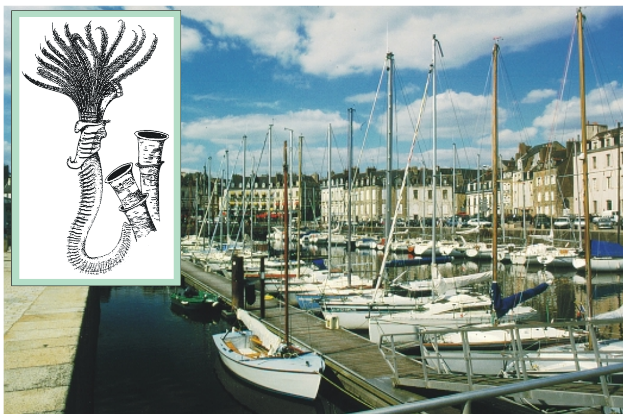
le port de Vannes - août 1999

Ecologie, répartition en Bretagne et en France, nuisances et moyens de lutte sur le site atelier du port de Vannes