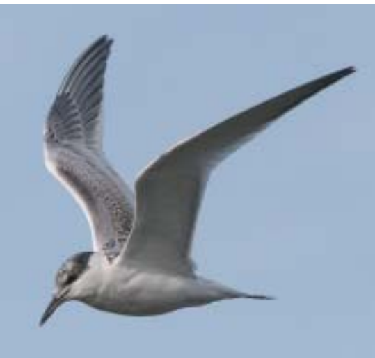
Grote Stern - Koen Devos

De Grote Stern kenden in het begin van het broedseizoen wel vrij veel predatie door Zwartkop- en Kokmeeuwen, maar eens die fase voorbij bleven ook van deze soort nagenoeg alle kuikens in leven. Zelfs de late broeders die jaarlijks rond half juni nog een kolonie vormen en hoofdzakelijk bestaan uit jonge vogels die eens komen 'oefenen', deden het opmerkelijk goed. Meestal overleven hun kuikens het niet omdat de ouders nog te weinig ervaring hebben, maar dankzij het uitzonderlijke voedselaanbod slaagden toch veel late vogels erin om hun jongen groot te brengen.