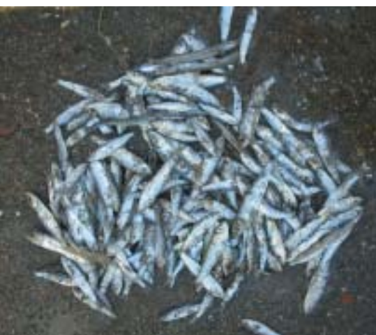
Hoeveelheid niet geconsumeerde vis aangebracht voor kuikens tussen 19:30u op 09/07/07 en 10:30u op 10/07/07 in een kolonie Grote Stern met ongeveer 85 jongen van 0 tot 3 dagen oud.