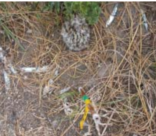
Kuiken van Grote Stern (ca 3 dagen oud), omgeven door niet opgegeten Haringen.