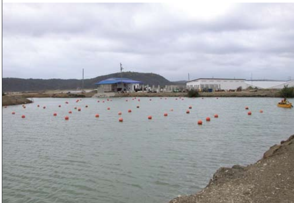
FIGURA 1 Sistemas suspendidos para cultivo de la ostra del Pacífico en reservorio de una camaronera

El mantenimiento de estos sistemas es relativamente sencillo, pero requiere de una mayor frecuencia de limpieza y mantenimiento debido a una mayor acumulación de