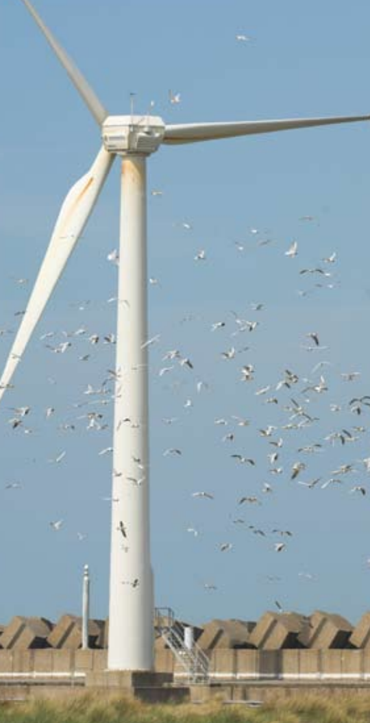
Sternen tussen windmolens - Yves Adams

die tot 35 adulte vogels wisten te verorberen. Door inspanningen van ANB was de predatie door katten in 2007 nihil, maar werden wel enkele tientallen jonge Visdieven en Grote Stern en doodgebeten door ratten. In 2008 waren wederom enkele katten actief op het schiereiland. In totaal werden resten van 77 adulte Visdieven en 3 adulte Dwergsternen gevonden. Het ging hierbij om ruim 1% van de aanwezige Visdievenpopulatie. Een dergelijke extra mortaliteit onder de adulte vogels is op den duur nefast voor een sternpopulatie.