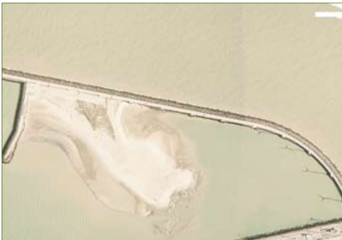
Het Sternenschiereiland in 2005 (laag tij).

De aanwezigheid van de internationaal beschermde sternenkolonies op de haven-terreinen in de westelijke voorhaven van Zeebrugge betekende dat het juridisch gezien onmogelijk was om deze terreinen economisch te ontwikkelen. Daarom werd gezocht naar een alternatieve broedlocatie voor deze vogels. Ecologisch gezien werd een eiland als optimaal beschouwd want bij een broedgebied dat grenst aan het vasteland kan een zekere duurzaamheid alleen worden verzekerd middels een actief beheer tegen landroofdieren en successie van de vegetatie.