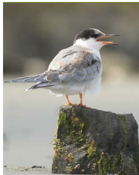
Visdief - Glenn Vermeersch

Niettemin werd in de voorbije vijf broedseizoenen predatie door landroofdieren vastgesteld op het Sternenschiereiland. Reeds in 2005 waren marterachtigen en ratten actief. In 2006 werd voor het eerst predatie door verwilderde katten vastgesteld