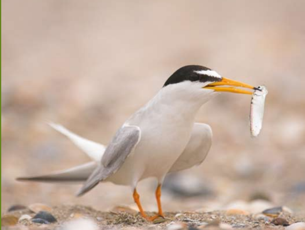
Dwergster met visje

Vlaanderen telt in totaal 24 zogenaamde vogelrijke gebieden die zijn aangewezen als Speciale Beschermingszone in het kader van de Vogelrichtlijn. Dit zijn gebieden waar soorten die op de Bijlage I van de Vogelrichtlijn staan regelmatig voorkomen of jaarlijks broeden, gebieden waar meer dan 1% van de geografische populatie van een bepaalde vogelsoort (of ondersoort) voorkomt (als doortrekker of overwinteraar) en gebieden waar concentraties van meer dan 20 000 watervogels voorkomen. Deze gebieden zijn dus op internationaal vlak uiterst belangrijk voor het voortbestaan van een of meerdere vogelsoorten omdat een belangrijk deel van hun geografische populatie hier geregeld verblijft. In Vlaanderen gaat het dan meestal om overwinterende water- en trekvogels. Wanneer we spreken over broedvogels is er maar een beperkt aantal gebieden van belang op internationale schaal en de Speciale Beschermingszone 'Kustbroedvogels te Zeebrugge-Heist' spant daarbij de kroon.