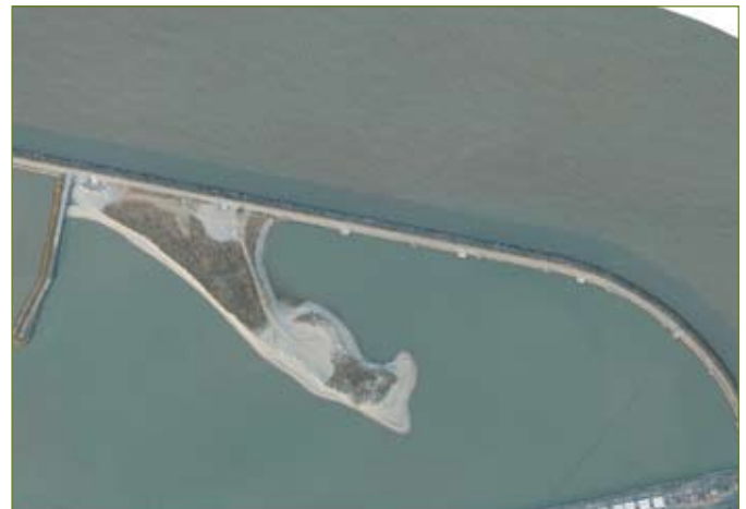
Het Sternenschiereiland in 2009 (hoog tij).

Uiteindelijk werd toch geopteerd voor een schiereiland dat grenst aan de oostelijke havenstrekdam ten noorden van de toenmalige LNG-terminal (het huidige Fluxys). Hier werden in 1999 de eerste 3 ha van het nieuwe broedgebied opgespoten. In 2000 werd het schiereiland tot 5 ha uitgebreid en kwamen de eerste pioniersoorten er tot broeden: maar liefst 56 paren Dwergstern, 13 paren Strandplevieren en 1 paar Bontbekplevier. In 2003 kreeg het schiereiland een onderhoudsbeurt waardoor de oppervlakte aangroeide tot ongeveer 7 ha. In 2004 was het succes ongekend en broedden alle drie de sternensoorten in grote aantallen op het schiereiland. In totaal broedden er in dat jaar meer dan 6000 sternenkoppels. In de jaren die volgden werd het gebied nog verder vergroot tot maximaal 9 ha. Er volgden nog enkele onderhoudsbeurten waarbij nieuw schelpenmateriaal werd aangebracht en een gedeelte van de primaire duintjes, die zich als gevolg van de initiële aanplant van Helmgras hadden gevormd, werd geëgaliseerd. Ondanks de toename van het oppervlakte broedden er in de jaren daarna telkens iets minder sternenvogels, maar nog altijd enkele duizenden en er werden enorm veel