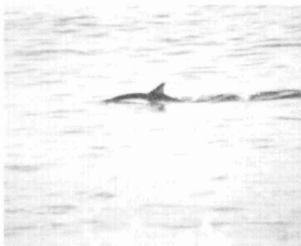
FIGURA 2. Avistamiento de Delphinus sp., a pocos metros de la orilla de playa.

Referente a la distribución longitudinal del género, los dos individuos que permanecieron 19 meses en la poza artificial del puerto de Antofagasta (Guerra et al. , 1987), los dos individuos avistados durante casi un año frente a Caleta Coloso (Guerra et al. , 1987) y los tres individuos avistados a orillas de la playa Punta Arenas, I Región (este trabajo – Figura 2), durante al menos nueve horas, indican que estos delfines pueden presentarse también en el borde costero. Lamentablemente, estos registros no permiten determinar si tal conducta corresponde a una o ambas especies descritas para el país.