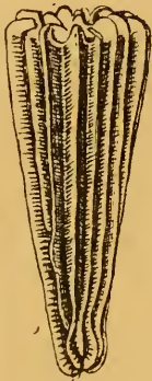
Fig. 1. \times 5

peu après les primaires ; les tertiaires, vers le tiers ou la moitié de la hauteur ; mais elles manquent dans quatre intervalles consécutifs, et celles de ce cycle qui avoisinent de part et d'autre ces quatre intervalles, se montrent assez souvent un peu plus tard que leurs voisines de même rang. Les côtes sont lisses sur le bord, plus ou moins cannelées sur les flancs ; mais le développement des cannelures varie beaucoup suivant les exemplaires, et chez ceux qui les ont très accusées, elles traversent aussi le fond des intervalles. Il en résulte un développement variable des fossettes, qui, en thèse générale, sont peu prononcées. Celles-ci sont disposées sur un rang vers le bas, sur deux vers le haut, et celles du double rang peuvent se faire vis-