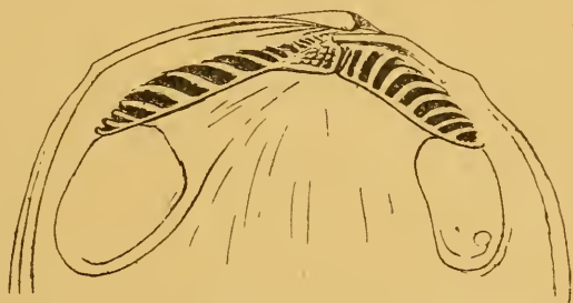
Fig. 1. — Nuculella Nysti , GALEOTTI. \times 5 .

de la valve droite dépasse faiblement en hauteur celui de la valve gauche, et, par contre, le bord palléal de cette dernière déborde celui de l'autre. Crochets peu saillants, prosogyres, situés environ aux deux cinquièmes de la longueur. Côté postérieur généralement plus élevé que l'antérieur, qui est arrondi. Le bord des valves ne forme pas un contour fermé, mais laisse entre ses deux extrémités superposées un intervalle occupé par la partie antérieure de l'aire ligamentaire. Bord dorsal postérieur souvent rectiligne et horizontal, d'autres fois arqué; bord anal presque droit, oblique; bord ventral diversement arqué, parfois presque horizontal. Ornementation très analogue à celle de certains Limopsis et consistant en rubans concentriques subégaux, plus ou moins plats, séparés par des sillons étroits et traversés par des costules rayonnantes comme interrompues par les sillons transverses, prenant par ce fait l'aspect de files de tirets ou de granules allongés. Leur nombre augmente par intercalation.