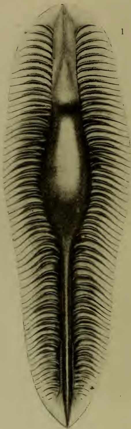
Rhinichthys pacifica , Mitsukuri, 1895.