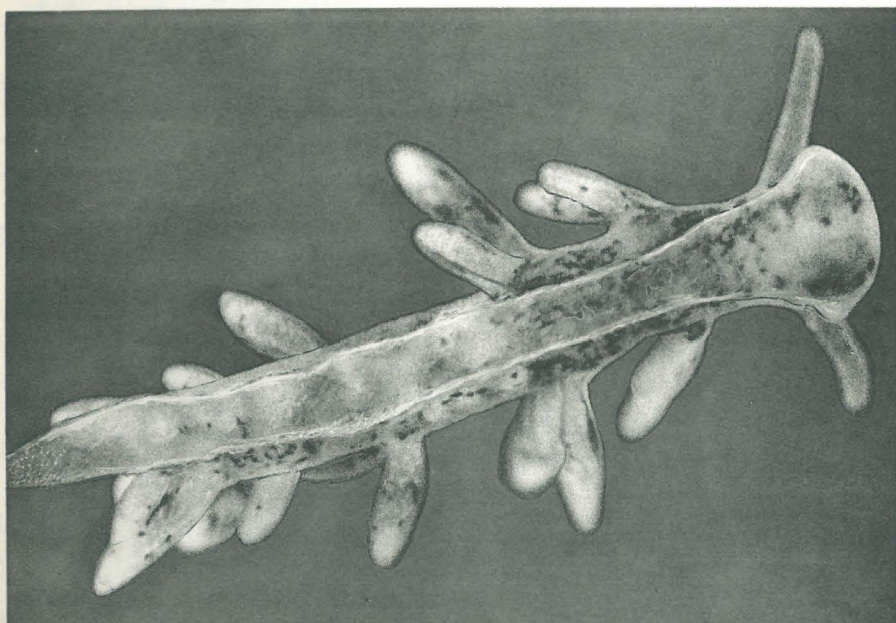
Fig. 2. — Face ventrale