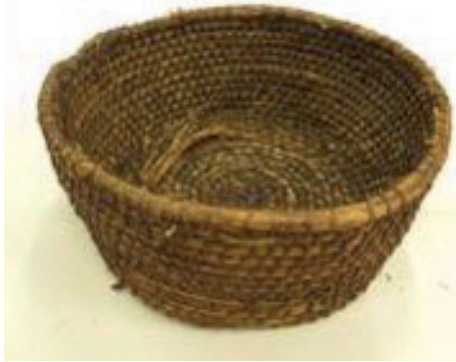
■ Onder meer op de Schotse Hebriden wordt helmgras gebruikt om traditionele daken mee te bedekken. Helm wordt er ook verwerkt in manden, onder de lokale naam 'Ciosan' (Highland Folk Museum, Newtonmore, UK).

Het is al lang gekend dat helmduinen een essentiële rol spelen bij de bescherming van het kustgebied tegen stormen en zeedoorbraken. Reeds in middeleeuwse reglementen omtrent het gebruik van de duinen krijgt helm de nodige aandacht.