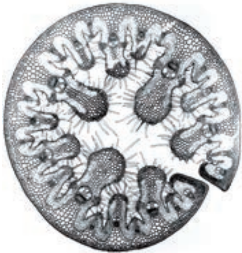
■ Op deze dwarsdoorsnede door een 'blad' zijn de ribben te zien waarmee het blad van de grassoort helm bij droogte volledig kan oprollen (Watson & Dalwitz 1992).

het hoogstrand voldoen aan deze vereisten omdat de nabijheid van de zee zorgt voor een hoge (lucht)vochtigheid. Meer landinwaarts zijn geschikte kiemingsmilieus minder algemeen. Onder meer de randen van vochtige duinvalleien of bloot gestoven fossiele bodemlagen vormen geschikte locaties. Ook in kleine stuifplekjes kan helm zich in zeer natte perioden vestigen. Bij grootschalige verstuiving heeft de soort het evenwel bijzonder moeilijk om voet aan wal te krijgen.