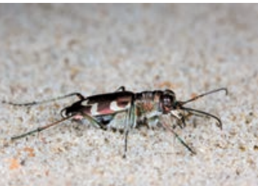
■ De heivlinder (boven) is thuis in onze kustduinen, waar de rupsen zich voeden met (zee) wolfsmelk en met grassen. De strandloopkever (onder) is dan weer een geduchte rover die zich volledig in zijn sas voelt op de warme zandbodems van onze duinen (MD).

(bv. ten gevolge bemesting in landbouwgebied en het vervolgens neerregenen in de vorm van ammoniak), verhoogde neerslag en een langer groeiseizoen (cfr klimaatverandering) werken de plantengroei in ieder geval in de hand. Maar ook veranderingen in het menselijk gebruik van het duin spelen een rol. Zo heeft het niet langer begrazen van de duinen een effect tot op de dag van vandaag. Een spectaculair voorbeeld van fixatie of het dichtgroeien van het duin deed zich voor in het natuurreservaat De Westhoek in De Panne. Het centrale wandelduin, bekend als “de Sahara”, viel er na meer dan een eeuw stuiven op enkele jaren tijd volledig stil door de massale vestiging van helm.