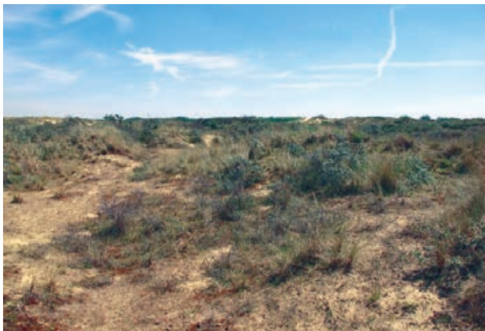
■ Boven: het loopduin van De Westhoek in 2009, na de massale vestiging van helm. Op het beeld onder, uit 2014, is de verregaande stabilisatie (lees: dichtgroei) van het duin te zien (SP).