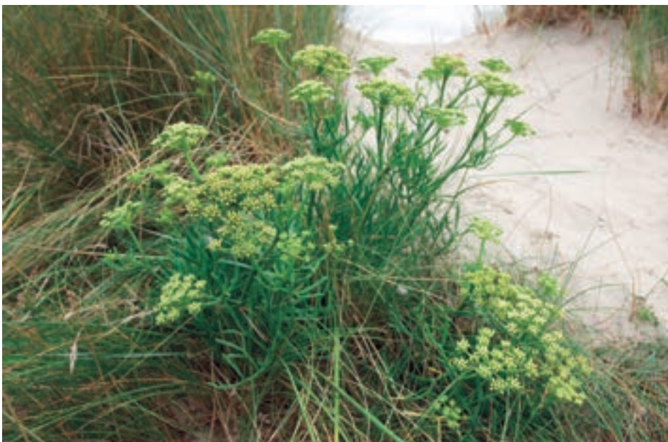
■ Niet alleen de open zandplekken, maar ook het vochtige microklimaat kenmerkt onze zee-reepduinen. Planten als zeewolfsmelk (boven) en zeevenkel (onder) hebben het hier naar hun zin (MD)