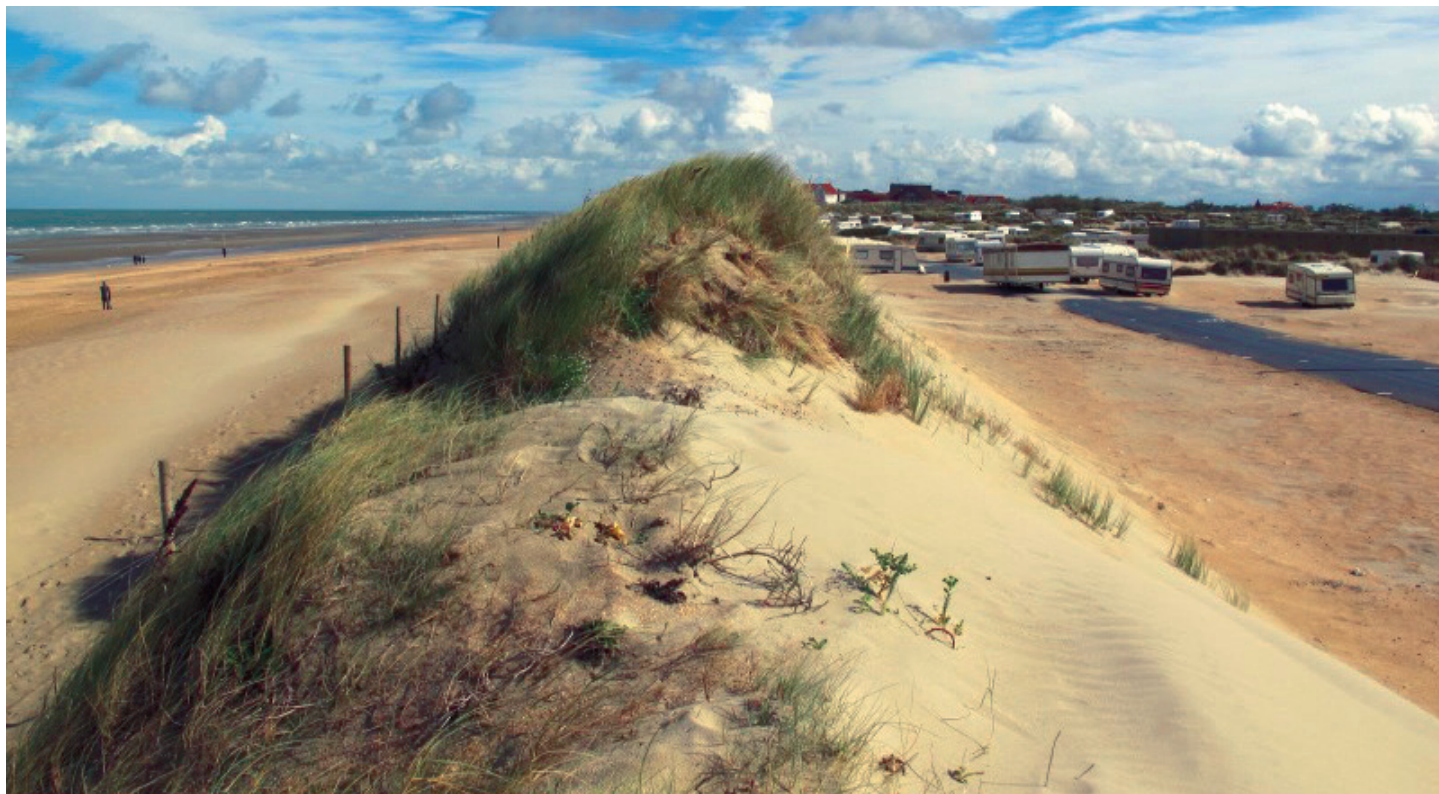
Helm is niet alleen het best gekende en meest dominante gras van onze duinen, het speelt ook een bijzondere rol bij de zeevering. Hier een door helm gefixeerd smal zeeepduin in De Panne (SP).

Helm doet het dus uitstekend in het extreme milieu van de stuifduinen. Daartegenover staat dat helm het moeilijk heeft om vanuit zaad nieuwe populaties te vormen. Huiskes stelde in de jaren ‘70 dat de vestiging van helm uit zaad, althans in het Verenigd Koninkrijk, een zeldzaam fenomeen is: “ seedlings have occasionally been found in nature but generally in low numbers... ”. Kiemplanten, stelt deze auteur, drogen doorgaans uit, geraken overstoven of spoelen weg. Kieming vereist enerzijds een open maar anderzijds een voldoende stabiel en vochtig milieu. Embryonale duintjes op