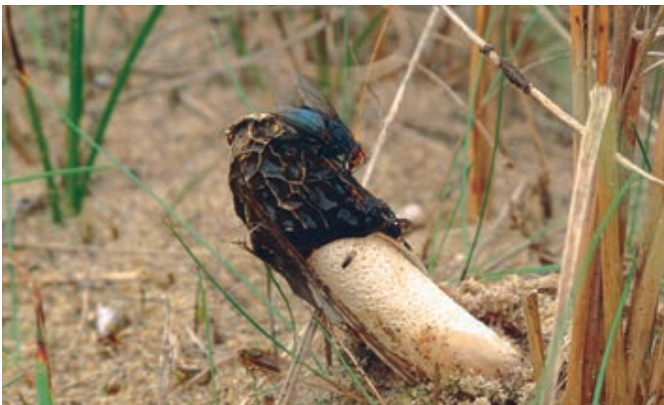
■ Deze duinstinkzwam Phallus hadriani is een specialist van de helmduinen (SP).

invloed van de zee. Zeewaterdruppels die in de golven en branding omhoog worden gecatapulteerd zorgen er voor een zogenaamde 'salt spray'. En als de zee in het voorjaar gaat schuimen — na de bloei van de bruine plaag- of schuimalg Phaeocystis globosa die in de branding tot schuim wordt opgeklopt —, waait heel wat ammoniumstikstof tot aan de duinvoet. Hiervan getuigen stikstofminnende soorten zoals de akkermelkdistel.