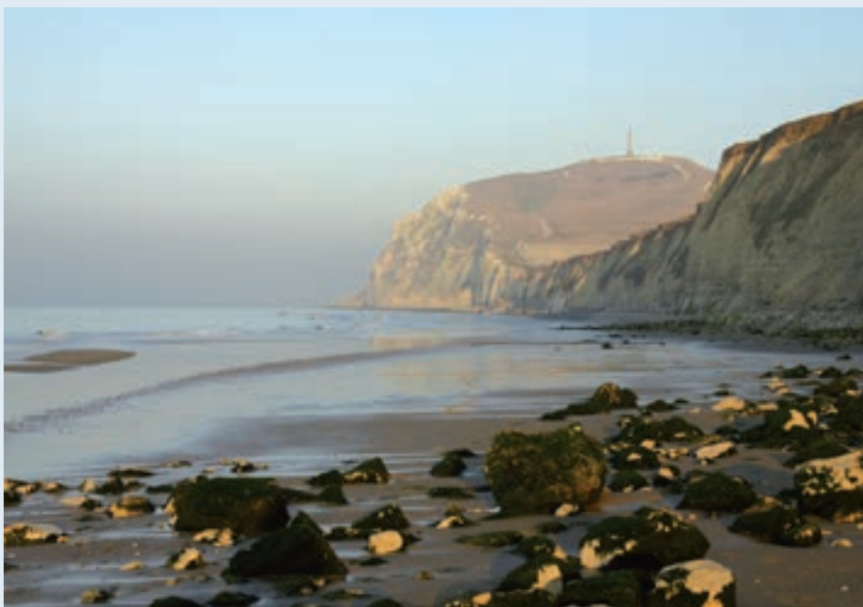
■ De witte krijtrotsen van Cap Blanc Nez zijn goed te zien vanuit Calais. Hier een sfeerbeeld vanop het strand van Escalles.

Bij ons geraakten die krijtlagen nadien geleidelijk aan bedekt met honderden meter klei en zand. Nabij Calais – maar ook ter hoogte van de “white cliffs of Dover” – welfden deze oude krijtlagen op uit de ondergrond. Dit gebeurde door krachten in de aardkorst die het gevolg waren van de botsing tussen de Afrikaanse en Euraziatische aardplaten. Hoewel deze botsing vooral rond de Middellandse Zee