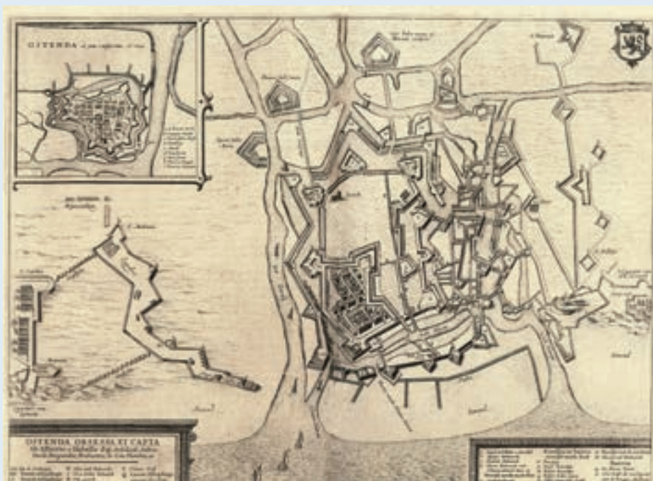
■ Op de Joannes Blaeu kaart van Oostende uit 1652 zijn korte, houten strandhoofden te herkennen op het strand gelegen vóór de stadsomwalling (Cultuurbibliotheek; www.vliz.be/hisgiskust ).

De techniek om strandhoofden te bouwen gaat minstens terug tot in de 16 de eeuw. Reeds in 1502 zijn kleine strandhoofden bekend uit de omgeving van Blankenberge. Op archiefkaarten van rond 1600 zijn ook in Oostende strandhoofden te herkennen. Korte, houten strandhoofden werden toen gebruikt om het strand, gelegen vóór de stadsomwalling, te beschermen. Traditioneel werden de dammen opgebouwd uit palen en twijgenmatten. Voor de palen ging de voorkeur aanvankelijk naar eikenhout, later verschenen vooral tropische soorten op het appèl. Het rijshout waaruit de twijgenmatten waren gemaakt, was snoeihout van vooral wilgen. Pas na de oprichting van de Belgische spoorwegen in 1850 kon men rotsen en andere constructiematerialen vlot vanuit het binnenland kustwaarts vervoeren om daarmee stevigere strandhoofden te bouwen. De eerste grote stenen strandhoofden aan de Belgische kust zijn gebouwd rond 1912, ten oosten van Wenduine. De kern van het strandhoofd bestaat uit los puin, op zijn plaats gehouden door een beschermende toplaag van baksteen, blauwsteen of betonblokken. Die laatste zijn op hun beurt vastgezet met