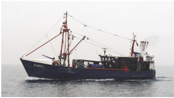
Abb. 2: Mit FFK Clupea dem Heringsnachwuchs auf der Spur - Haunting herring larvae with RV Clupea .

Grundlage für fischereipolitische Entscheidungen im Sinne einer nachhaltigen Nutzung der marinen Ressourcen zur Verfügung – sowohl im Sinne des Erhalts einer gesunden natürlichen Umwelt als auch des Erhalts einer nachhaltigen wirtschaftlichen und sozialen Umwelt für die deutsche Kutter- und Küstenfischerei.