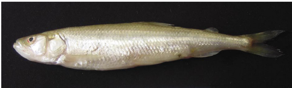
Abbildung 1: Stint ( Osmerus eperlanus L.).