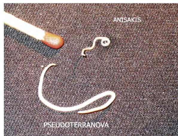
Abbildung 4: Pseudoterranova decipiens aus Stinten im Vergleich zu Anisakis sp. aus Heringen.

man bei den Stinten die NL fast ausschließlich im Muskelfleisch (Tab.4). Von den 63 gezählten Larven waren nur 5 % in den Eingeweiden. Hier gibt es offensichtlich Unterschiede zwischen den Nematodengattungen. Hering und Makrele werden fast ausschließlich von Anisakis simplex befallen, während Stinte bevorzugt Pseudoterranova decipiens beherbergen (Abb. 4). McClelland (2002) berichtet, dass mit der Nahrung aufgenommene Pseudoterranova decipiens innerhalb kurzer Zeit in die Muskulatur abwandern.