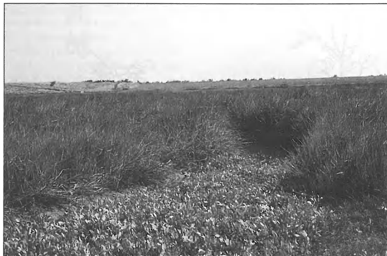
Een dichtgegroeide geul in het Zwin.

Naast deze 47 soorten broedvogels zijn er tijdens het inven-