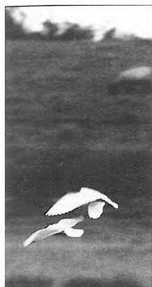
Boven zwartkopmeeuw onder kokmeeuw. In het begin van het voorjaar waren er 5 paar zwartkopmeeuwen aanwezig. Er kwam maar 1 paar tot broeden.

tariseren nog 65 verschillende vogelsoorten waargenomen o.a. rode- en zwarte wouw, ortolaan, lachstern, lepelaar, regenwulp, grauwe gors, grauwe kiekendief, kleine mantelmeeuw enz.. Dit zijn vogels die het gebied gebruiken als rustgebied of fourageergebied tijdens de vogeltrek. Op 02-05-1993 vond ik in het Zwin een kleine mantelmeeuw die op 22-07-1980 als jong geringd was in Anholt; Denemarken (afstand 798 kilometer; 4667 dagen). Ook in de naaste omgeving broeden vogels die vaak voedsel komen zoeken in de Zwinstreek, denk aan bruine kiekendief en ooievaars en grauwe ganzen uit het Belgische Zwin.