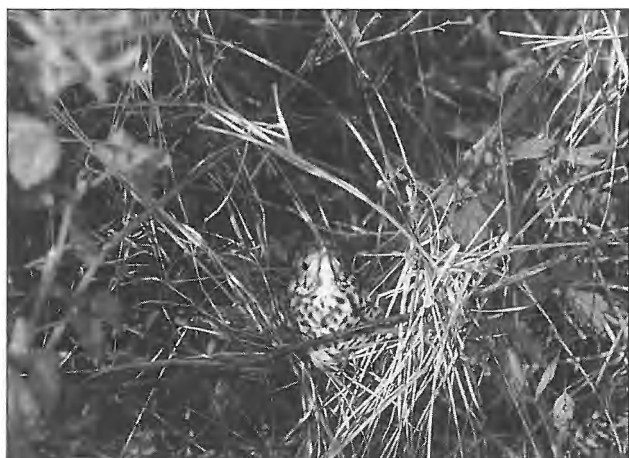
Net uitgevlogen jonge zanglijster.

Hieronder volgt de lijst met broedvogels van respectievelijk: Kievittepolder (1), Oudelandschepolder (2), Zwinweide (3), het Zwin (4) en totaal.