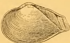
Châlons-sur-Vesle \times 3.5 .