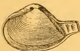
Herne-bay \times 3 .

La Corbule des sables de Wemmel n'est pas la seule espèce du genre chez laquelle nous connaissons une plaque de cette nature. Nous en avons découvert une semblable chez Corbula regulbiensis MORRIS, espèce d'ailleurs très rapprochée de la précédente. Lors d'une excursion, faite il y a trois ans, dans le Kent oriental, nous eûmes l'occasion de récolter de nombreux échantillons de cette espèce dans les sables thanétiens, entre Reculvers et Herne-bay, où elle abonde dans un horizon peu épais connu des géologues anglais sous le nom de « Corbula band ». Le triage de notre récolte, comprenant notamment plusieurs centaines d'exemplaires de cette Corbule, nous en fit découvrir six sur lesquels la plaque se trouvait encore in situ , dans une position identique à celle qu'elle occupe chez le fossile éocène des environs de Bruxelles. D'autre part, nous avons recueilli plus récemment aux environs de Reims, dans les sables de Bracheux de Châlons-sur-Vesle, un spécimen bivalve de la même espèce de Corbule, également en possession de la plaque protectrice en question.