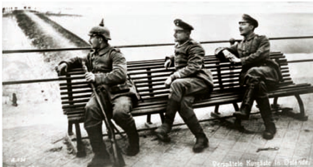
■ Ostende war vor dem Ersten Weltkrieg der Treffpunkt des wohlhabenden Bürgertums. Deutsche Soldaten, die nicht mit dem früheren mondänen Leben in Ostende vertraut waren, fühlten sich jetzt wie Kurgäste. Wir sehen drei Soldaten auf einer Bank auf der Seepromenade. Sie werden als Verspätete Kurgäste in Ostende vorgestellt

Der Strand wurde nun mit Stacheldraht in verschiedene, streng voneinander getrennte Zonen eingeteilt. Der Bereich für die Offiziere begann am Aufgang zum Kursaal und reichte bis zur Wenenstraat (heute Kemmelbergstraat). Die Einwohner durften den Strand zwischen