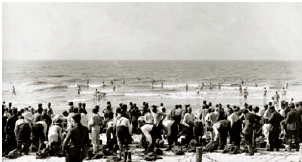
Das Foto hat F. Gerlach aus Berlin gemacht. Es erhielt den Titel: „Am Strande von Ostende“. Wenn die Soldaten erst einmal am Strand waren, zogen sie sich sofort aus und gingen dann im Meer schwimmen. Viele Soldaten aus dem deutschen Inland sahen hier zum ersten Mal das Meer. (Sammlung Erwin Mahieu)