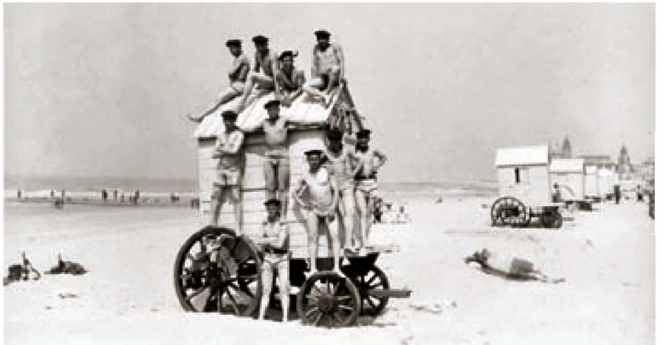
■ Diese Ansichtskarte von einer Gruppe Soldaten, die auf einen Badekarren am Strand von Oostende geklettert war, schickten die Soldaten oft in die Heimat. Die Uniform ist jetzt eine Badehose, doch die Soldatenmütze auf dem Kopf darf dabei nicht fehlen. Mit Ansichtskarten dieser Art beruhigte und besänftigte man die Heimatfront, damit die Kriegsaufwendungen fortgesetzt werden konnten.