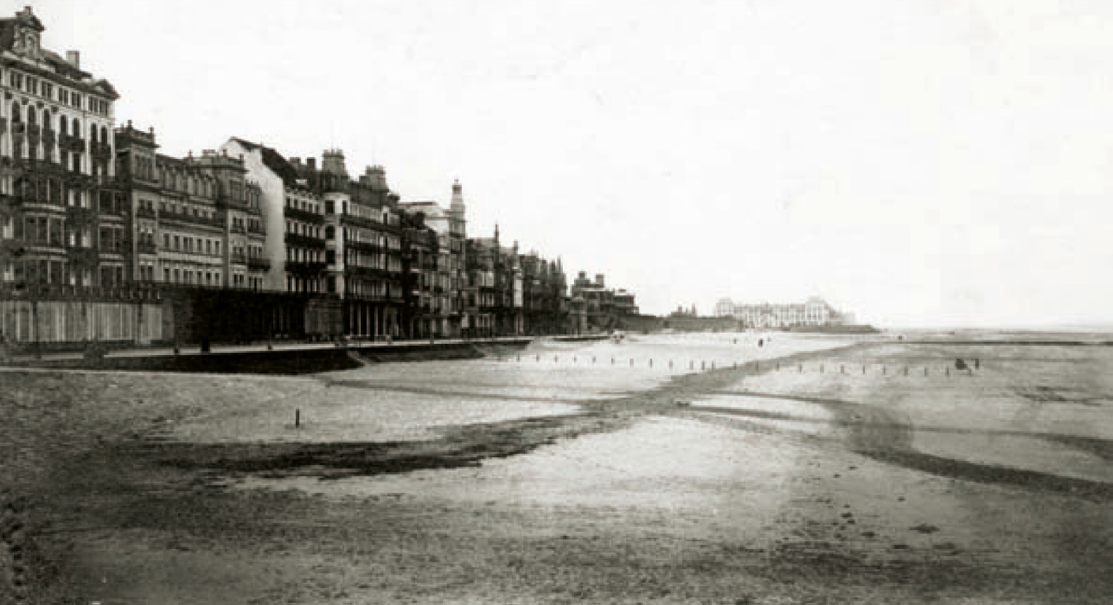
■ Der Strand von Ostende, verlassen und ohne Badekarren, wird im Frühling des Jahres 1915 mit einem Bäderdienst für Soldaten neu eingerichtet