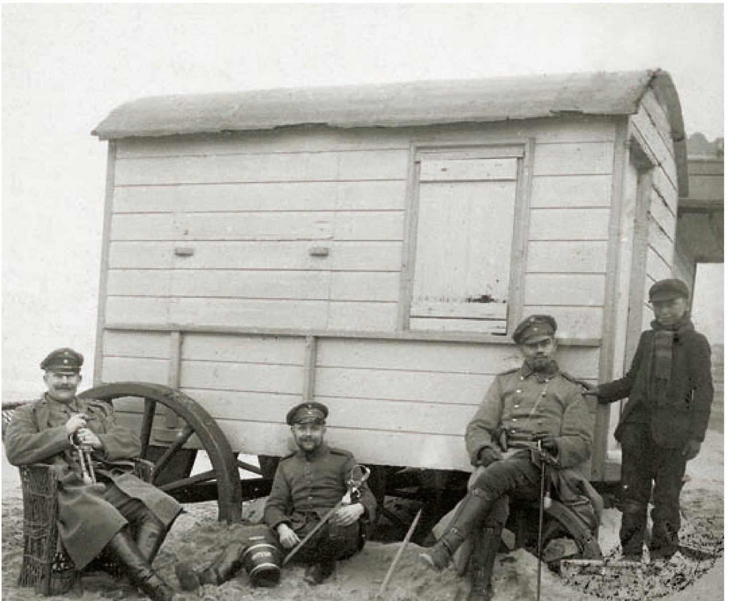
■ Drei Offiziere, die in ihrer Badezone fotografiert wurden, versuchen, nicht so hölzern da zu stehen. Nonchalant in einem Korbsessel, mit einem kleinen Eimer, auf dem „Oostende“ steht, zwischen den Beinen und in Gesellschaft eines kleinen Oostender Jungen möchten sie den Eindruck erwecken, verehrte und willkommene Gäste zu sein.

zu holen, wissen wir nicht, es war jedenfalls eines der beliebtesten Kulissen (mit dem Königlichen Chalet im Hintergrund) für einen gelungenen Schnappschuss vom Strand (siehe Foto).