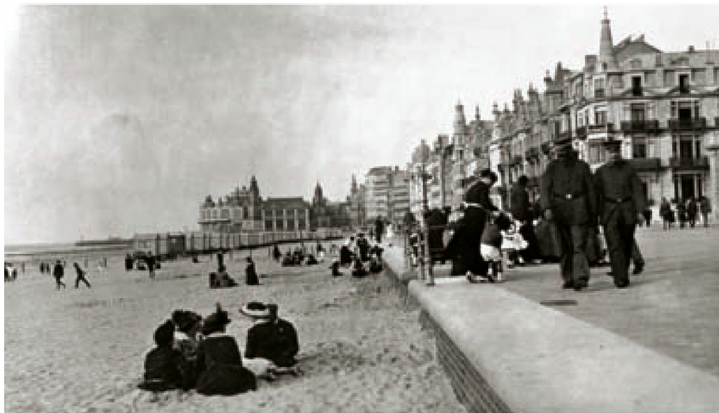
Der Kontrast zwischen dem Offiziersbereich und dem Strand für die Bürger. Ein Schild zu Beginn der fachkundig mit Stacheldraht eingezäunten Badezone verweist auf die exklusiven Benutzer: „Nur für Offiziere“. Vor der Deichböschung wurde eine Reihe Badekarren aufgestellt, in denen sich die Offiziere umziehen konnten, bevor sie im Meer baden gingen. Die Bürger mussten sich damit zufrieden geben, am Strand geduldet zu sein. Badekarren standen nicht zu ihrer Verfügung.