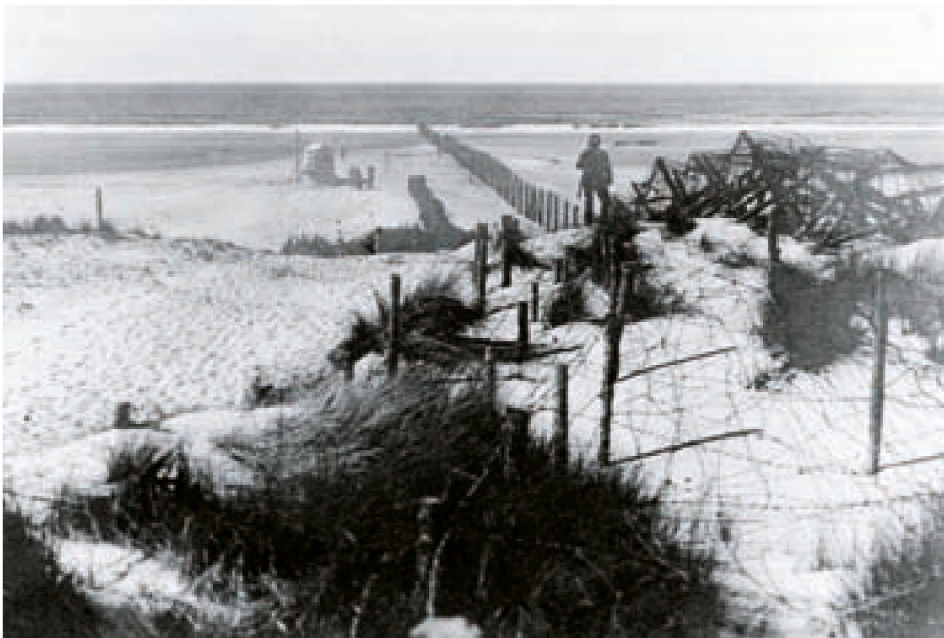
■ „Der elektrische Draht“ auf der Grenze zwischen Belgien und den Niederlanden. Auf diesem Foto des Strandes von Knokke ist zu sehen, dass der „Draht“ sogar bis zum Wasser verlief. Im Laufe des Krieges wurde der Zaun erhöht und erweitert. Er war anfangs ungefähr 1,50 m hoch und wurde später auf rund 2,50 m erhöht. Rund 500 Menschen überlebten eine Berührung des Drahtes nicht.

allein die Befürchtung der Deutschen, dass die Bürger den feindlichen Kriegsschiffen vielleicht einmal „Signale“ geben könnten. Obwohl es keine aktiven Strandfischer mehr gab, trommelte der Fotograf des Marinekorps zu gegebener Zeit einige Strandfischer mit Ausrüstung für ein Foto zusammen, das im „ Kriegs-Album des Marinekorps Flandern 1914-1917 “ erscheinen sollte. Das Foto sollte das Interesse der deutschen Soldaten an der landeseigenen Art des Fischens zum Ausdruck bringen. Fünf hölzernen posierende Strandfischer mit einem Schleppnetz und drei Handkeschern erfüllten die Erwartungen des Fotografen, aber nichts weist darauf hin, dass sie auch nur einen Fuß ins Wasser gesetzt haben (siehe Foto).