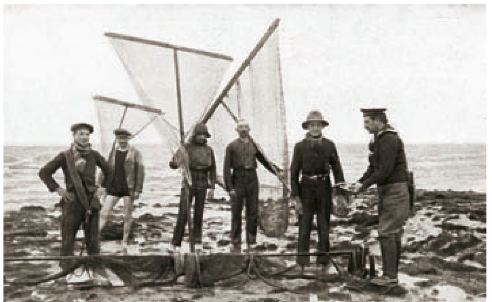
■ Flämische Strandfischer posieren für ein Foto (zu dem sie verpflichtet wurden). Ein Soldat der Marineabteilung betrachtet den Fang. Die hölzernen posierenden Fischer mit einem Schleppnetz und drei Handkeschern erfüllen die Erwartungen des Fotografen, aber nichts weist darauf hin, dass sie auch nur einen Fuß ins Wasser gesetzt haben.

Die militärische Besetzung der Küste und das Verbot von Admiral von Schröder (28. Oktober 1914), das der Zivilbevölkerung untersagte, den Strand zu betreten, bedeutete das Ende der Strandfischerei. Ursache dieses Verbots war der häufige Beschuss und vor