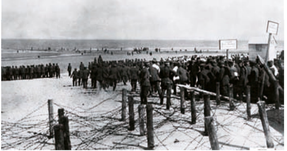
■ Zu einem solchen Foto vom Strand in Oostende mit Hunderten „sich austobender“ Soldaten schrieb man: „Beginn der Bade-Saison in Oostende“ . Die deutschen Soldaten hatten wirklich Zeit, die neue Badesaison zu eröffnen und hier ruhig ein wenig schwimmen zu gehen!

Offiziere und Machthaber zeigten sich dabei am liebsten als wichtige und gern gesehene Kurgäste. Sie beanspruchten nicht nur den exklusivsten Teil der Oostender Badezone, sie wollten sich auch nur in Luxuskabinen umziehen. Wie es sich für Männer von Rang und Ansehen gehörte, ließen sie sich als Souvenir für zu Hause im Badeanzug fotografieren. Den Soldaten stellte die Marine ein Rettungsboot mit (unerfahrenen) deutschen Rettungsschwimmern zur Verfügung. Für die übrigen Teile des Strandes – die der Offiziere und der Unteroffiziere – war Oostende verantwortlich. Die (erfahrenen) Oostender Rettungsschwimmer hatten jetzt eine neue Klientel: deutsche Offiziere in Badehose... Der Unterschied zwischen erfahrenen und unerfahrenen Rettungsschwimmern führte am 6. September 1915 dazu, dass 11 Soldaten ertranken. Wie oft das Rettungsboot dazu verwendet wurde, Ertrinkende aus dem Wasser