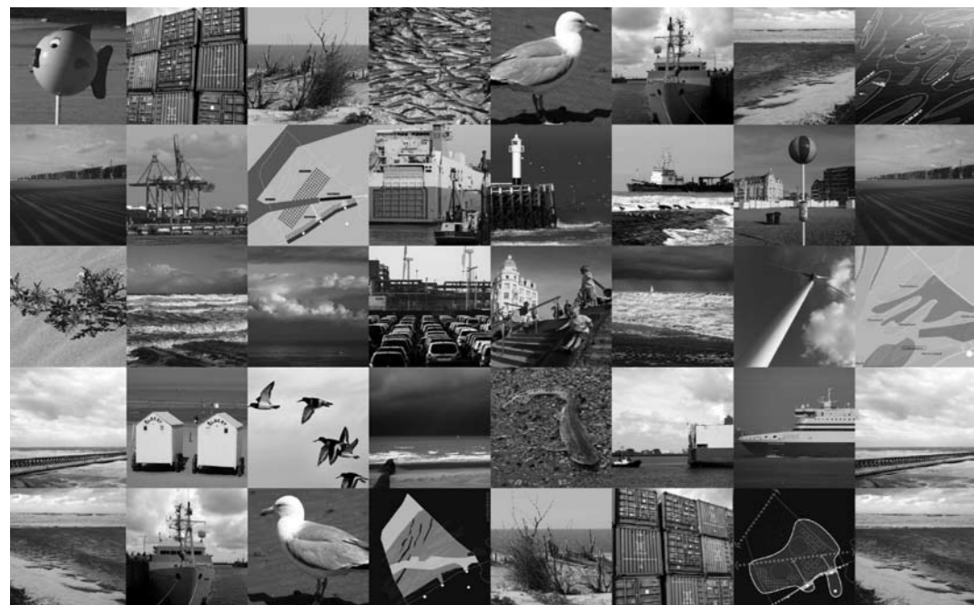
Een zee van ruimte, fragment uit cover boek.