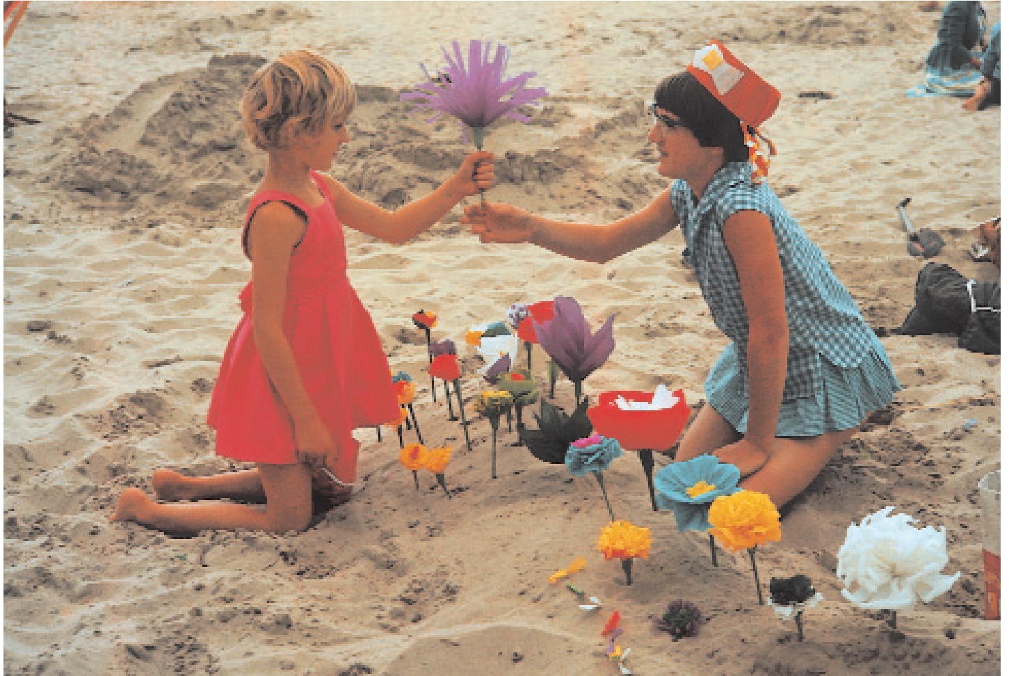
■ Venez achetez - au bon marché - mon magasin est ouvert! Dit liedje hoorde je in de jaren '50-'60 wel vaker op het strand van Oostende als reclameslogan voor de bloemenstalletjes (JH)

In de late jaren '60 en de jaren '70 gebruikte men er wenteltrapjes ( Epitonium clathrus ) om mee te betalen. "Eén bloem kostte toen tussen de 5 en 15 'touvelletjes'. Nu er betaald wordt met - de lokaal niet zo zeldzame - zaagjes, moet je al gauw 100 tot 500 schelpen neertellen per bloem", zegt Fabienne. Aan de Oostkust kost een bloem, naargelang de grootte en de complexiteit, tussen de 3 en de 12 zaagjes. Bloemen met vertakkingen of zijknoppen zijn beduidend meer waard dan enkelvoudige. "In Bredene kun je nog steeds betalen met het zeer zeldzame wenteltrapje" vertelt Roeland. "Het witte huisje van deze zeeslak is inwisselbaar tegen een 50-tal zaagjes".