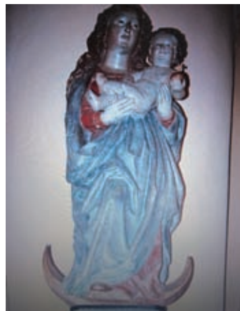
■ Yemanjá zou de Zuid-Amerikaanse versie van Maria kunnen zijn. Beiden worden vaak met de zee en de maan afgebeeld