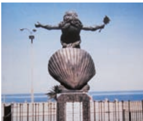
■ In Uruguay, op het strand bij Montevideo staat een beeld van de zeegodin Yemanjá, met open armen naar de zee gericht (Meri Lao)

het bekijken van de lange blauwe en witte gewaden van het 'Lourdes' Mariabeeld, de kleur van de zee en het brandingschuim. Ook het parelsnoer rond haar handen kun je linken aan de zee. En er is meer. Vaak staat Maria afgebeeld op een maansikkel, een verwijzing naar de zeegodin. Ook haar zoon Jezus wordt wel eens als Ichtus (Grieks voor vis) omschreven. En wat gedacht van de christelijke traditie om te dopen door onderdompeling in water? Wat er ook van zij, de zeegodin lijkt verre van verdwenen!