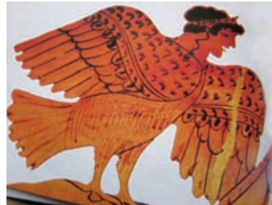
■ Bij Homeros waren de sirenes niet in detail beschreven. Het zou evengoed om vogelvrouwen kunnen gaan. Op Griekse vazen uit de zesde eeuw v.C. worden de sirenes als vogelvrouwen afgebeeld. De geopende mond doet vermoeden dat ze zingen, ook het instrument in hun klauwen wijst op muziek (Vic De Donder)