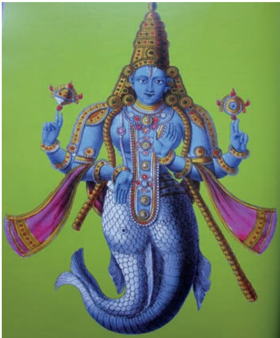
■ Matsya wordt traditioneel afgebeeld met vier armen in het menselijke bovenlijf. Zijn onderlichaam is een vis

Tot de oudste zeemensen horen de Chinese Fuxi en zijn vrouw Nu Guang die als de stichters van de Chinese beschaving worden gezien. Afbeeldingen zijn vooral terug te vinden op Chinese graftombes. In Japan kent men Ningyo, een viswezen met een menselijk hoofd. En in de Indische heilige geschriften of veda's is er sprake van een watergod Trita of Aptya. Ook de god Vishnu wordt vaak afgebeeld als een zeemeerman, vooral in zijn eerste incarnatie als Matsya. In bijna elke Indische tempel kan je trouwens afbeeldingen van Matsya