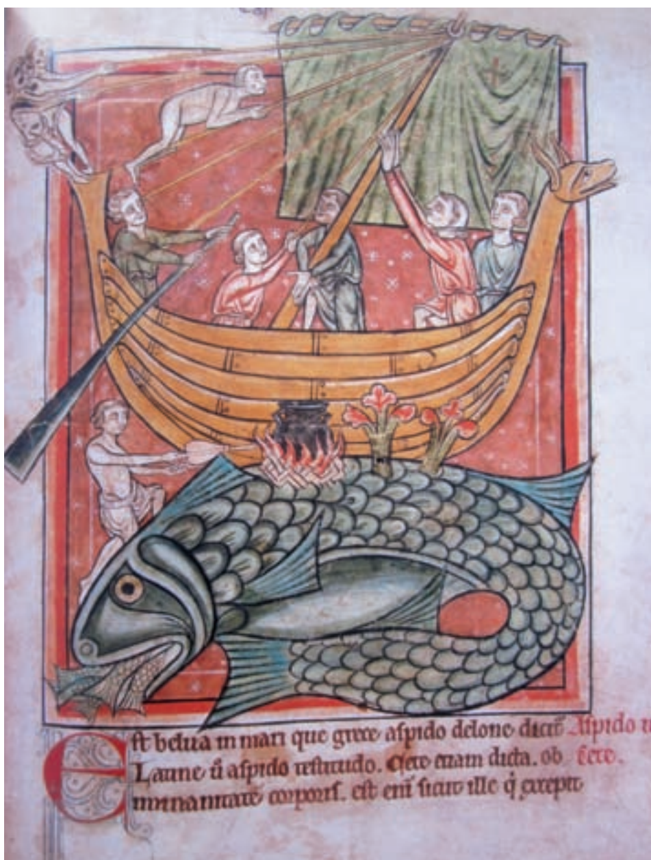
■ Sint-Brandaan moet als straf omdat hij een oud boek in het vuur heeft gegooid, negen jaar lang de wereld rondreizen. Hij neemt een paar monniken mee en beleeft allerlei avonturen. Zo vindt hij een vis die op een eiland lijkt en heeft hij ook een ontmoeting met een zeemeermin (ED)

“Diep in zee is het water zo blauw als de blaadjes van de mooiste korenbloem, en zo helder als het zuiverste glas, maar het is er heel diep, dieper dan enig ankertouw reikt; veel kerktorens zouden boven op elkaar gezet moeten worden om van de bodem af boven het water uit te steken” . Daar woont de kleine zeemeermin met haar vader en haar zussen. Ze verlangt hevig naar een bestaan in de mensenwereld en naar een onsterfelijke ziel. Op haar zestiende mag zij naar het oppervlak zwemmen en de mensenwereld verkennen. Ze wordt verliefd op een mooie prins, maar de liefde wordt ondanks zware