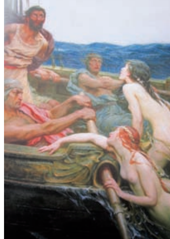
■ Odysseus en sirenes: detail uit Herbert James Drapers 'Ulysses and the Sirens' 1909, de listige Odysseus vastgemaakt

De stijl van Homeros staat bekend als rijkelijk beschrijvend en meanderend, maar bij de sirenes laat hij veel ruimte voor suggestie. Vast staat dat de sirenes kwaadaardig zijn, ze voeren zeemannen in het ongeluk. Waar Homeros de sirenes vandaan haalt (Fenicische zeemansverhalen, oosterse sprookjes of eigen fantasie) blijft onduidelijk. Met hoeveel zijn ze? Maken ze enkel gebruik van hun stem of bedienen ze ook instrumenten? Waaraan sterven de zeelieden? Bovendien laat zijn suggestieve beschrijving ruimte voor de verbeelding van de komende generaties, want zijn het vogelvrouwen of vrouwen met een visstaart? We weten enkel dat het wezens zijn die bij de zee wonen en dodelijke gezangen ten uitvoering brengen.