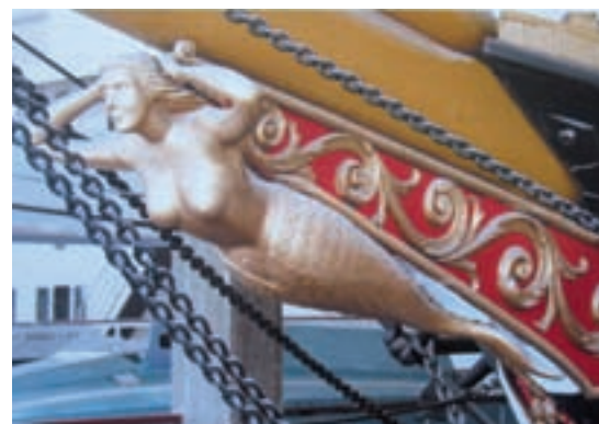
■ Volgens de legende zou Mami Wata, de Afrikaanse meermin, via de meerminnen op de boeg van slavenscheperen naar Afrika zijn gebracht

het bekijken van de lange blauwe en witte gewaden van het 'Lourdes' Mariabeeld, de kleur van de zee en het brandingschuim. Ook het parelsnoer rond haar handen kun je linken aan de zee. En er is meer. Vaak staat Maria afgebeeld op een maansikkel, een verwijzing naar de zeegodin. Ook haar zoon Jezus wordt wel eens als Ichtus (Grieks voor vis) omschreven. En wat gedacht van de christelijke traditie om te dopen door onderdompeling in water? Wat er ook van zij, de zeegodin lijkt verre van verdwenen!