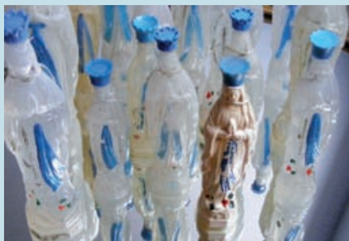
Op de mail-art oproep 'Mer-Mère' van Rudy Cleemput in 2002 om kunstwerken die zee en moeder samenbrengen in de kijker te plaatsen, reageerden meer dan honderd kunstenaars uit de ganse wereld (RC)