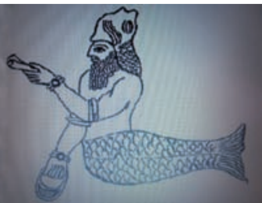
■ De oudste watergod Oannes (of Ea genoemd bij de Babyloniërs). Deze half-vis, half-mens kan beschouwd worden als de eerste zeemeerman (Wikimedia)

De eerste 'officiële' zeemeermin was dan weer de Syrische maangodin Atagartis (Derceto bij de Filistijnen en Grieken). Het is niet zo verwonderlijk dat een