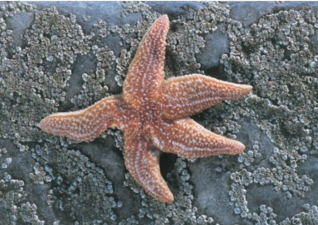
Asterias rubens is de meest bekende en meest algemene zeester van onze zeeën. Ze kan tijdelijk in zeer grote aantallen voorkomen op strandhoofden, waar ze zich voedt met mosselen, borstelwormen en kleine schaaldiertjes (MD).