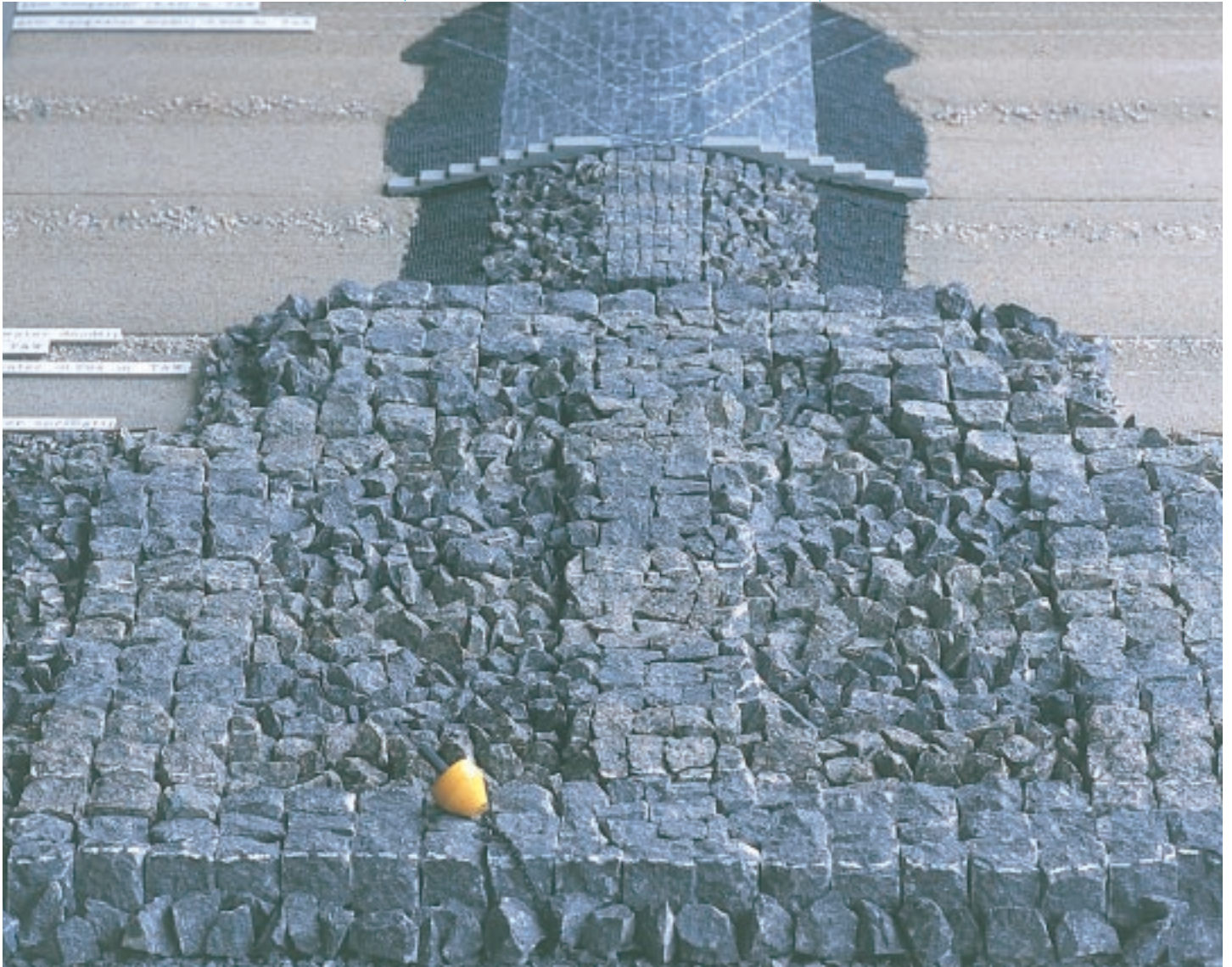
Bij nieuwe constructies zal men meer rekening gaan houden met mogelijkheden voor natuurontwikkeling. Dit schaalmodel illustreert een ontwerp voor een natuurtechnisch strandhoofd en beoogt een grotere diversiteit aan micro-habitaten (MD)