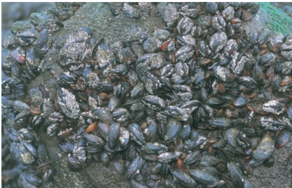
Klompemosselen hechten zich vast aan de stenen constructie met behulp van hun baarddraden. Ze vormen een habitat voor vele andere organismen (MD)