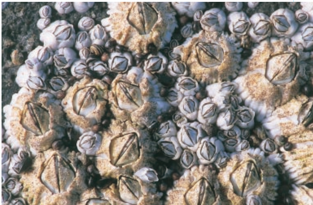
Zeepokken groeien dicht opeen in de middelste zone van het strandhoofd. Bij het uitglijden kunnen ze pijnlijk geschaafde knieën en handen veroorzaken (MD)