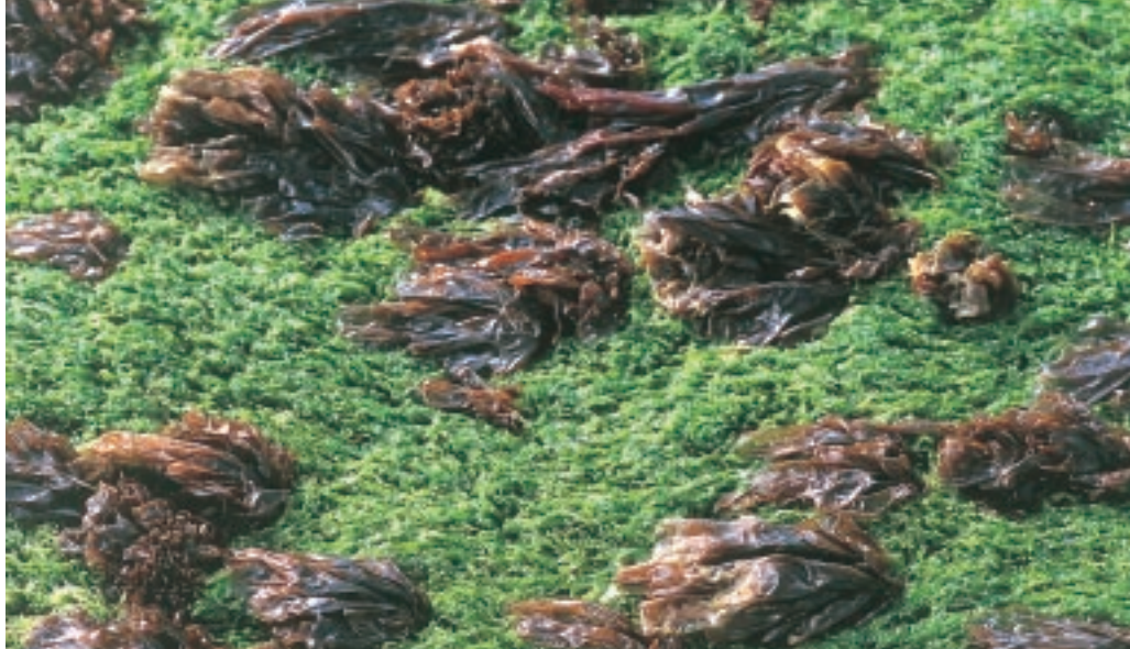
Op een strandhoofd komen Darmwier en Purperwier vaak samen voor (MD)

Meer naar laagwater toe komt een zone voor van dicht op elkaar zittende zeepokken. Vaak zijn ze bedekt met draadvormige kiezelwieren, die hen een bruine kleur geven. Zeer talrijk op strandhoofden is Elminius modestus , de Nieuw-Zeelandse Zeepok. Deze soort is na de tweede wereldoorlog langs onze kust opgedoken. Ze is blijkbaar zeer goed bestand tegen de schurende werking van het zand op en