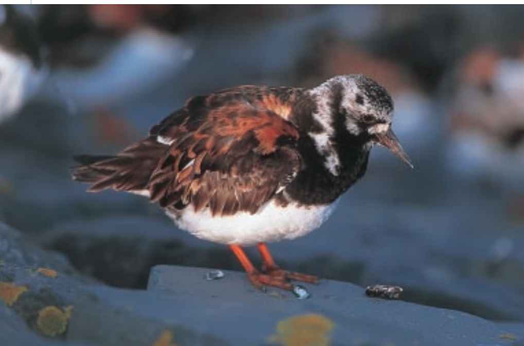
Stelliopters en meeuwen maken gretig gebruik van strandhoofden om er zich bij laag water te voeden. Eén van de meest typische stelliopters op strandhoofden is de Steenloper (MD)

rond een strandhoofd en verdringt er de inlandse Gewone Zeepok ( Semibalanus balanoides ). Meer zeewaarts komt een zone met mosselbedden ( Mytilus edulis ) voor. Recent worden ook steeds meer oesters aangetroffen op onze strandhoofden, voornamelijk op de meer beschutte plaatsen. De Oester Ostrea edulis is in onze streken quasi volledig verdwenen door de virusinfectie Bonamia en is er vervangen door de Japanse Oester ( Crassostrea gigas ), welke veel gekweekt wordt. De schelpdieren zijn dikwijls begroeid met Darmwier, Zeesla en Purperwier.