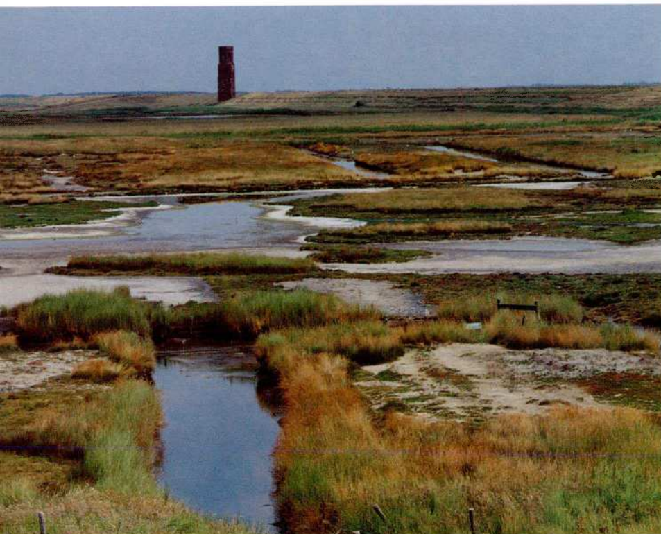
Koudekerkse inlagen nabij Stompeloren op de zuidelijke oever van Schouwen

De Zeeuwse Milieufederatie heeft in 1991 een plan gepresenteerd om het verlies aan zoute natuur op schorren en platen te compenseren. De Tureluur, een markante schor- en slikvogel werd daarvoor het symbool. Het is uniek dat een particuliere natuurorganisatie zowel de initiatiefnemer als de trekker werd van een landinrichtingsproject. De Landinrichtingswet maakt dat mogelijk.