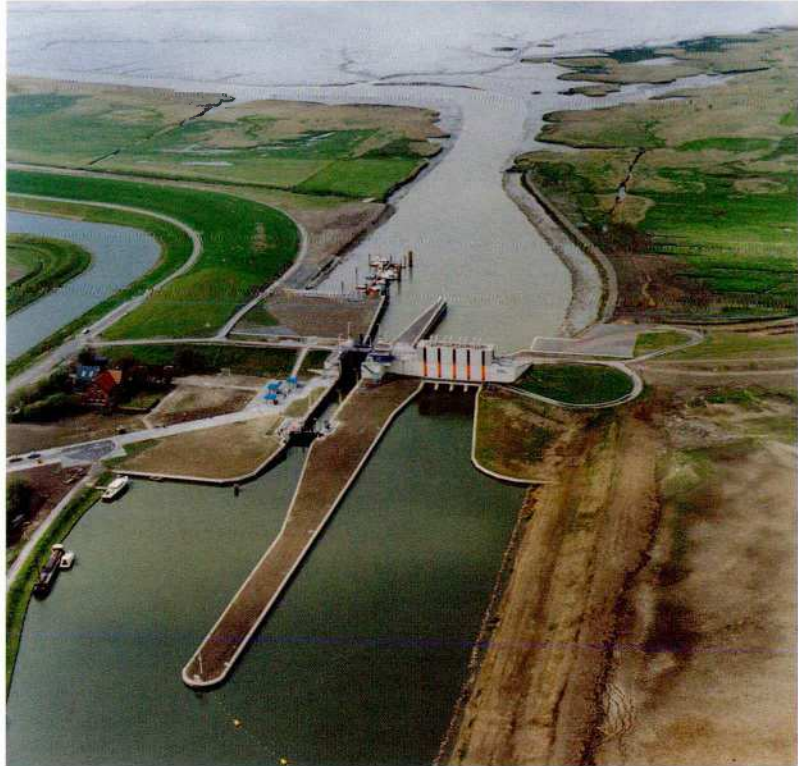
Het sluiscomplex Nieuw Statenzijl vormt een harde barriere tussen de Westerwoldse Aa en de Waddenzee

zaak van creatief omgaan met mogelijkheden voor de ontwikkeling van een 'semi-natuurlijk' landschap. De Westerwoldse Aa biedt zo'n mogelijkheid. De huidige harde overgang van buitendijks zout en binnendijks zoet, zou kunnen worden omgebouwd tot een zachtere grens door van de benedenloop van de Westerwoldse Aa een brakke zone te maken. De eerste aanzet tot dit idee is al enkele jaren oud en opgenomen in de v&w uitgave 'Natuur aan het werk.' Het is tot wasdom gekomen toen Grontmij de mogelijkheid zag om het in één plan te koppelen aan de oplossing voor een waterkwantiteitsprobleem van het waterschap Dollardzijvest. Het waterschap staat op korte en middellange termijn voor ingrijpende maatregelen en investeringen om in de toekomst het overtollig water uit het beheergebied te kunnen blijven afvoeren. Op de korte termijn moet een oplossing worden gevonden voor de dreigende wateroverlast in de stedelijke kern van Oude en Nieuwe Pekela. De kades daar zijn te laag. Ze kunnen om stedenbouwkundige redenen niet