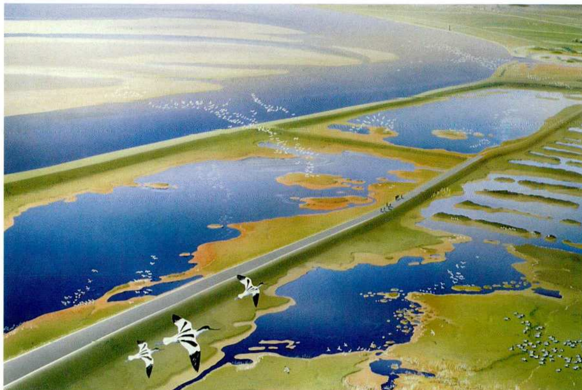
Plan Tureluur in vogelvlucht

aan deskundigen op het gebied van ecologie, natuurbeheer, waterbeheer en alle specialismen die daarmee verband houden.