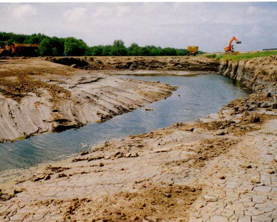
Werk in uitvoering

Onder invloed van de gevoerde waterhuishouding verzoet het gebied echter geleidelijk zodat de brakke kenmerken op den duur zullen verdwijnen. Alle overheden en beheerders die bij het gebied zijn betrokken, zijn er al langere tijd voor om met enkele waterstaatkundige ingrepen in de polder Westzaan een volwaardig brak milieu te herstellen. Daartoe hoeft slechts op gecontroleerde wijze water uit het Noordzeekanaal te worden ingelaten. Bij de Landinrichtingsdienst is deze ingreep op een gegeven moment in de planning opgenomen voor de periode 1996-1997, maar het heeft wel heel lang geduurd voordat deze formele stap werd gezet. Inspraakprocedures met een stevige inbreng van agrarische zijde vertraagden keer op keer een daadwerkelijke actie.