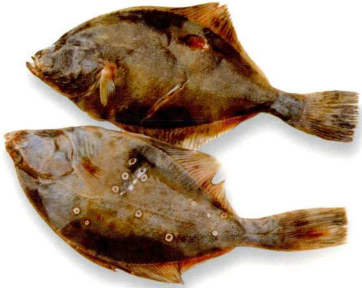
Abrupte wisselingen tussen zoet en zout water zorgen voor zweren en vinrot bij bot

Het spelen met zoet en zout rond de Afsluitdijk is dus nog ver verwijderd van een kiem tot planfase. Toch is het belangrijk dat de ideevorming door middel van een vrij denkproces niet bij voorbaat wordt gefrustreerd maar de nodige ruimte krijgt. Binnen Rijkswaterstaat wordt die ruimte gegeven.