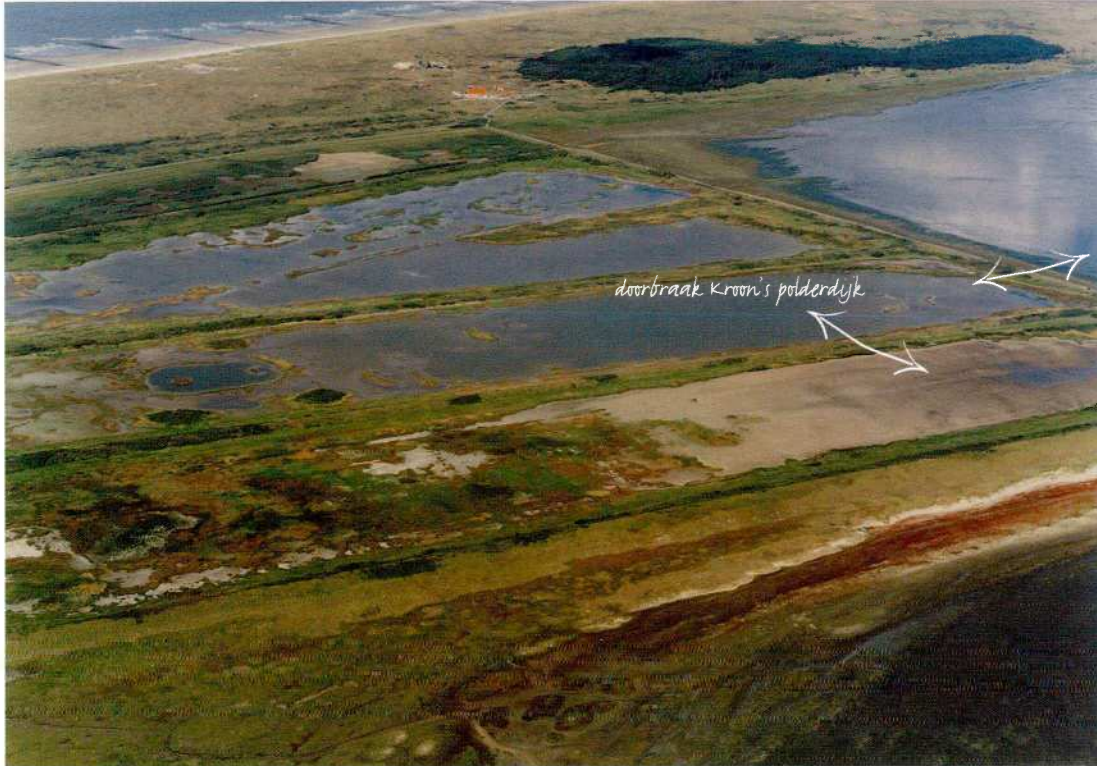
Een opening in de dijk langs het wad en een opening in de dijk die twee polders scheidt is voorlopig voldoende

In de buitenste polder, grenzend aan het Wad, werd bovendien een landingsstrip voor vliegverkeer aangelegd. Beide functies sloegen echter niet goed aan, waarna het gebied min of meer aan zijn lot werd overgelaten. Rijkswaterstaat Noord-Nederland is najaar 1996, in samenwerking met Staatsbosbeheer, begonnen aan de uitvoering van een plan om in de Kroon's Polders weer een zo natuurlijk mogelijke kwelderomgeving te scheppen.