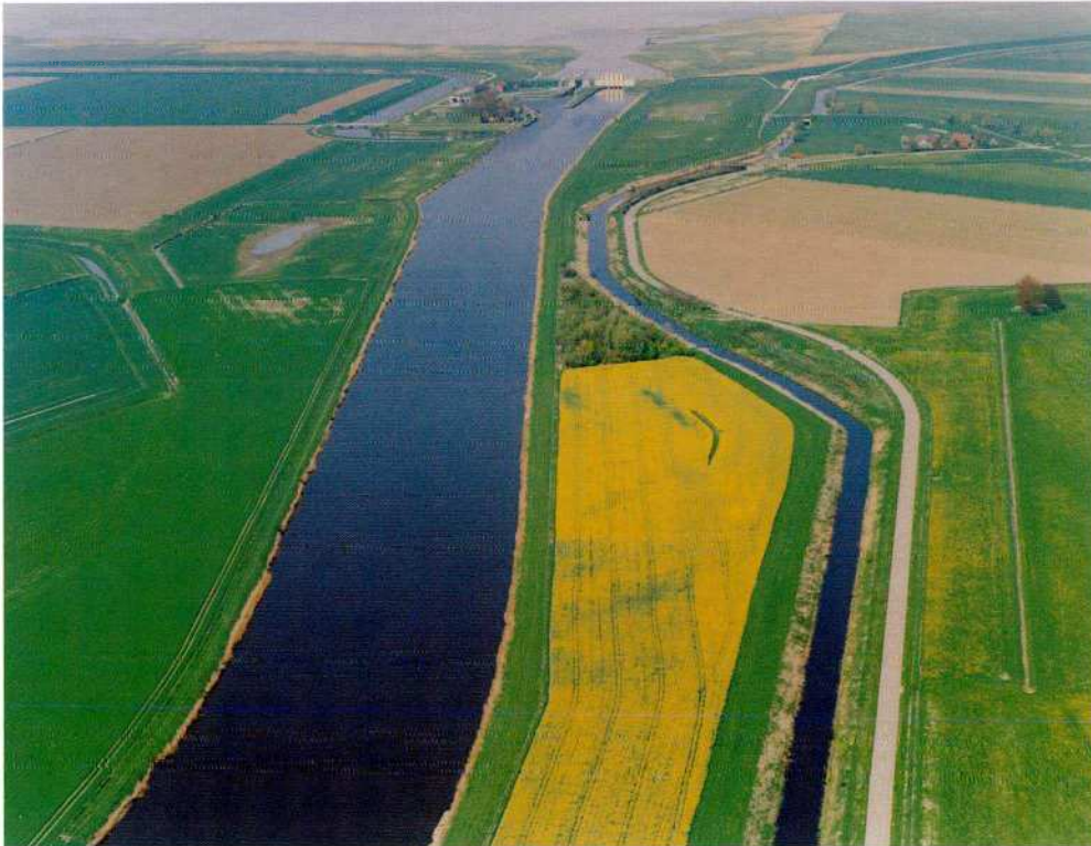
Als de ideeën omtrent de herinrichting van de Westerwolds Aa definitief worden, zullen de rechte lijnen weldra geschiedenis zijn

Het plan zal ook weerstanden kunnen oproepen. Uiteindelijk verandert agrarische grond in nat gebied. De initiatiefnemers wijzen er echter op dat boeren hier geen grond kwijt raken aan een natuurdoelstelling, maar op de eerste plaats aan een waterhuishoudkundig belang dat zij zonder veel fantasie ook als hun eigen belang zullen ervaren.