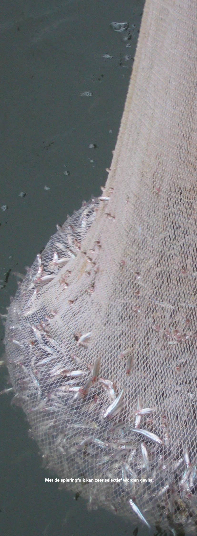
Met de spieringfuij kan zeer selectief worden gevestig.

oppervlaktewater zijn de afgelopen jaren afgenomen. Mogelijk beperkt dit gebrek aan met name fosfaat de algengroei in het voorjaar, en daarmee de aanwas van zoöplankton zoals watervlooien. Daarmee zou het voedsel voor jonge spiering minder talrijk zijn geworden. Toch is deze hypothese over de relatie tussen meststoffen, algen en zoöplankton niet zo hard. Spiering komt namelijk ook talrijk voor in meren met veel minder meststoffen en algen in bijvoorbeeld Scandinavië en Rusland.