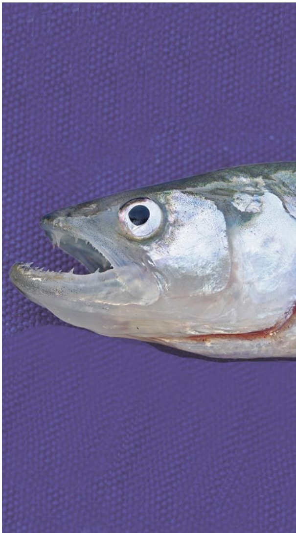
Spiering is een veelvoorkomende, maar toch vrij onbekende soort.

Het spieringbestand daalt al twee decennia gestaag. De spiering is geen gewaardeerde consumptievis, maar als schakel tussen plankton en predatoren wel een belangrijk onderdeel in het voedselweb. Mogelijke oorzaken die een rol spelen in de teruggang van de spiering zijn de temperatuurstijging en het helder worden van wateren. Nader onderzoek moet uitwijzen welke maatregelen deze vissoort er weer bovenop kunnen helpen.