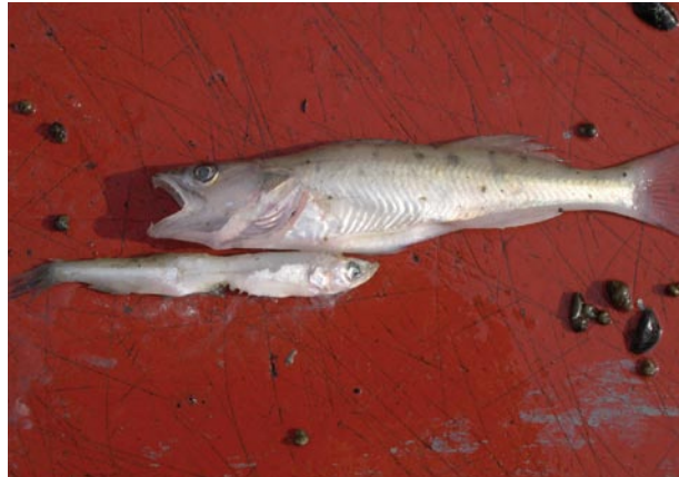
Spiering vormt de schakel tussen plankton en predatoren zoals snoekbaars.

De spieringstand heeft altijd zeer sterk gefluctueerd. Rijke en arme spieringjaren kunnen kort op elkaar volgen. Deze populatiedynamiek past bij een vis die zich als eenjarige voortplant. De spiering komt namelijk in twee levensvormen voor. De anadrome spiering trekt tussen zee en zoetwater, wordt pas na twee tot drie jaar geslachtsrijp en kan een lengte van meer dan twintig centimeter bereiken. Daarnaast is er de kleinere landlocked vorm. Deze leeft uitsluitend in zoetwater, waar hij zich bij een lengte van minder dan tien centimeter al na een jaar voortplant. In Nederland heeft zich na de afsluiting van de Zuiderzee een grote landlocked populatie gevormd. De trekkende spiering komt in veel kleinere aantallen voor in de Waddenzee, het noorden van het IJsselmeer en de