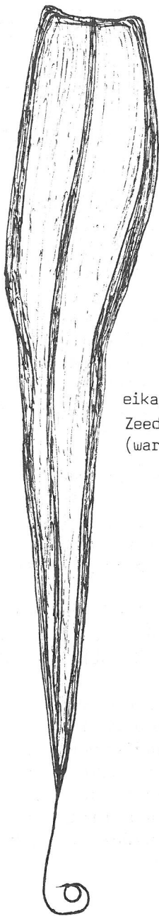
eikapsel van de Zeedraak (ware grootte)