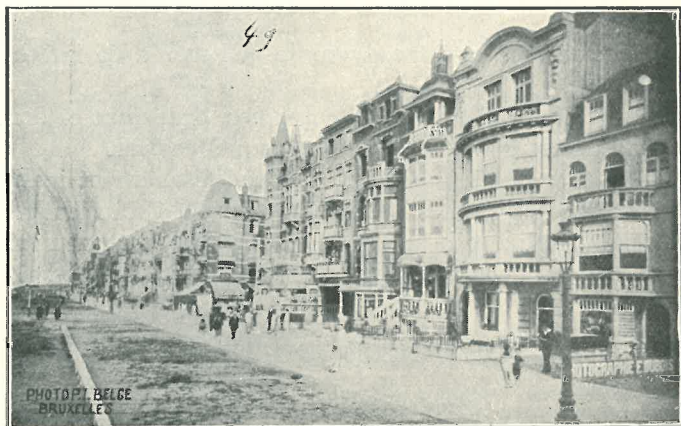
La Panne. — La digue.

Une centaine d'hôtels et de pensions de famille, 600 villas