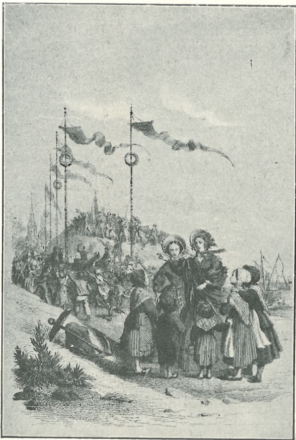
Arrivée à La Panne, en 1831, de S. M. Léopold I er .

Dans la matinée du 17 juillet 1831, une grande animation règne à La Panne. Partout les préparatifs de fête sont acti-