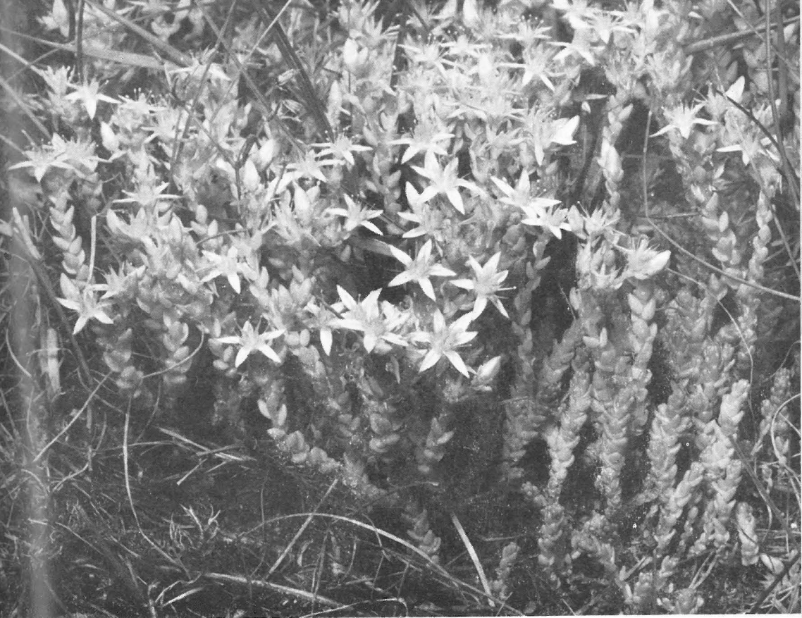
Sedum acre - muurpeper.