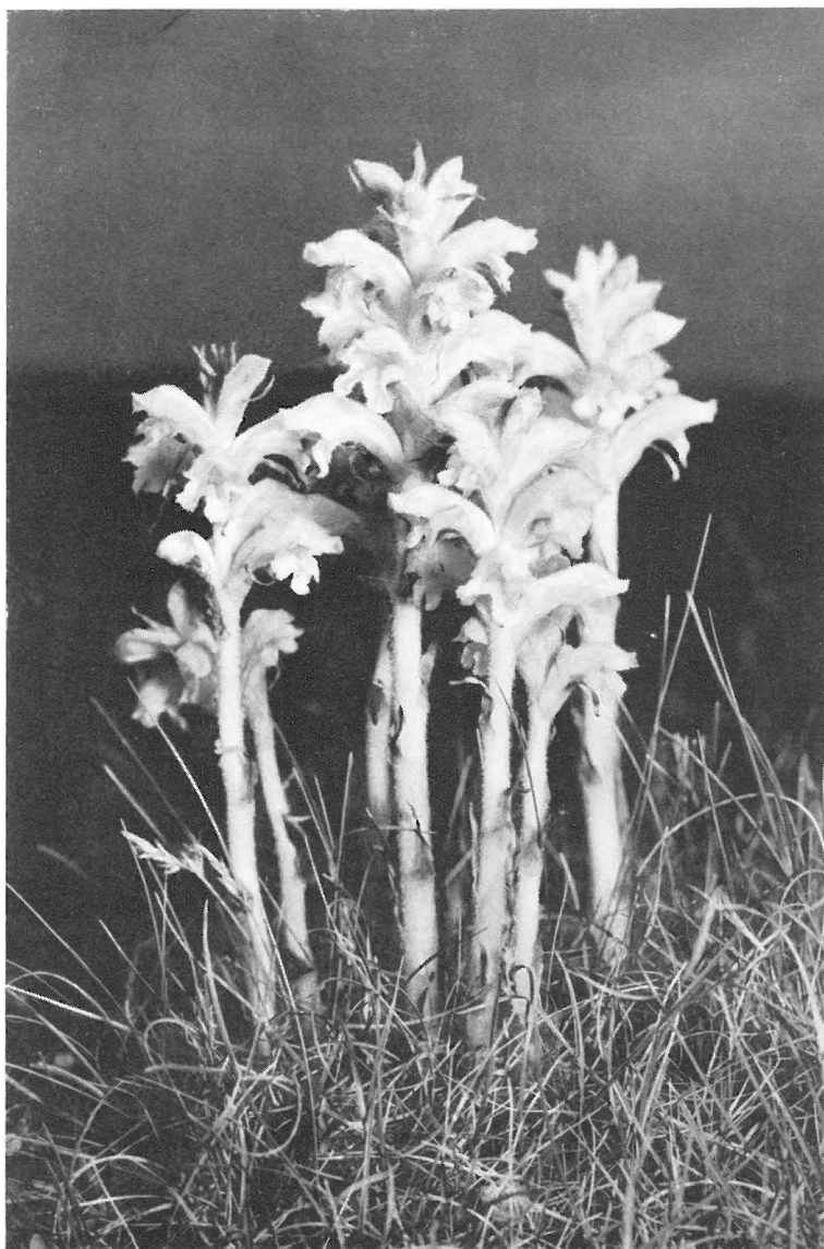
Een Bremraap uit het Zwin.

De ooievaars beginnen rond te vliegen, er werd zelfs één onzer ooievaars in Duitsland teruggevangen.