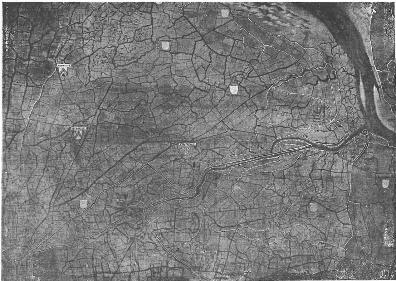
FRAGMENT VAN EEN KAART VAN POUBBUS (einde XVI e eeuw).