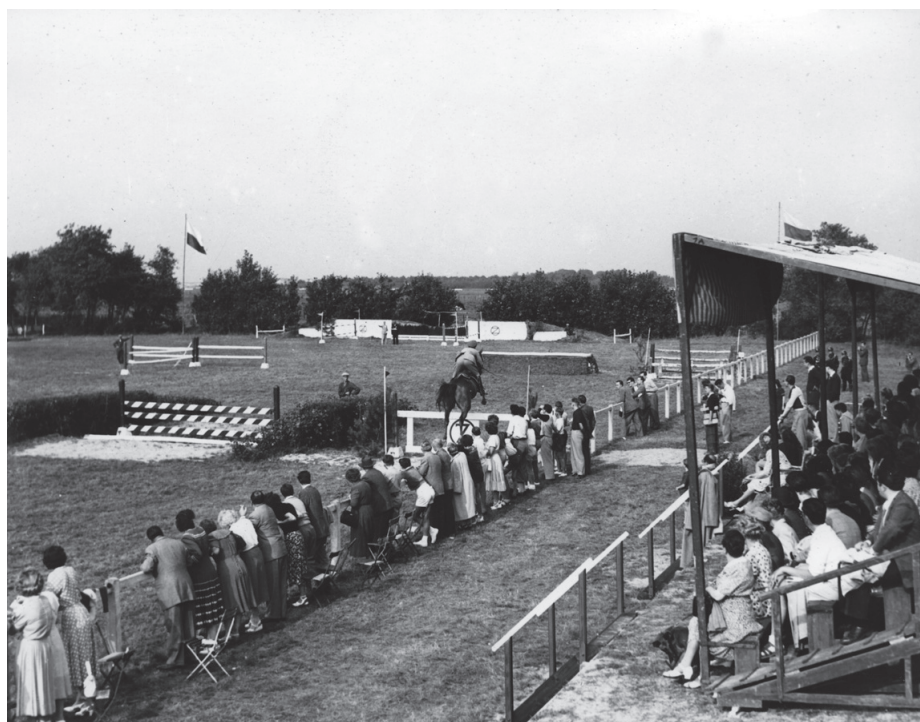
Jaarlijks jumpingevenement in de Kleyne Vlakte tot 1960, genaamd 'Concours Hippique'