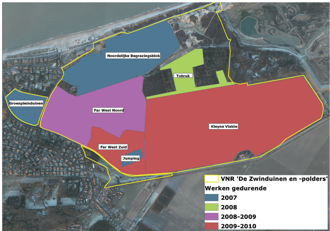
Planning van de natuurherstelmaatregelen van het LIFE-natuurproject ZENO (ANB, Copyright Eurosense Belfotop NV, 2008)