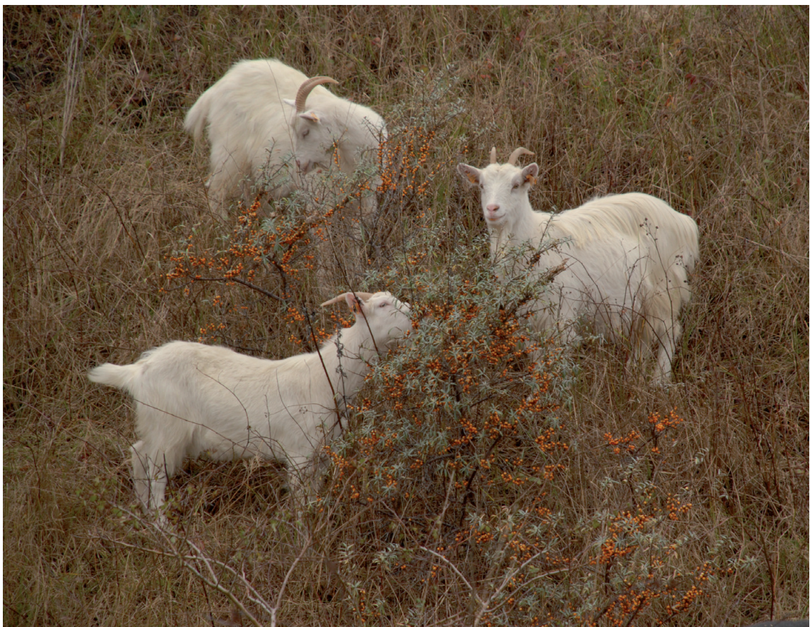
Duinengeitjes in het Noordelijke begrazingsblok

Door enkele dieren per hectare in te scharen - maar niet meer dan één à twee per hectare, anders worden er te veel planten opgegeten en vertrappeld - worden heel wat grassen en struiken in toom gehouden en wordt een mozaïeklandschap verkregen. Nog een voordeel is dat via de uitwerpselen van de grazers zaden verspreid worden en zeldzame paddenstoelen kansen krijgen zich te ontwikkelen. In natuurgebieden wordt meestal gewerkt met zelfredzame dieren zoals Shetlandpony's, Schotse Hooglandrunderen, Poolse konikpaarden.