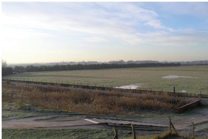
Kleyne Vlakte voor de werken

In september 2009 gingen graafmachines aan het werk om het originele landschap van de Kleyne Vlakte in zijn volle glorie te herstellen. Door het graven van kreken en poelen werden opnieuw natte milieus gecreëerd. Zo worden er opnieuw kansen gegeven aan watervogels (verschillende eendensoorten, ganzen en steltlopers) en aan andere watergebonden dieren en planten.