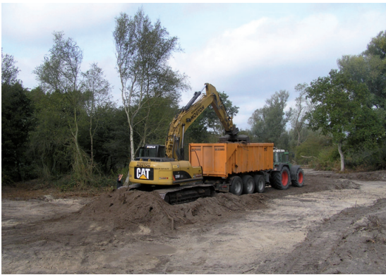
Plagwerken in de Far West