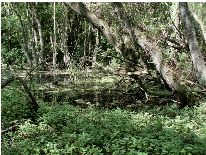
Dichtgroeide zandwinningsput in het deelgebied ‘Tobruk’

Dankzij de goede resultaten van de voorbije LIFE-projecten aan de kust, greep het Agentschap voor Natuur en Bos (ANB) opnieuw zijn kans om een LIFE-natuurproject aan te vragen voor dit natuurgebied. In de loop van 2005 heeft het ANB dan ook bij de Europese Commissie een projectvoorstel ingediend. Het projectvoorstel ZENO werd in het najaar 2006 goedgekeurd.