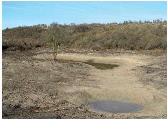
Herstel van een duinenpoel in de Noordelijke Begrazingsblok