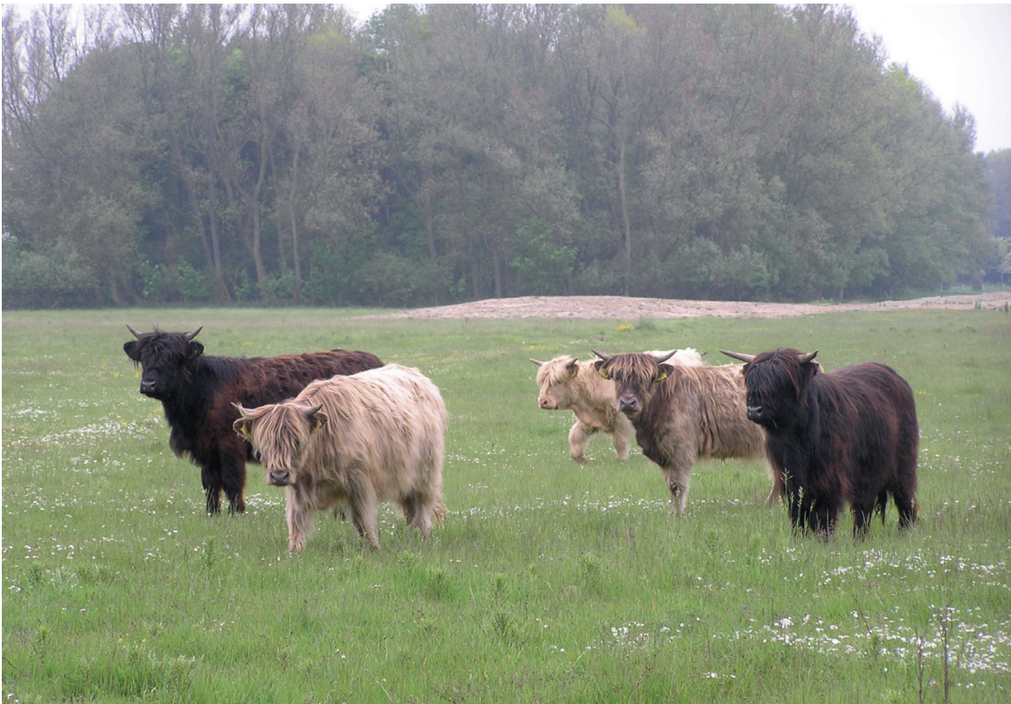
Schotse hooglandrunderen in de Kleyne Vlakte

Het LIFE-natuurproject ZENO heeft vier begrazingsblokken gerealiseerd en één kleine blok behouden, samen goed voor 168 ha. Die zijn te voet toegankelijk. Honden zijn er niet in toegelaten om interactie met de grazers te vermijden.