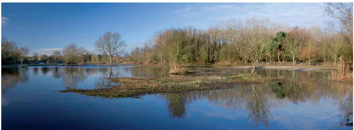
Herstel van de vochtige duinvalleien in het westen van het natuurreservaat (Far West - December 2009)

manier werd opnieuw een aantrekkelijk landschap gemaakt voor verschillende typische duinplanten en zeldzame amfibieën zoals de boomkikker, de kamsalamander en de rugstreeppad. Die grootschalige natuuringrepen werden uitgevoerd in het deelgebied de Groenpleinduinen, de Noordelijke Begrazingsblok en Far West.