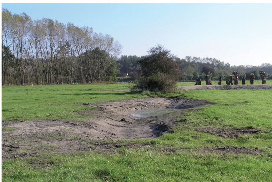
Jumpingsite net na de werken met een nieuwe poel (oktober 2007) (foto ANB)