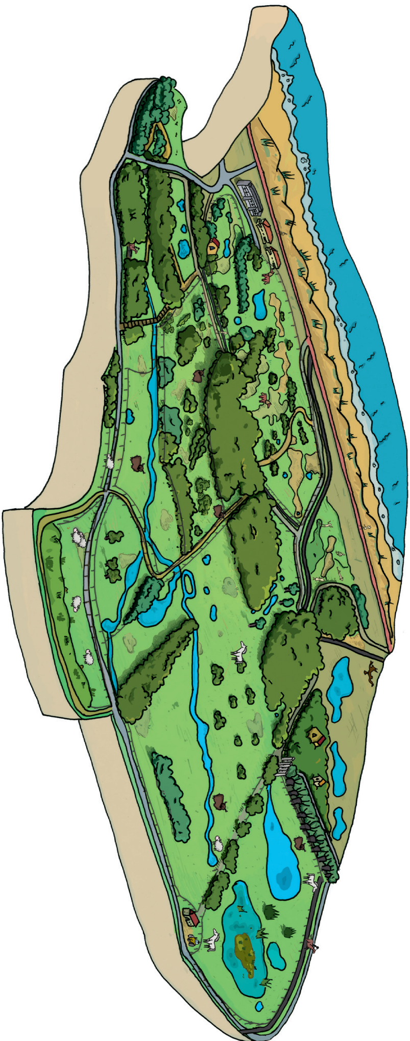
Simulatiekening van het Vlaams Natuurreservaat De Zwirduinen en polders