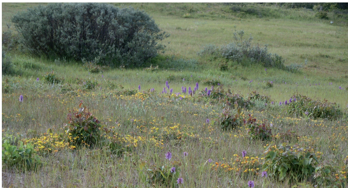
Europees beschermde vochtige duinvalleien

Een tweede belangrijke doelstelling is de communicatie met de bezoekers en omwonenden. Dit door de organisatie van een infoavond, een informatiebrochure, geleide wandelingen, een tentoonstelling, werfborden, persberichten en een website.