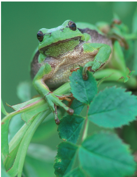
Boomkikker ( Hyla arborea )

De beheermaatregelen voor de Zwinduinen en -polders zijn beschreven in het goedgekeurde beheerplan. Daarin staat een gedetailleerde beschrijving over hoe de natuur in dit gebied hersteld en behouden kan worden, en hoe dat herstel en behoud verzoend kan worden met de verlangens van de verschillende recreanten (wandelaars, fietsers en ruiters).