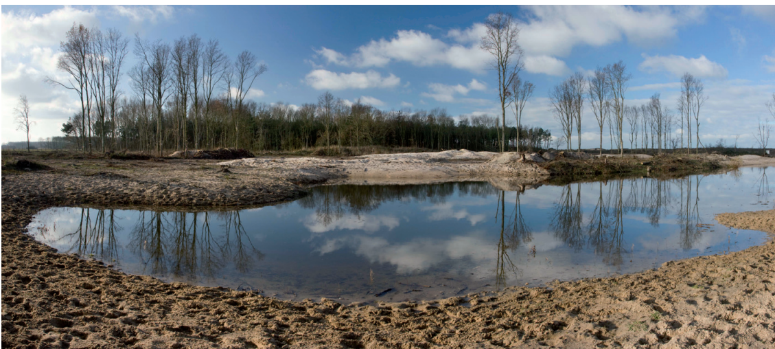
Hersteld terrein in en rond de oude zandwinningsputten in Tobruk

De zandwinningsputten die ernstig verland waren, werden grondig aangepakt. Ze werden opnieuw uitgediept en verbreed. De oevers werden weer minder steil gemaakt. Op die manier ontstonden er opnieuw open waterplassen, waardoor de waterkwaliteit aanzienlijk verbeterde. Dat biedt grote voordelen voor zowel de water- en oeverplanten als voor de lokale fauna. Met die werkzaamheden hopen we vooral om de Europees beschermde kamsalamander ( Triturus cristatus ) en de boomkikker ( Hyla arborea ) een geschikt habitat aan te bieden.