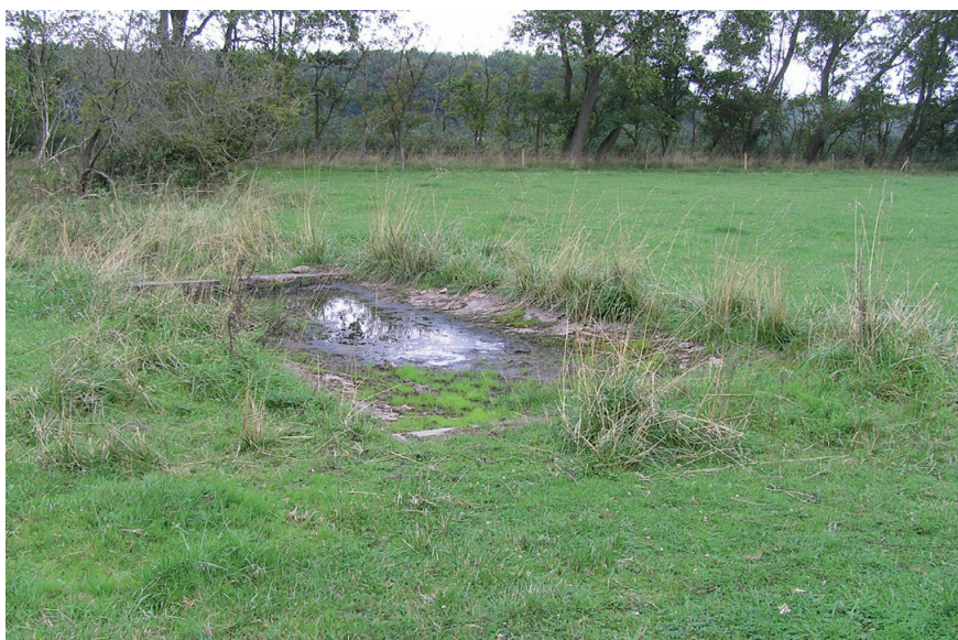
Jumpingsite voor de werken met een overbegroeide springbak

Over het hele natuurgebied werden ook meer dan 17,5 km prikkeldraad en heel wat betonnen palen verwijderd.