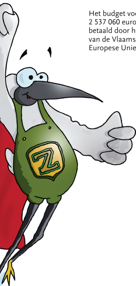
Kleine Zilverreiger Egretta garzetta

Het budget voor dit natuurherstelproject bedroeg 2 537 060 euro. De helft van dat bedrag werd betaald door het Agentschap voor Natuur en Bos van de Vlaamse overheid, de andere helft door de Europese Unie.