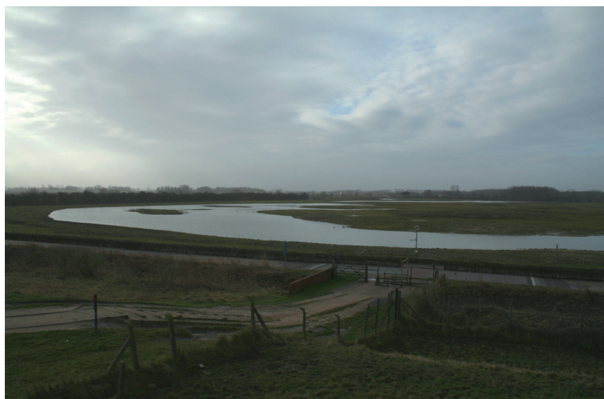
Na de werken (januari 2011)