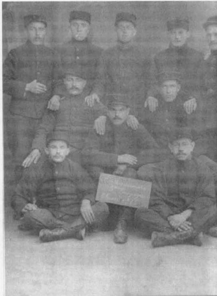
25. Oostendse vissers, gemobiliseerd in Frankrijk (1915)

Ofschoon allicht oprecht gemeend, was deze brief vermoedelijk niet vrij van een zeker opportunisme, meer bepaald ingegeven door de vrees dat de Duitsers, misnoegd door de onbesuisdheid van de vissers, de visserij tijdelijk of misschien zelfs definitief zouden kunnen stopzetten. De toon waarin deze brief werd geschreven wijst evenwel op een zekere vorm van toenadering in de richting van de bezetter. En dit is een interessante vaststelling in verband met het polemologisch onderzoek (een nog zeer jonge wetenschap) aangaande de verhouding - meer bepaald op langere termijn - tussen een bezettende overheid en een bezette volksgemeenschap. Dit onderzoek sluit dan aan bij het meer algemeen sociologisch onderzoek naar de evolutie in de verhouding en relaties tussen twee of meer zeer onderscheiden groepen die met of naast elkaar binnen hetzelfde territorium moeten leven.