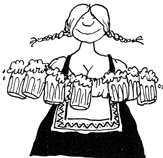
Isabeau de Bavière (d'après des racontars)

33. Isabelle van Oostenrijk (ook van Beieren).- Zou volgens de Fransman Pierre Peret de moeder van Jeanne d'Arc zijn. (P.Perret : Les grandes Pointures de l'histoire. Plon.)