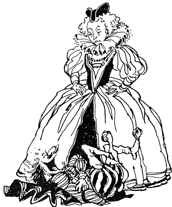
Marie de Médicis demandant l'heure à Concini

43b. Maria de' Medicis.- ... dus toen trouwde hij maar met Maria de' Medicis. Deze had niets anders dan last met haar minister Concini.