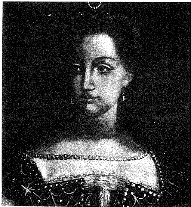
Diane de Poitiers en déesse-lune.

39a. Diane de Poitiers. Diane was al een hertogin van Valentinois voor ze als hofdame bij de koning in dienst kwam. Beeldschone weduwe op haar 31 ste . Had grote invloed op de koning. Hier als maangodin.