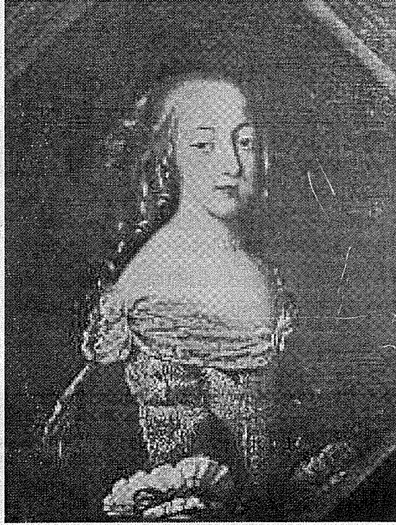
45a. Mme de Montespan.-Eigenlijk Françoise-Athénaïs marquise de Rochechouart, Schonk de koning zeven kinderen. Viel in ongenade en werd in een klooster gestopt. Ze raadde Louis haar vriendin de Maintenon aan.