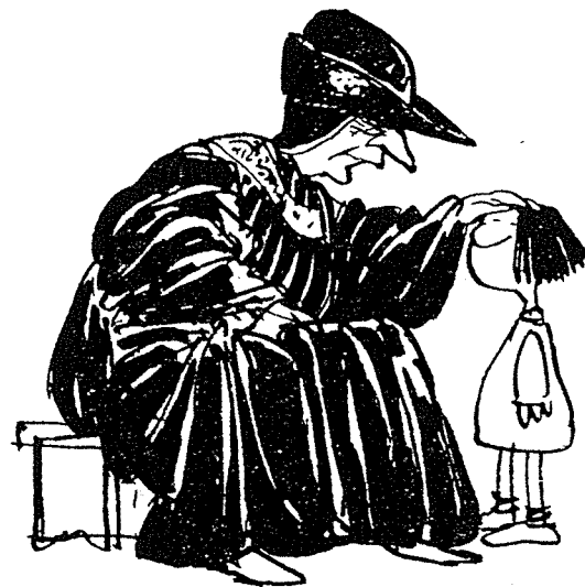
Louis XI et une fillette

35. Lodewijk XI.- Had het steeds aan de stok met Karel de Stoute... en met onze vissers.