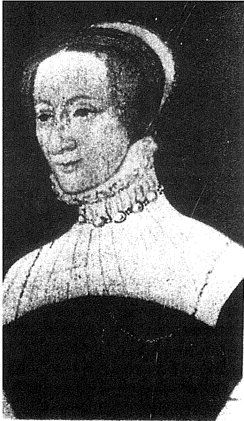
Marguerite de Navarre.

43c Margaretha van Valois, van Navarra of van Angoulême, zijn eerste echtgenote, zuster van Frans I. Stond op mystiek gebied onder invloed van onze Erasmus. Zeer literair aangelegd.