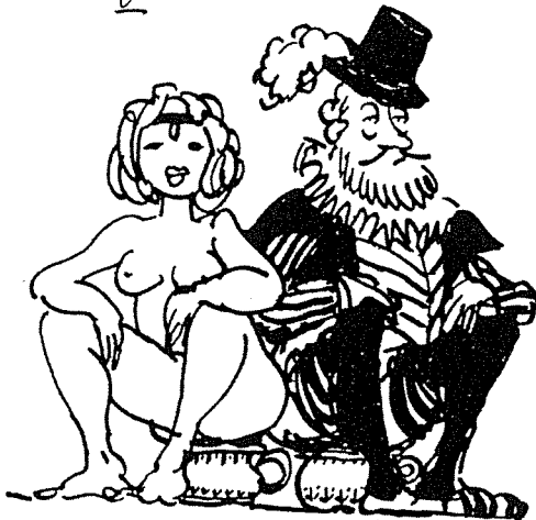
Henri IV et sa poule au pot

le vert galant = vrouwen- liefhebber le Vert Galant = Henri IV