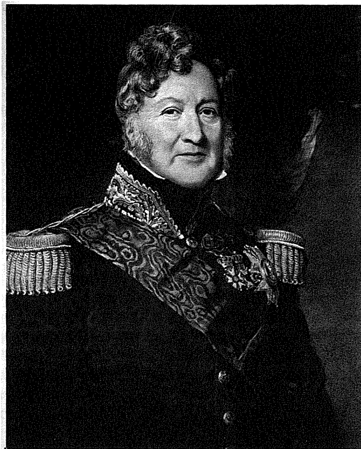
L. M. Louis Philippe, Roi des Français, 1841.

51. Lodewijk Filip < a.neef 46 1830 x Marie-Amélie