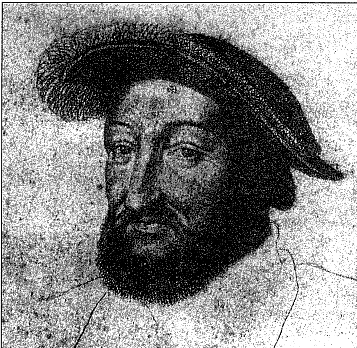
38. Frans I.- De koning van de pracht en de praal. Riep Leonardo da Vinci en Benvenuto Cellini aan zijn hof.

Frans I en Karel V sluiten een bestand om de veiligheid van onze vissers te verzekeren. Ook Frans I laat in zijn paleis Brugs tapijtwerk ophangen.