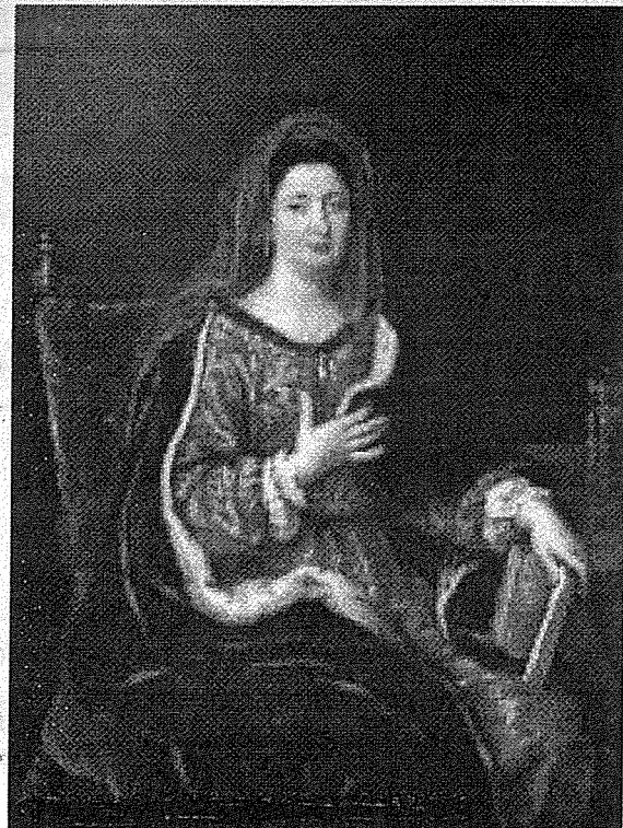
45b. Mme de Maintenon. - Eigenlijk Françoise marquise d'Aubigné met wie hij na de dood van zijn koningin een morganatisch huwelijk zou sluiten. Trok zich na zijn dood terug in een klooster. Stichtte scholen en