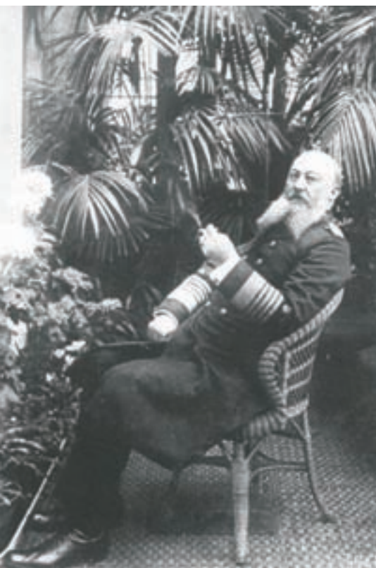
■ Alfred von Tirpitz

Op 23 augustus werd admiraal Ludwig von Schröder als bevelhebber van deze divisie aangeduid. Hij had, jaren geleden,