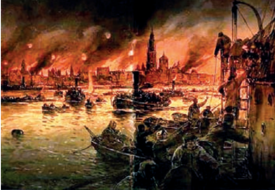
■ Dit schilderij van Willy Stöwer toont de vlucht uit Antwerpen over de Schelde aan het einde van het beleg in 1914 (Wikipedia)

in opdracht van von Tirpitz, al eens een plan uitgewerkt om de haven van Antwerpen met een verrassingsaanval in te nemen. Hij behoorde tot de marineofficieren die zich zeer goed bewust waren van het belang van de Belgische havens. Het was dan ook geen toeval dat zijn mannen net bezuiden de Antwerpse fortengordel werden gepositioneerd. Dat hiermee een van de grootste havens van Europa binnen bereik lag, was uiteraard niet onbelangrijk voor de maritieme strategie van de Duitse admiraliteit.