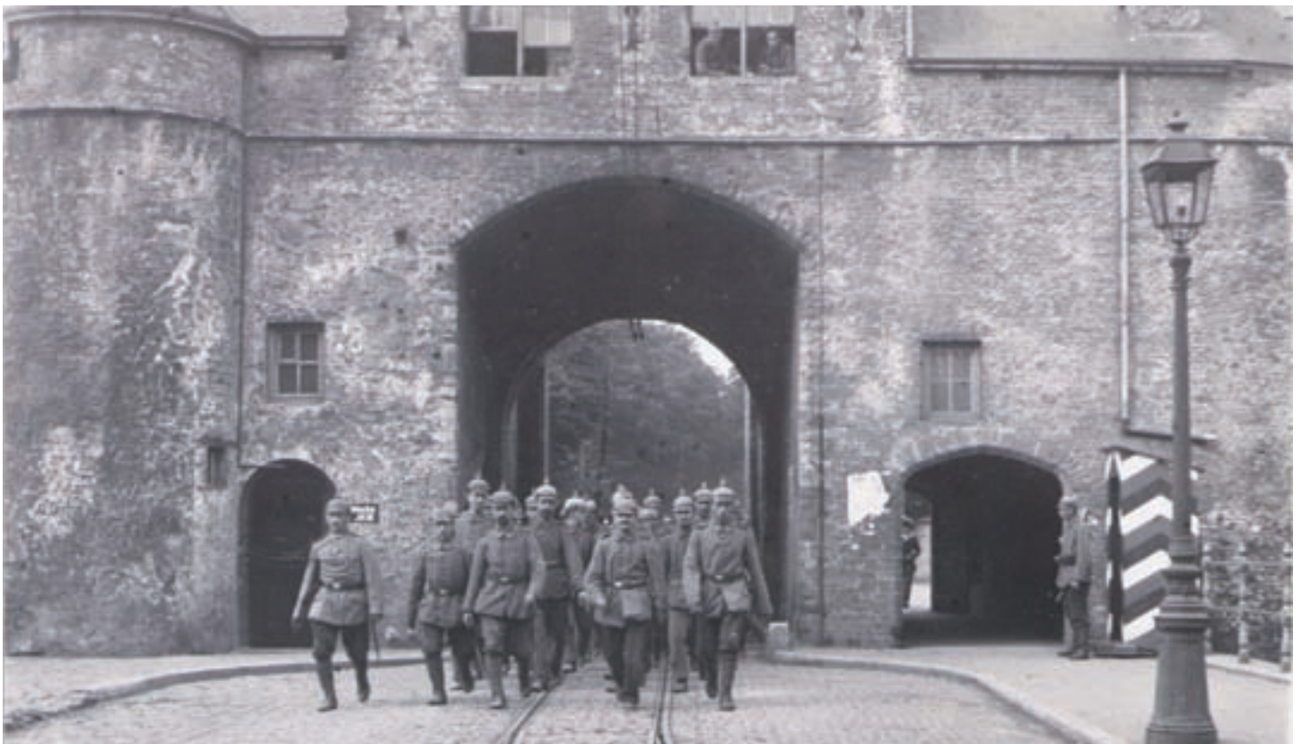
■ De Duitse bezetters aan de Smedenpoort in Brugge

Dat stopte de Duitse opmars echter niet. Het zwaartepunt van de strijd verschoof naar West-Vlaanderen. De geallieerden slaagden er daardoor niet in om het Belgische leger opnieuw een basis te laten inrichten in de regio Oostende. De troepen moesten verder in de richting van de Franse grens. Te elfder ure werd beslist stand te houden bij het