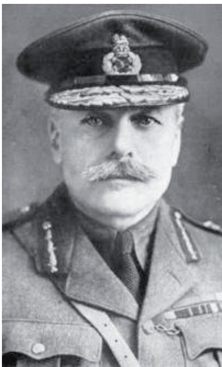
■ Douglas Haig

De Belgische regering in Le Havre hield er in die tijd ernstig rekening mee dat ze zou moeten oversteken naar Engeland. Dat bleek echter niet nodig. De Duitse lenteoffensieven