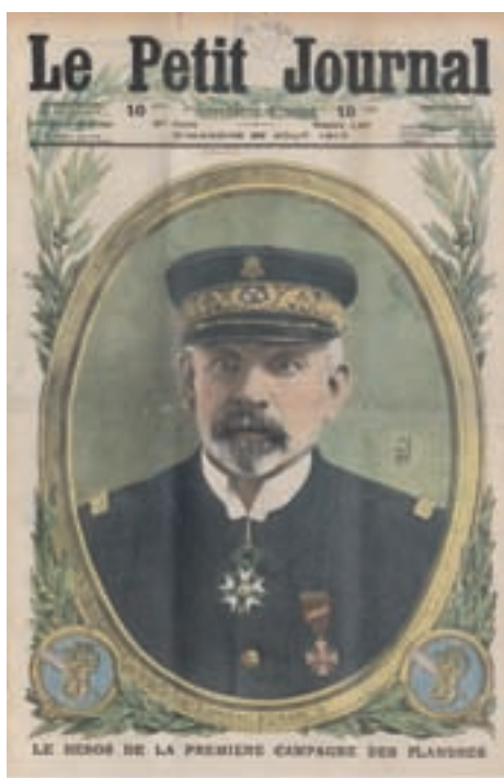
■ Een beeld van Ronarc'h in Le Petit Journal van augustus 1917 (Bibliothèque Nationale de France)

Het kwam er nu op aan een strategie uit te werken voor een oorlog van langere duur. De Duitse marine was daarbij vast van plan de smalle kuststrook in West-Vlaanderen ten volle te benutten. Nergens was ze zo dicht bij de Britse kust en bij de aanvoerhavens waarlangs Britse troepen naar het westelijk