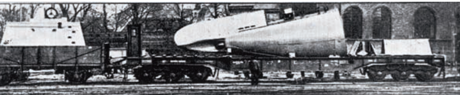
■ De onderdelen van de UB10 worden per trein van Antwerpen naar de kust vervoerd (Tomas Termote)

De Abteilung Hafenbau en Kanalwesen die aan von Schröder was toegewezen, deed ondertussen zijn best om de havenfaciliteiten en de verbindingen via de binnenvaart zo snel mogelijk te verbeteren. Het was immers via de binnenvaart dat de aanvoer in belangrijke mate moest gebeuren. Er werden voor dit strijdtoneel kleine onderzeeboten