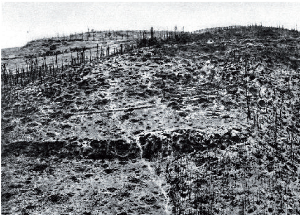
■ Tijdens de Eerste Wereldoorlog was de Kemmelberg, die op 1,5 km van het dorp Kemmel ligt, een strategisch punt en werd door de strijdende partijen zwaar bevochten. Tijdens het voorjaarsoffensief van 1918 namen Duitse troepen bezit van de Kemmelberg. De volgende dag vond een Franse tegenaanval plaats, maar de Duitse troepen rukten op tot aan de Dikkebusvijver. De gevechten gingen door tot eind juli 1918. Op 5 september werd de Kemmelberg heroverd door de geallieerde troepen met hulp van de Amerikanen. Na de gevechten was de heuvel kaal. Hij werd opnieuw beplant met loofboomsoorten (Wikipedia)

bloedden langzaam dood en in augustus 1918 was de machtsbalans weer naar geallieerde kant verschoven. Nu was de tijd gekomen om zelf “eindoffensieven” te plannen. In het noorden werd een internationale “legergroep Vlaanderen” gevormd die formeel onder leiding stond van koning Albert I. De Belgische divisies vormden de noordelijkste strijdmacht. Het kustgebied en de polders werden in het aanvalsplan echter letterlijk links gelaten. De Belgische opmars ging uit van het gebied bezuiden Diksmuide. Het was de bedoeling systematisch op te rukken over een breed front. Op die manier zou de kust in Belgische handen vallen. De opmars verliep echter relatief traag. Dat maakte het mogelijk voor de Duitse marine om de troepen van het Marinekorps Flandern van de omsingeling te redden en admiraal von Schröder toe te laten na vier jaren weer naar Duitse bodem te trekken. Ondertussen was in de thuisbasis van de keizerlijke vloot te Kiel de opstand begonnen. Het einde van de oorlog was in zicht. Het zou ook het einde van de keizerlijke marine worden.