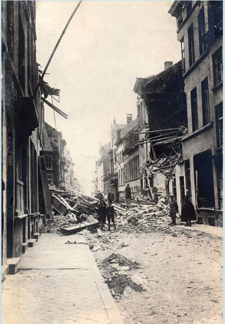
■ Oostende leed zwaar onder de bombardementen. Dit is een foto van de Christinastraat in 1917. Zoals het in de hele stad was, liggen ook hier een groot deel van de huizen in puin

De secretaris van deze Raad van Vlaanderen sprak meteen de Duitse autoriteiten aan met de vraag wat ze