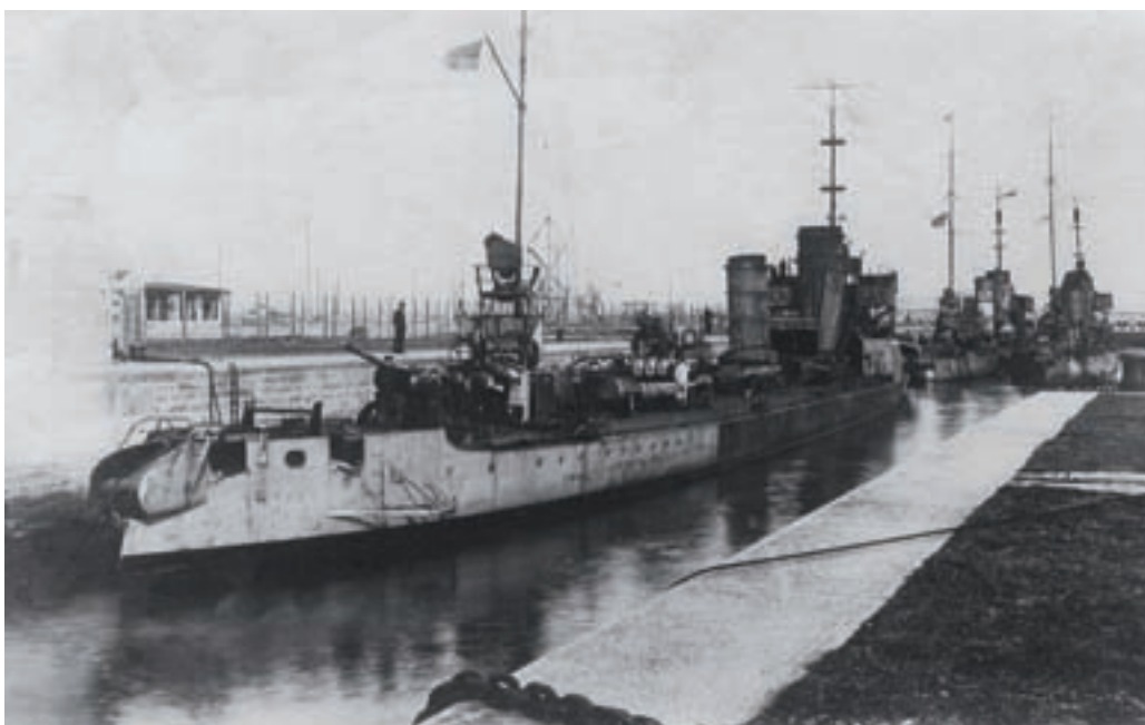
■ Een G- en S-klasse Zerstörer liggen klaar voor vertrek in de sluis te Zeebrugge (Tomas Termote)

met andere woorden op als een verlengstuk van de kustbatterijen. Daarnaast moesten ze Britse mijnen en netversperringen opruimen. De Zerstörer werden vier maal ingezet om Calais te beschieten. Daarnaast installeerden de Duitsers langeafstandsgeschut waarmee de Franse haven en vesting Duinkerke kon beschoten worden. De Duitsers beseften dat de aanwezigheid van hun marine in Oostende en Zeebrugge voor de Britten onverteerbaar was. Ook al slaagde de Flandernflotille er nooit in om de bevoorrading en versterking van de Britse troepen op het continent echt te onderbreken, toch bleef de dreiging zwaar wegen. Het uitschakelen van die bedreiging kon echter alleen via een grootschalige operatie te land.