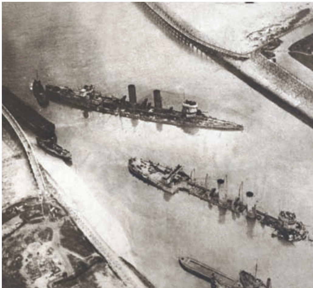
■ Positie van de blokschepen Iphigenia en Intrepid in de Zeebrugse haven na de raid

De twee vlootonderdelen voeren samen tot enkele mijl uit de kust. Dan scheidden hun wegen. De bedoeling was de vloeten gelijktijdig in Zeebrugge en Oostende te laten aankomen, zodat de Duitsers geen tijd zouden hebben om elkaar te waarschuwen. Bij een van de eerdere pogingen waren de plannen voor de raid namelijk al in Duitse handen terecht gekomen. Toen de Duitsers in Zeebrugge