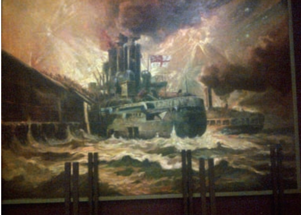
■ Dit schilderij in het Gemeenschapshuis van Zeebrugge toont de raid op Zeebrugge met de nodige dramatiek (Decler) [1]

Daarnaast gingen de geallieerden vanaf 1917 terug over op het instellen van konvooiën. Konvooiëring had al verschillende eeuwen zijn nut bewezen. Het idee is simpel, koopvaardij schepen samen laten varen onder begeleiding van enkele oorlogsbodems. Het mag dan ook verwondering wekken dat de geallieerden deze techniek aanvankelijk niet hanteerden tijdens de Eerste Wereldoorlog. De argumenten tegen konvooiën waren uiteenlopend. Als een konvooi een vijandelijk slagschip tegenkwam, had het geen schijn van kans, tenzij het ook beschermd werd door een slagschip. Ieder konvooi laten vergezellen door een slagschip was dan weer veel te duur. Varen in konvooi betekent ook dat men maar zo snel kan varen als het