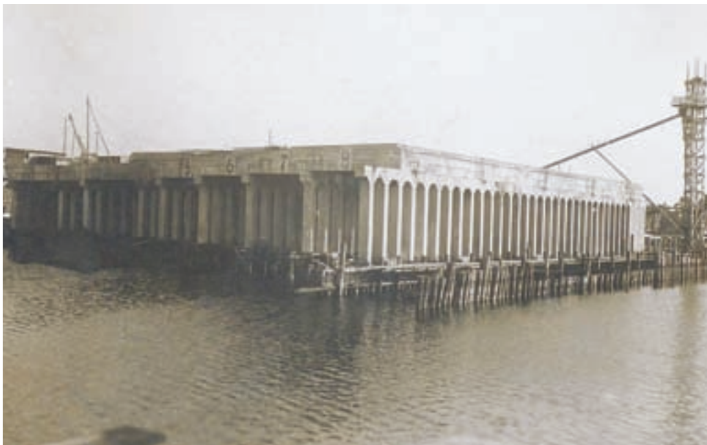
■ Om hun duikboten verder te beschermen bouwden de Duitsers in de Brugse haven een duikbootbunker. Deze werd in de jaren '50 van de vorige eeuw afgebroken

Toen in 1914 WOI uitbrak heerste de optimistische idee dat het een korte oorlog zou zijn. Langs beide zijden was men overtuigd van een snelle en glorieuze overwinning. Het doel van het Duitse plan Schlieffen om, via België en Luxemburg, het Franse leger uit te schakelen en de Kanaalhavens in Frankrijk te veroveren om zo makkelijker Groot-Brittannië te kunnen aanvalen, werd niet gehaald. De Duitse opmars werd onder meer gestopt door