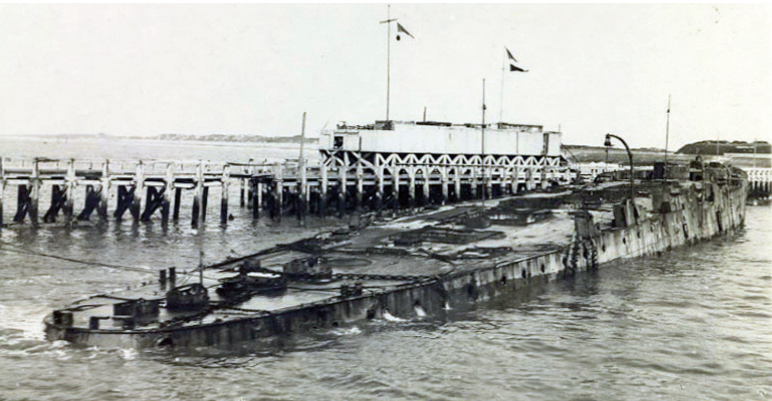
■ De gezonken Vindictive tegen de havendam in Oostende

De twee raids samen kostten aan meer dan 200 Britse militairen het leven. Aan Duitse zijde sneuvelden slechts enkele soldaten. In het licht van de verliezen die men aan het IJzerfront te verduren had, was dit aantal voor de Britten aanvaardbaar. Maar waren de Britten in hun opzet geslaagd? Wat was de perceptie van deze raid in beide kampen? Hoe beïnvloedde dit wapenfeit het verdere verloop van de oorlog? Om een antwoord te vinden op de vraag of de Britten in hun opzet waren geslaagd, volstaat het om na te gaan of de havenmonden van Zeebrugge en Oostende effectief waren afgesloten. Voor Oostende was dit niet het geval. De Vindictive had zich vanwege haar kapotte schroef niet dwars op de havengeul weten te leggen. In Zeebrugge waren de Intrepid en Iphigenia beter gepositioneerd, maar toch was er na enkele dagen al een nieuwe vaargeul achter de schepen gecreëerd. Onderzeeërs en torpedobootjagers konden dus snel na de raid de havens al weer verlaten. Moreel was de raid wel een succes voor de Britten. De raids hadden dan wel niet het verhoopte doel bereikt, overal was te lezen dat ze wel geslaagd waren. De Engelse propagandamachine stelde de hele operatie verder wel voor als een