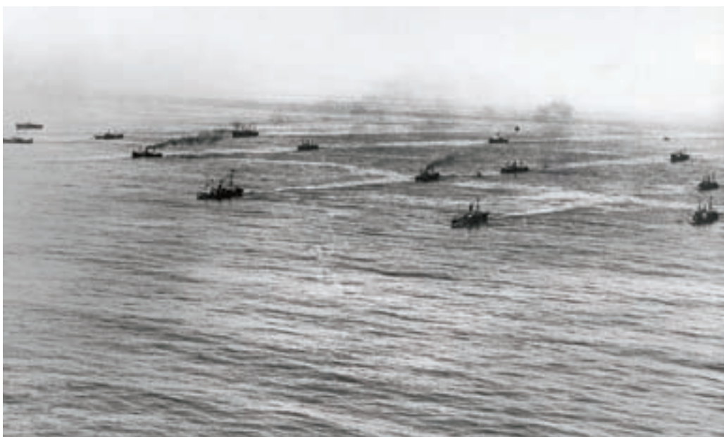
■ Een Brits konvooi van de Royal Navy zigzagt door een gevarezone in de Atlantische Oceaan [2]

traagste schip. Bovendien moet men wachten in de haven tot er een nieuw konvooi vertrekt om terug te keren. Men dacht hierdoor veel tijd en efficiëntie te verliezen. Tot slot dachten de Britten dat het lossen van een heel konvooi de capaciteit van een haven boven het hoofd kon groeien.