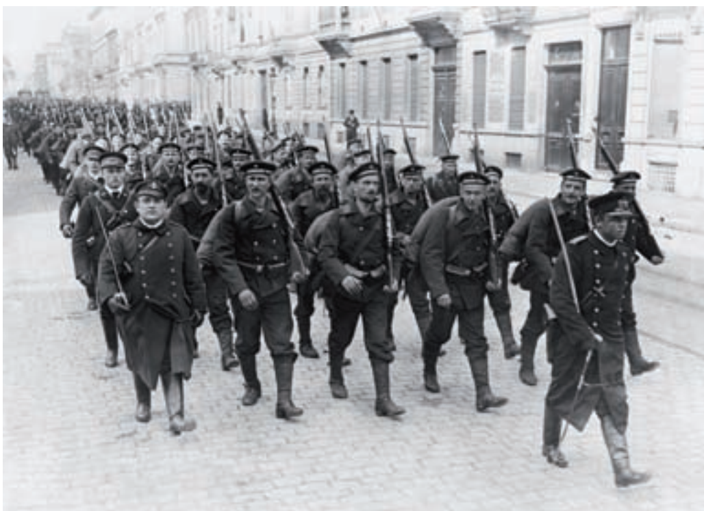
■ De intocht van de Marine-Divisie in Brussel