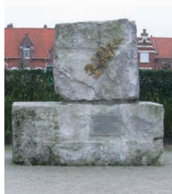
■ Links: Het oorspronkelijke monument op de hoek van de De Maerelaan en de zeedijk in Zeebrugge werd tijdens de Tweede Wereldoorlog afgebroken en meegevoerd naar Duitsland. Het huidige monument dateert van 1984. Rechts: De stukken van de havendam waartegen de Vindictive botste, op het Admiraal Keyesplein in Zeebrugge

ook heel wat andere maatregelen om Duits scheepvaartverkeer in het Kanaal te bemoeilijken. Hij liet onder meer extra antidiikbootnetten plaatsen met mijnen en richtte antidiikbootpatrouilles in. Onderzeeërs hadden dan de keuze: gekelderd worden door de patrouilles of verstrikken in de geplaatste mijnenetten. Al deze maatregelen en omstandigheden zorgden er voor dat de Duitse onderzeeërs en torpedoboten in het Kanaal het steeds moeilijker kregen om de bevoorrading van de geallieerden te verstoren.