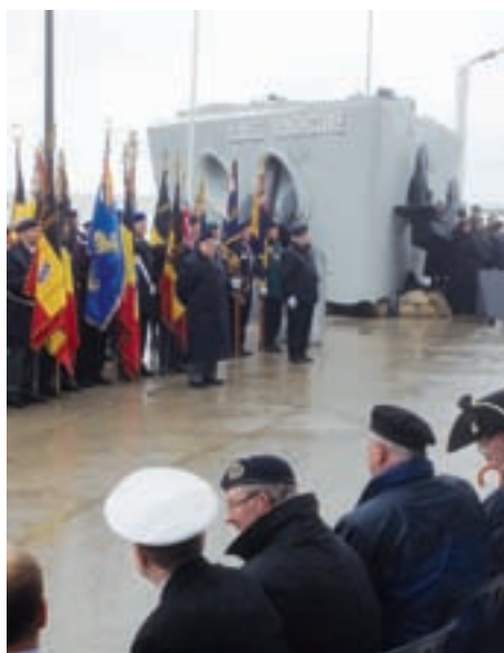
■ Boven: Het Vindictivemonument in Oostende werd recent verplaatst. Onder: De boeg van de HMS Vindictive op de nieuwe locatie nabij het Oostendse oosterstaketsel tijdens de plechtige inhuldiging op 24 mei 2013

vernietigd. Duitse oorlogsbodems moesten vanaf dan terugkeren naar Duitsland voor herstellingen.