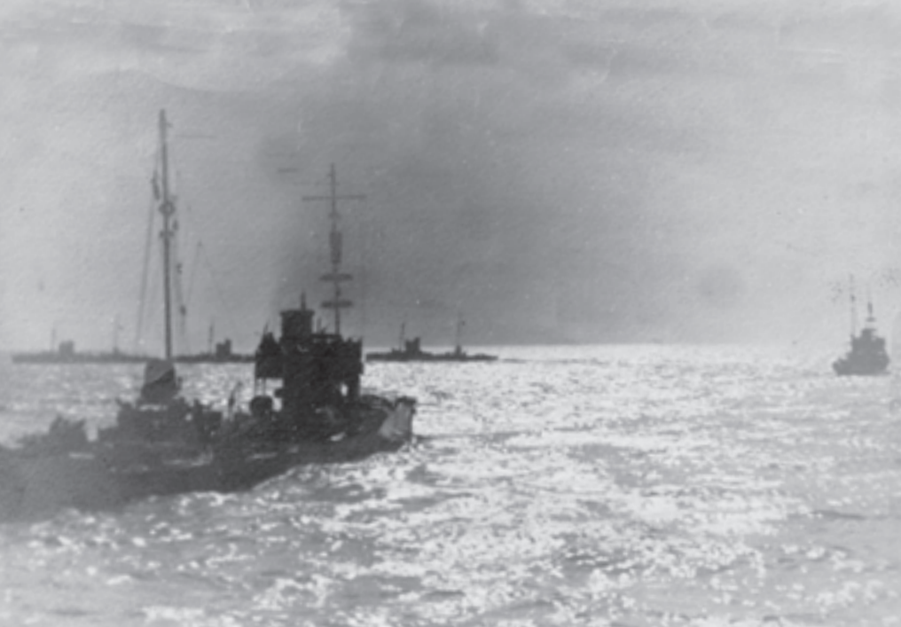
■ Enkele Duitse torpedoboten van het Flandern Flottielje op weg naar de Engelse kust

de onderwaterzetting van een deel van de IJzervlakte. De Duitsers hadden enkel Zeebrugge en Oostende weten te veroveren. De Britten wilden deze havens aanvankelijk niet vernietigen omdat ze uitgingen van een spoedige herovering. Zeebrugge en Oostende konden dan van pas komen bij de troepenbevoorrading. Ook de Duitsers zagen deze havens slechts als tijdelijke tussenstop. Zeebrugge en Oostende waren dan wel relatief intact in Duitse handen terechtgekomen, er was geen verdediging aanwezig en ze waren niet uitgerust voor het aanmeren, repareren en onderhouden van een oorlogsvloot.