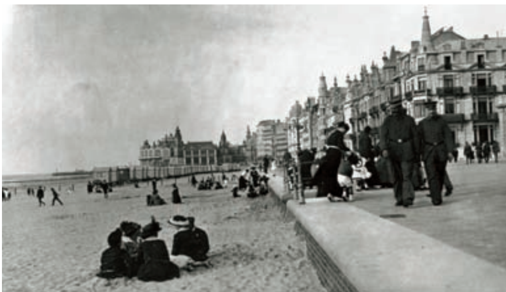
■ Het contrast tussen de officierenzone en het strand voor de burgers. Een bord aan het begin van de vakkundig met prikkeldraad ingedeelde badzone duidt de exclusieve gebruiker aan: "Nur für Offiziere". Tegenaan de dijklooiing werd een rij badkarren geplaatst waar de officieren zich konden omkleeden vooraleer het zilte nat op te zoeken. Burgers mochten tevreden zijn dat ze op het strand getolereerd werden, maar over badkarren beschikten zij niet