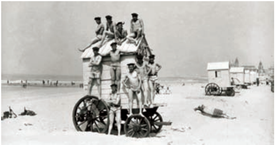
■ Een postkaart die door de troepen vaak naar de 'Heimat' werd gestuurd is deze van een groep soldaten die op een badkar is geklauterd op het strand van Oostende. Het kostuum is nu een zwembroek, maar met het militaire hoofddeksel op. Met dergelijke postkaarten werd het thuisfront gerust gesteld en gesust zodat de oorlogsinspanningen konden blijven doorgaan (Collectie Erwin Mahieu)