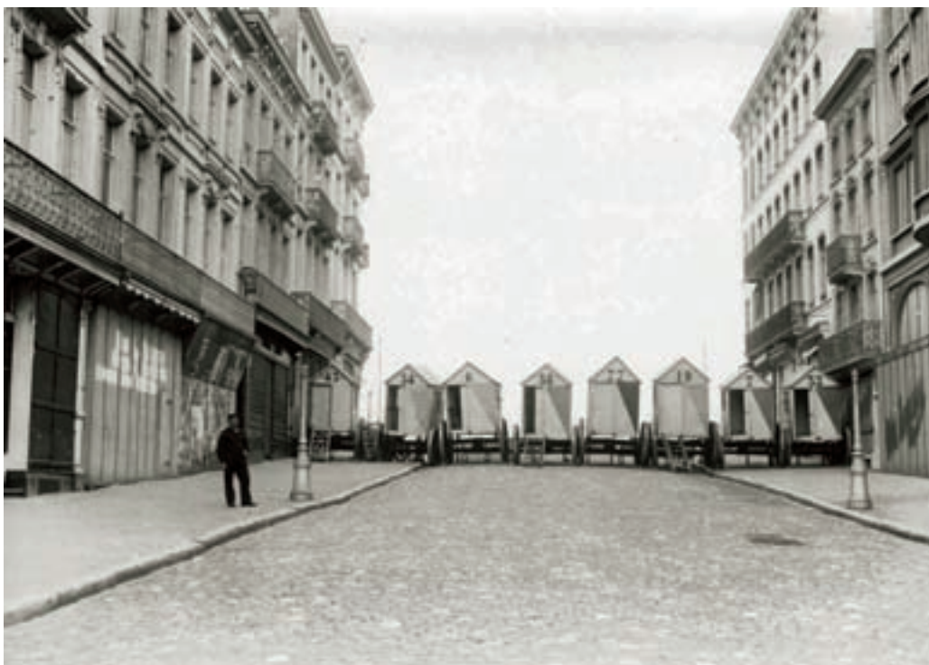
■ Als één van de eerste maatregelen genomen na de bezetting van Oostende verbood plaatscommandant Tägert het vrij rondwandelen op de Zeedijk. De hellingen die op de dijk uitgaven, werden versperd met o.a. badkarren aan elkaar ‘genaaid’ met prikkeldraad. We zien hier de Vlaanderenstraat in de richting van de Zeedijk

In de eerste dagen van de bezetting consolideerden de Duitsers hun stellingen door geschut in te graven op o.a. de Oostendse Zeedijk. Ook plaatsten ze buitgemaakte kanonnen op strategische punten zoals hoge duintoppen in de veroverde kustplaatsen. De Duitse militaire overheid nam het bevel over de stad Oostende over en maakte de nieuwe regels aan de bevolking diets ondermeer m.b.v. “Bekanntmachungen” en “Befehlen”. Het eerste artikel in de “Bekendmaking” van 21 oktober van plaatscommandant Tägert in Oostende luidde als volgt: “De toegang van de Zeedijk en van het strand is verboden op het grondgebied van stad Oostende. De personen die op de Zeedijk wonen moeten voorzien zijn van een toegangs-bewijs”. De dag nadien, op 22 oktober komt reeds een