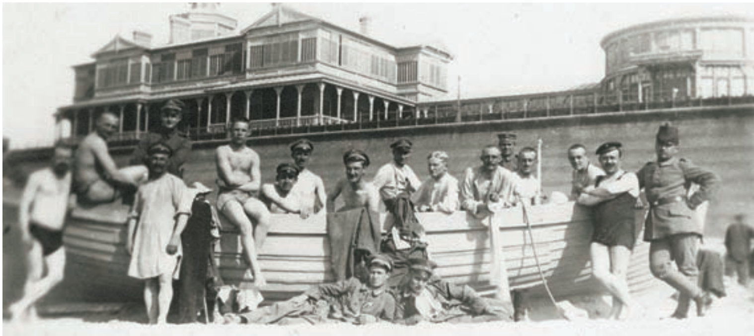
■ Een niet-gebruikte reddingsloep als decorstuk met op de achtergrond het Koninklijke Chalet. De Duitse soldaten staan in zwemtenue met hun soldatenpet op, als onderdeel van hun badkostuum