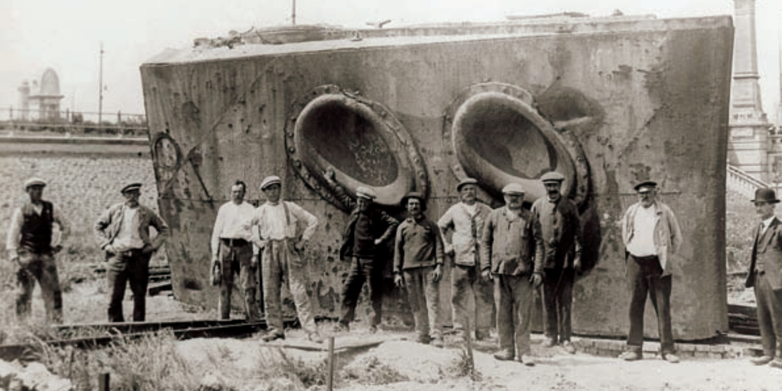
■ Aufstellen des Bugs der Vindictive als Monument in Oostende