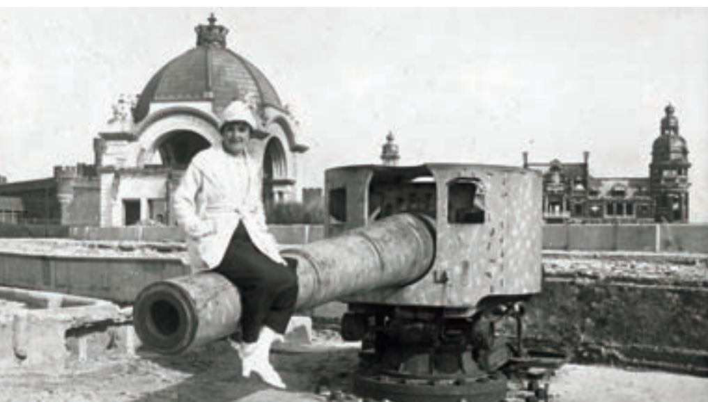
■ Kurz vor dem Abriss der Batterie Gneisenau am Oostender Palace Hotel (auf der Seepromenade zwischen der Kapucijnenstraat und der Louisastraat) posiert dieser Tourist aus Gent auf einer der Kanonen

sur la digue “ (infolge der Wirkung des Meeres auf den Deich).