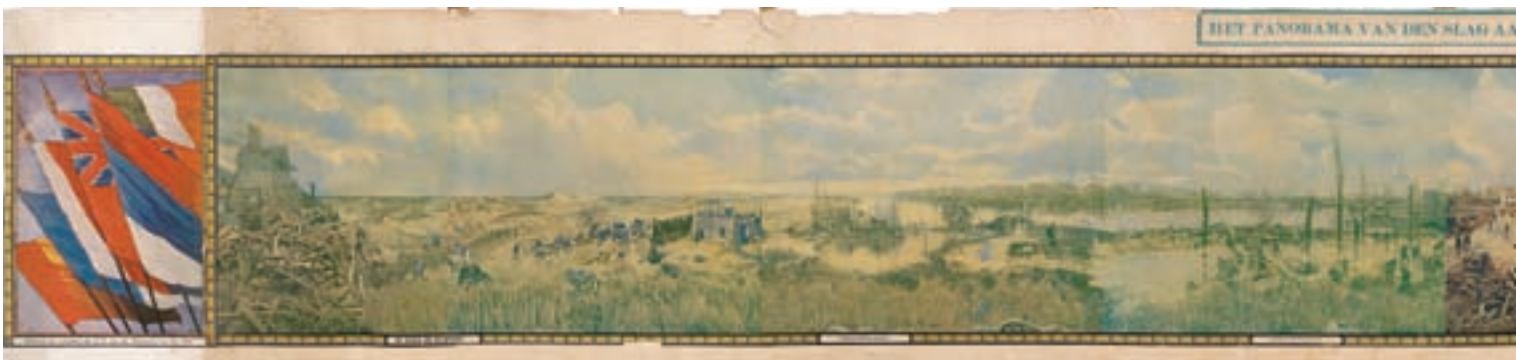
■ Das Yserpanorama, gemalt von Alfred Bastien (Sophie Muylaert)