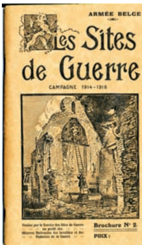
■ Die Broschüre „Les sites de Guerre“ erschien 1924

1924 und somit ziemlich spät gab auch die belgische Armee eine Broschüre mit dem Titel „De Oorlogsoorden - Les Sites de Guerre“ (Die Kriegsschauplätze) heraus, die eine Art offizieller Liste der Kriegsrelikte enthielt, die unter Denkmalschutz gestellt werden sollten. Im Küstenbereich handelte es sich dabei um die Batterien Lübeck, Pommern, Wilhelm II. und Deutschland, die „Abri de