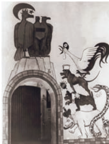
■ Die Wandmalerei „Hindenburgkeller“ im Fort Napoleon. Der Name verweist auf den Feldmarschall Hindenburg

Auch in Knokke gab es ein „Waffenmuseum“. Das war kein Zufall, denn die für die Kriegsschauplätze zuständige Dienststelle war im Knokker Leuchtturm untergebracht. Auch das Museum befand sich anfangs im Leuchtturm und wurde später dann in einen größeren Saal an der Zoutelaan verlegt. Es beherbergte eine beeindruckende Sammlung von Waffen, Ausrüstungen und sogar Flugzeugen, die einem damals üblichen Prinzip zufolge ausgestellt wurden: ein Schrank voller Säbel, eine Sammlung Bajonette, eine Sammlung Helme,... Viele Ausstellungsstücke hatten nicht einmal eine Beziehung zur unmittelbaren Umgebung,