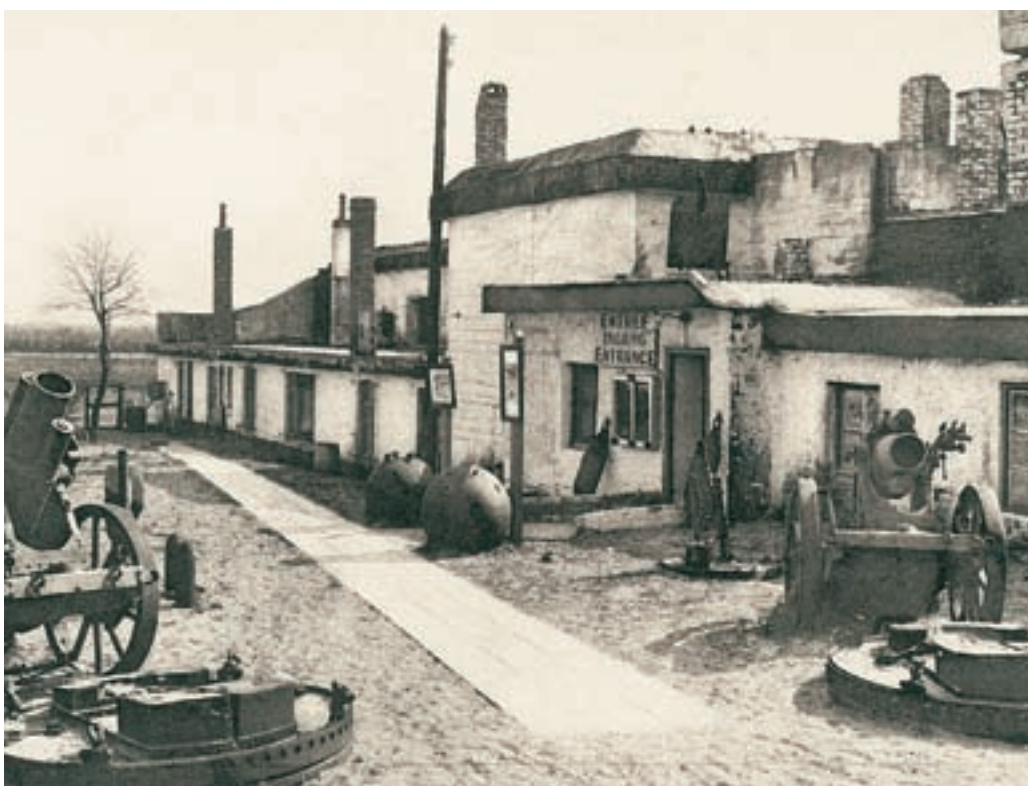
■ Der „Abri de l'Amirauté“ in Middelkerke