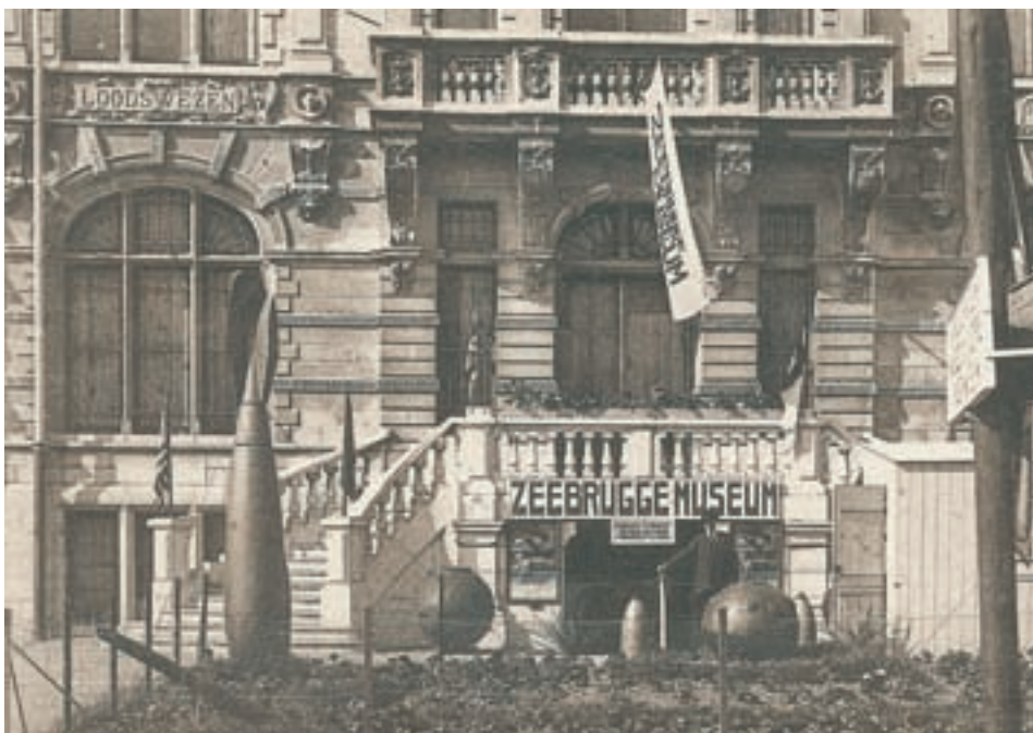
■ Eingang des Kriegsmuseums in Zeebrügge

Dieser ehrgeizige Plan konnte nie verwirklicht werden. Stinglhamber musste sich mit einer einfacheren Behausung in den Kellern des (in den 1980er Jahren abgerissenen) Staatsgebäudes zufrieden geben. Die Innenausstattung bestand aus zwei Teilen: Einerseits wurde die deutsche Anwesenheit an der Küste näher beleuchtet und andererseits eine Darstellung des britischen Angriffs auf Zeebrügge (und in geringerem Maße auch auf Oostende) gezeigt. Der erste Teil bestand hauptsächlich aus der Rekonstruktion eines „deutschen Marinekasinos“. Er war mit ursprünglichem Mobiliar und Reproduktionen deutscher Wandmalereien aus verschiedenen Gebäuden, die von der Kaiserlichen Marine besetzt worden waren, ausgestattet, wie das Flak- (Flugabwehrkanonen) Kommandozentrum in St.-Andries (Brügge), das Kasino der U-Bootoffiziere im großen Patrizierhaus Catulle bei Fort Lapin (Brügge), das Lokal „de 3 Koningen“ in Lissewege und der „Hindenburgkeller“ im Fort Napoleon in Oostende. Die Reproduktionen auf Leinwand stammten von dem Maler Maurice Sieron. Auch einige Erinnerungen an die deutsche Besatzung konnten besichtigt werden: das Album „Unsere Gäste“ von Admiral von Schröder, dem Oberbefehlshaber des Marinekorps Flandern (mit 800 Autogrammen von allerlei geladenen Gästen) und die Kaiserliche Fahne, die während