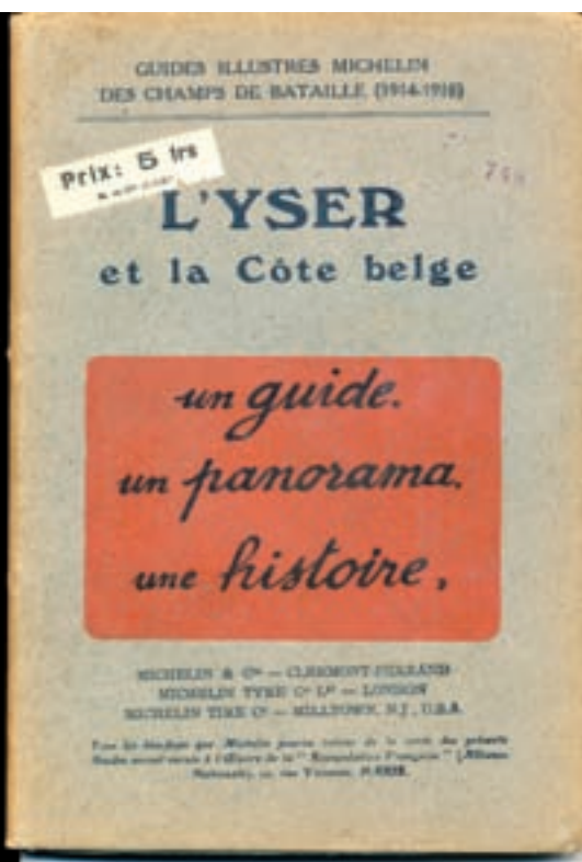
■ Umschlag des Michelinführers „l'Yser et la Côte belge“

der belgischen Regierung und der Einwohner von Ypern diesen Plan fallen und die Stadt wurde Stein für Stein wiederaufgebaut.