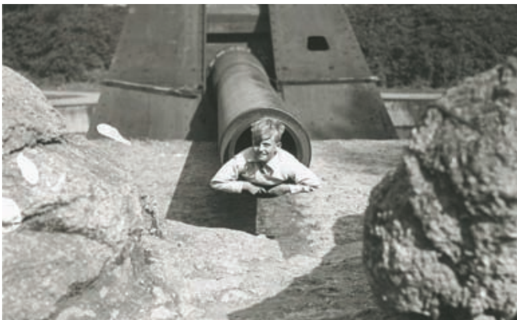
■ Dieser Junge kroch für das traditionelle Foto in den Lauf der Kanone von Leugenboom in Koekelare

Als sich zeigte, dass diese improvisierte Konservierungspolitik wenig Erfolg hatte – die meisten Kommunen hatten wenig oder gar kein Interesse an diesen Überresten – waren die Relikte immer mehr dem Verfall ausgesetzt. Einige Konstruktionen behinderten den Wiederaufbau, andere mussten der Verstärkung der Seepromenade weichen. Die Batterie Hamburg wurde gezwungenermaßen abgerissen „ par suite des emprises de la mer