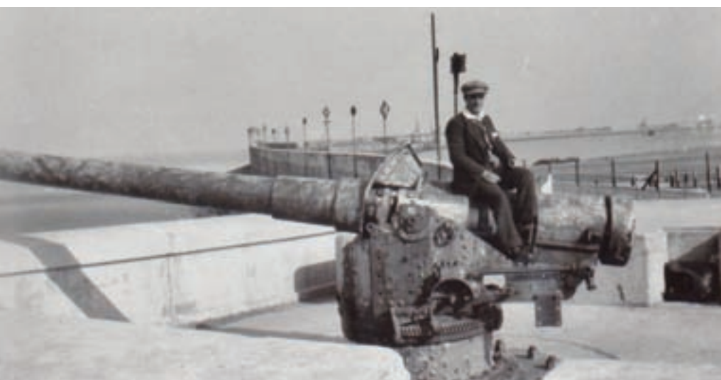
■ Überreste der Batterie Lübeck am Beginn der Mole in Zeebrügge