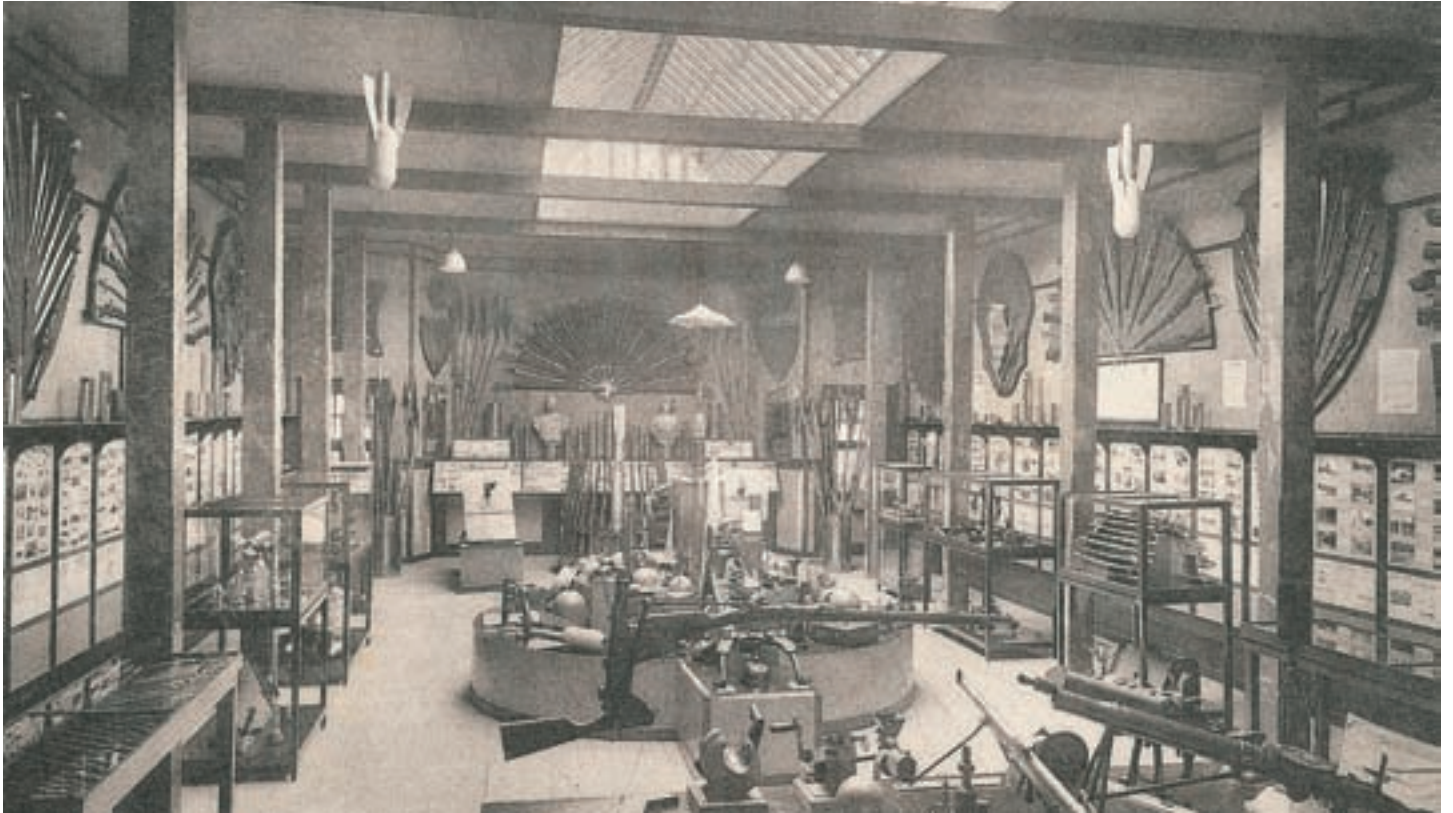
■ Das Knokker Kriegsmuseum zeigte eine große Vielfalt an Waffen und anderem Kriegsgerät (Privatsammlung)

kleiner Souvenirladen mit Ansichtskarten, Verschlussmarken, Büchern, Kriegszeitungen und allerlei Krimskrams. Über dem Eingang des Museums hing der Text: „ Qui a vu cette guerre cherchera toujours la paix - Die den oorlog heeft gezien zal altijd naar vrede trachten - To know war is to value peace “. (Wer den Krieg gesehen hat, wird immer nach Frieden streben).