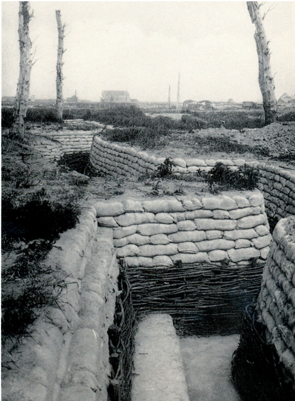
■ Die Pfeilschanze in Nieuwpoort in „restaurierter“ Form. Von den ursprünglichen Überresten ist nichts mehr übrig geblieben

der Batterie Karnak in Koksijde lagen zu weit von der ehemaligen Front entfernt, um Besucher anlocken zu können. Außerdem waren die Sektoren der Yserfront und des Ypernbogens für die Touristen viel interessanter.