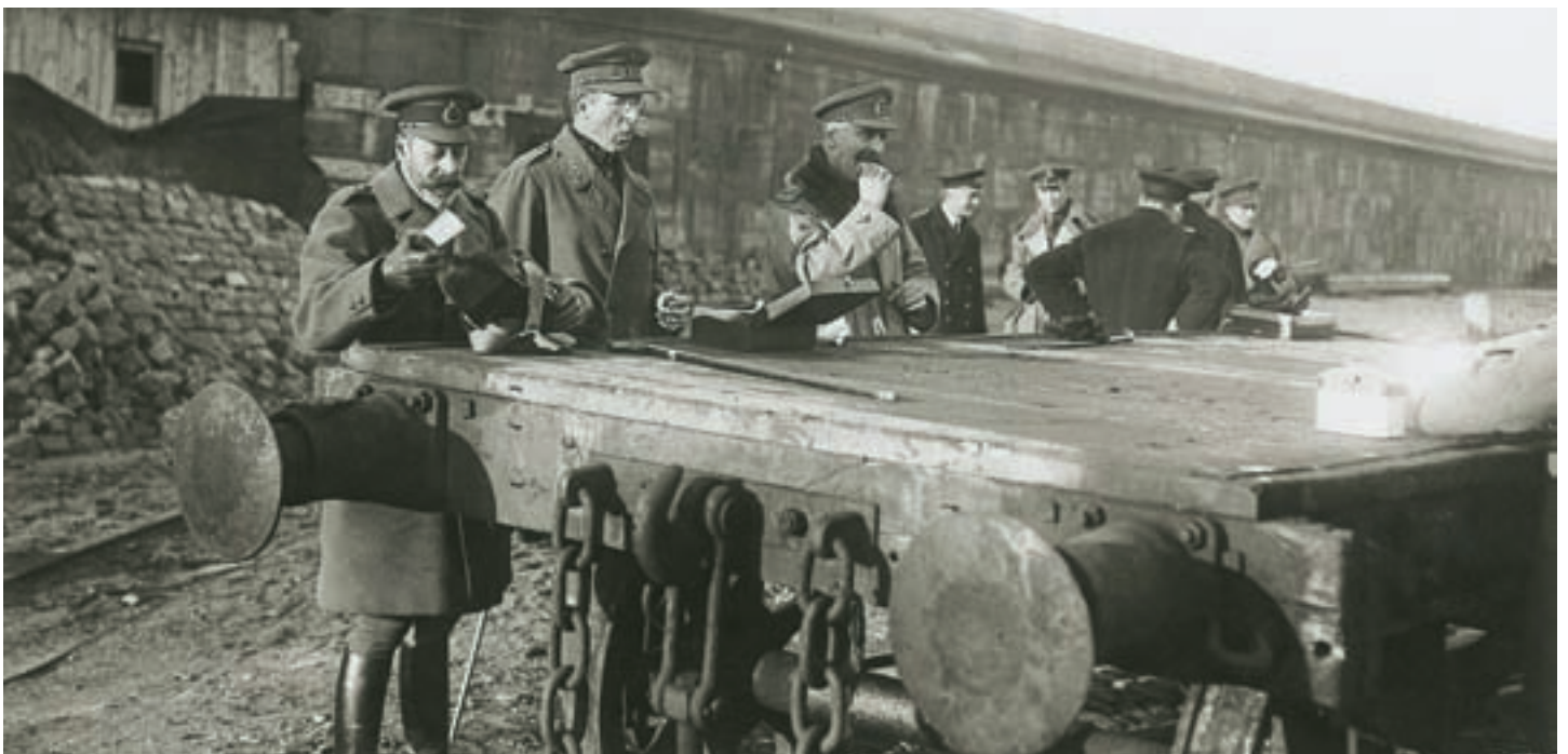
Ein kurzes Lunch während des Besuchs von König Georg V. und König Albert I. an der Mole in Zeebrügge am 10. Dezember 1918

Die Franzosen wollten entlang der Westfront anfangs einige Sektoren als sogenannten „heiligen Boden“ bewahren. Vor allem die Region rund um Verdun war dafür vorgesehen. Auch die Briten spielten mit dem Gedanken, den Schutt der total zerstörten Stadt Ypern unberührt zu lassen und daneben eine neue Stadt zu errichten. „Für das britische Volk gab es keinen heiligen Ort“, meinte Winston Churchill. Schließlich ließ man unter dem Druck