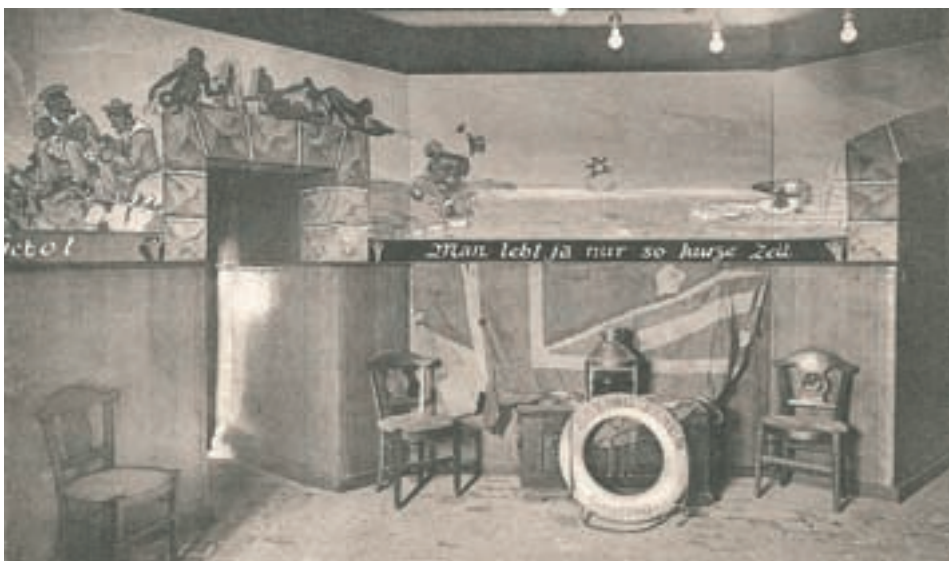
■ Rekonstruktion eines deutschen Offizierskasinos im Zeebrügger Kriegsmuseum (Privatsammlung)

des Kriegs auf dem Brügger Belfried flatterte. Außerdem gab es eine Menge patriotischer Souvenirs: die deutsche Medaille für das Versenken der legendären Lusitania und viel Glas und Porzellan aus der Sammlung des Ginters Raoul Van Trappen. Erwähnenswert ist auch noch die große Sammlung deutscher Vivatbänder. Vivatbänder waren kleine mit einer allegorischen Darstellung deutscher Siege bedruckte Seidentücher. Sie waren in Deutschland sehr beliebt und wurden zugunsten eines guten Zwecks verkauft. Außerdem stellte das Museum eine große Sammlung deutscher Fotos aus, die der Brügger Fotograf Arthur Brusselle heimlich von den Negativen abgezogen hatte, die die deutschen Soldaten bei ihm entwickeln ließen. Es wurden auch Erinnerungen an den 1916 von den Deutschen in Höhe der Brügger Kruisvest erschossenen Kapitän Charles Fryatt (siehe Vorwort in dieser Ausgabe) wach gerufen und