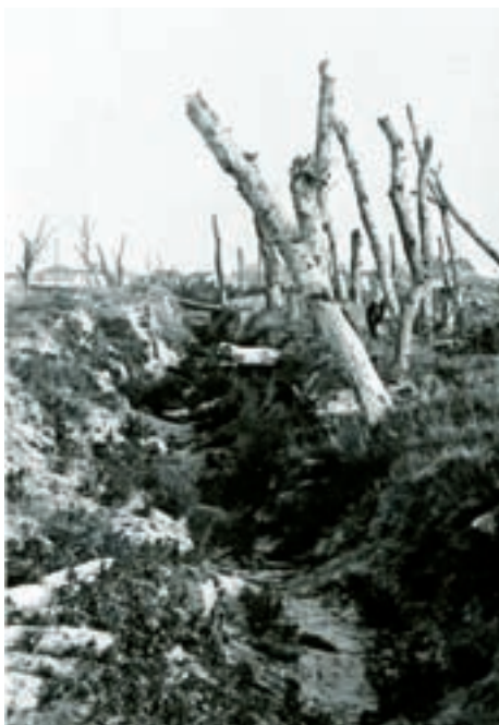
■ Die belgischen Stellungen der Pfeilschanze von Nieuwpoort im ursprünglichen Zustand (1919)

als Museum. Das Museum hatte inhaltlich keine große Bedeutung. Fotosammlungen über den Ersten Weltkrieg (u.a. Bilder der Fotografen Maurice und Robert Antony) ergänzt mit losen Sammlungen von Waffen, Helmen, Säbeln und Hülsen bildeten den Hauptbestandteil der ausgestellten Objekte.