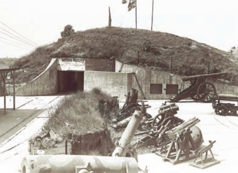
■ Kriegsmuseum der Batterie Wilhelm II. in Knokke (KIK Brüssel)