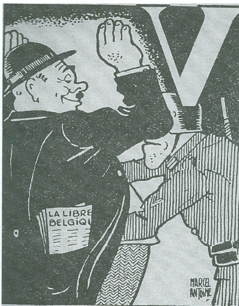
Een lezer van een sluikkrant wordt gefouilleerd (uit "Erzats", 1944)