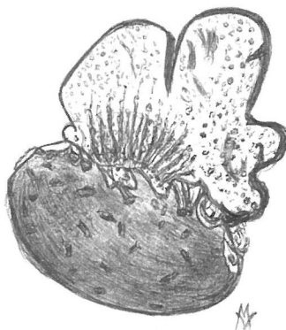
Fig. 1: Tekening van verse kolonie Alcyonium digitatum gevonden op 10/10/1992 te Koksijde, Ster der Zee (M. Th. Vanhaelen)

(KOK = Koksijde, DP = De Panne, ODK = Oostduinkerke)