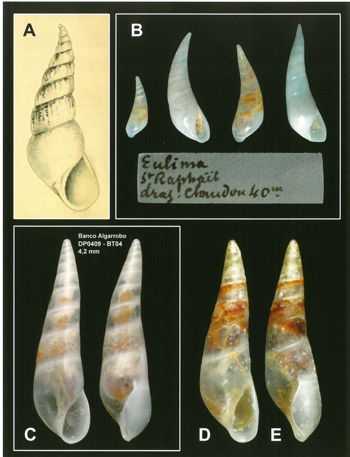
A-D: Curveulima devians . A. Eulima parviti de Folin, 1887. B. Eulima ex collection Dautzenberg (IRSNB), Saint-Raphaël (France). C. Banco Algarrobo, Mer d'Alboran (360-365 m) - 4,2 mm. D. Sagres (Algarve - Portugal) - 3,5 x 1,0 mm.