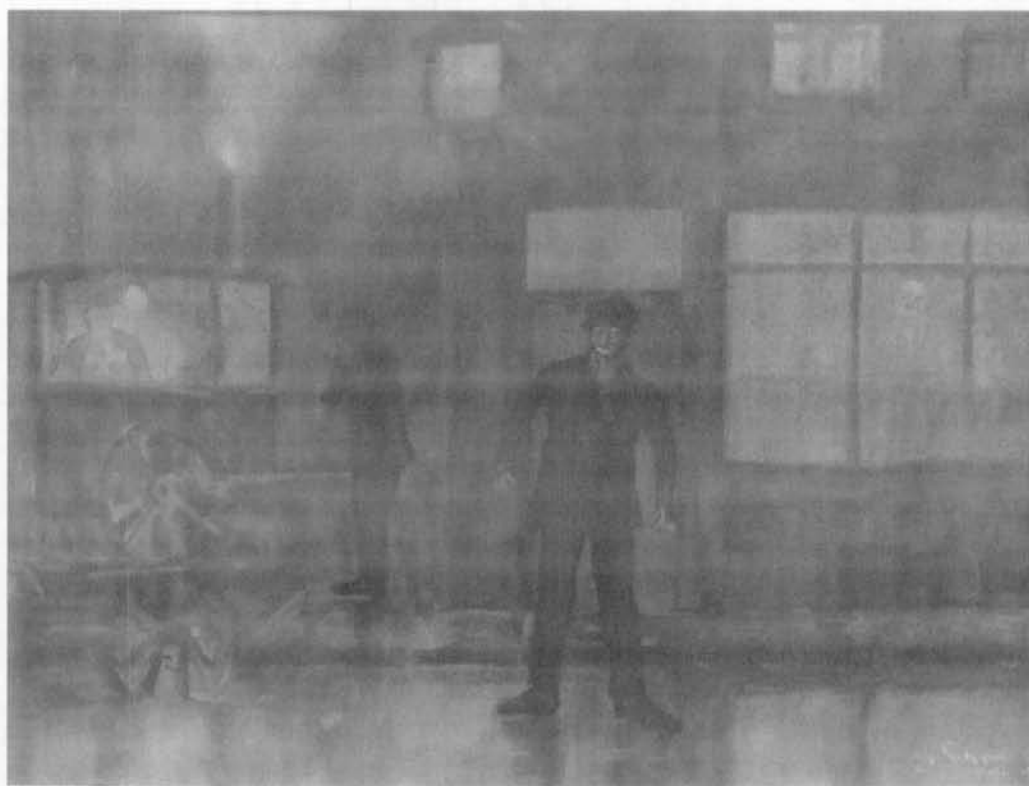
Privé bezit Bredene get. r.o. Jacques Schrygens ged. r.o. 1946 Aquarel op papier