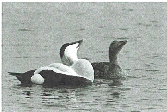
De balts bij Eidereenden

De Eider broedt in april-mei en het legsel wordt met gras, mos en zeewier toegedekt. Het wijfje trekt donsveertjes uit de borst en spreidt ze uit op de bodem. Om zich tegen roofdieren (ook vossen) te beschermen broeden ze op scheren en eilandjes. De wijfjes waken ook over het kroost van de andere Eiders om hen te beschermen tegen de vraatzuchtige Zilver- en Mantelmeeuwen. Die moederlijke zorg hebben ze met de Bergeend gemeen. De eigenschap waakdieren aan te stellen, doet denken aan de ganzen. Ze voeden zich met zeesterren, krabben, mosselen en andere weekdieren.