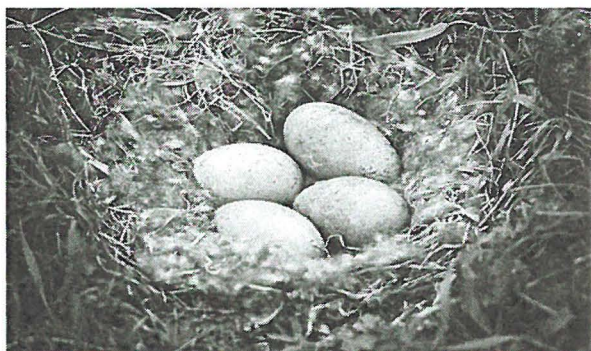
Nest met dons van de Eidereend

Al in voorhistorische tijden waren de eieren en het dons van de Eidereend kostbaar. Op Vegaøyan worden de Eiders nog steeds als 'huisdier' gehouden. Uit zestig nesten haalt men één kilogram dons. De traditie in verband met het verzamelen van eieren en het reinigen van dons betekende een inkomen voor de bewoners van de Noorse kusten. Die traditie is tot op de dag vandaag levendig gebleven en jaarlijks worden er eiderdonsdekens verkocht.