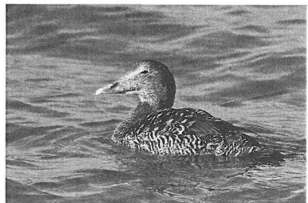
Eidereend - wijfje

In hun prachtig zomerkleed verblijven de mannetjes van de Eidereend op volle zee, want ze zijn een gemakkelijk prooi voor predatoren, de roofmeeuwen, de felle Jagers. De wijfjes