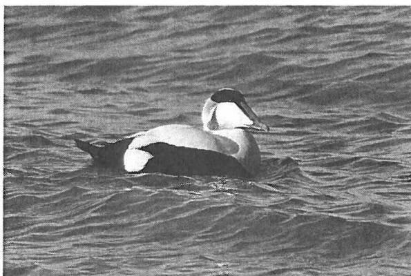
Eidereend - mannetje

De Noren geven niet alles prijs, laten het achterste van hun tong niet zien. En toch, hoe hoger naar het noorden je reist, hoe opener de Noren! Eens boven Trondheim is het een fluitje van een cent om tot de Noorse ziel door te dringen. Je hoeft alleen maar te luisteren, leergierig en nieuwsgierig te zijn. Maar als het over de Eidereend gaat: blijf eerbiedig op afstand!