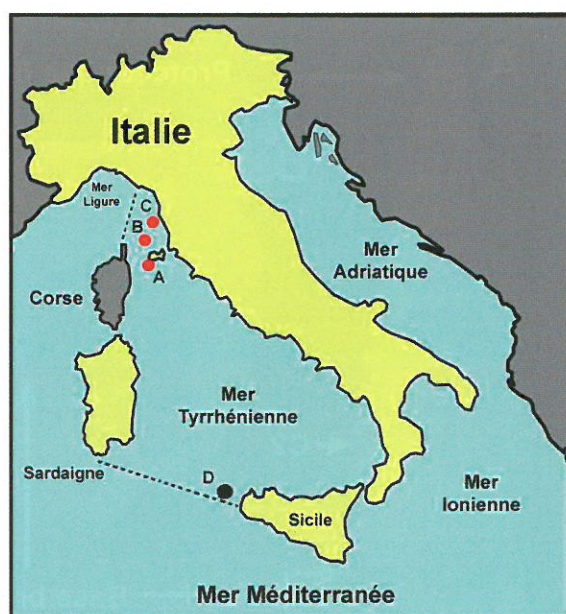
Figure 1. A-D. Mer Tyrrhénienne A. Ile d'Elbe. B. Ile de Capraia. C. Calignaia. D. Favignana

Basé sur les six spécimens connus à ce jour, les caractères principaux de l'espèce se résument comme suit (Romani, 2015): coquille de petite taille (4,7 - 6,1 mm), protoconque blanchâtre de 2,7 - 3 tours, portant deux cordes spirales croisées de nombreuses fines côtes axiales, à partir du deuxième tour. La sculpture sur la partie visible de la téléconque est formée de 3 cordons spiraux noduleux (ici C1-C3), le premier (C1) et le troisième cordon (C3) font immédiatement suite à la protoconque. Le deuxième cordon (C2) apparaît entre les deux premiers à la hauteur des tours 5,5 - 7,5. Il demeure relativement fin et ce n'est que sur le dernier tour qu'il atteint un grosseur comparable aux autres. La base de la coquille porte 4 cordons additionnels (ici C4-C7) dont le premier, bien développé, est noduleux, les trois suivants, d'épaisseur décroissante à mesure de leur apparition sur le canal siphonal, sont lisses. La couleur de la téléconque est uniformément crème, tant sur les cordons qu'entre ceux-ci, à l'exception de la base de la coquille qui est plus brune.