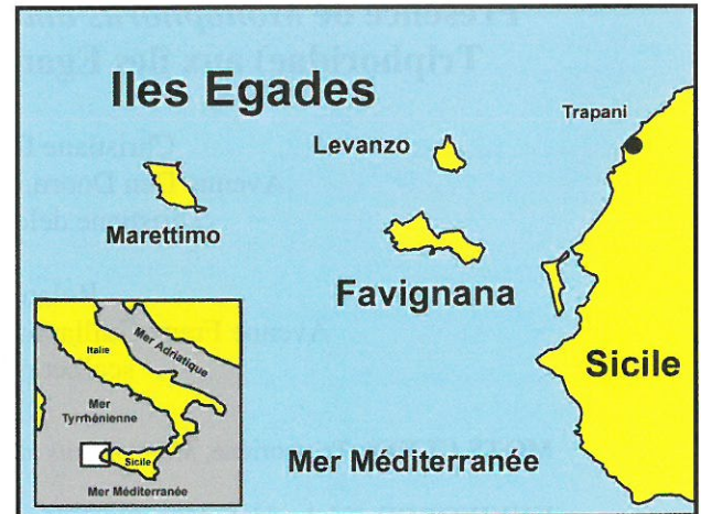
Figure 2. Archipel des Egades - Nord-ouest de la Sicile.

Nous tenons à remercier Roland Houart (collaborateur scientifique à l'Institut royal des Sciences naturelles de Belgique) pour les commentaires et la relecture de la publication.