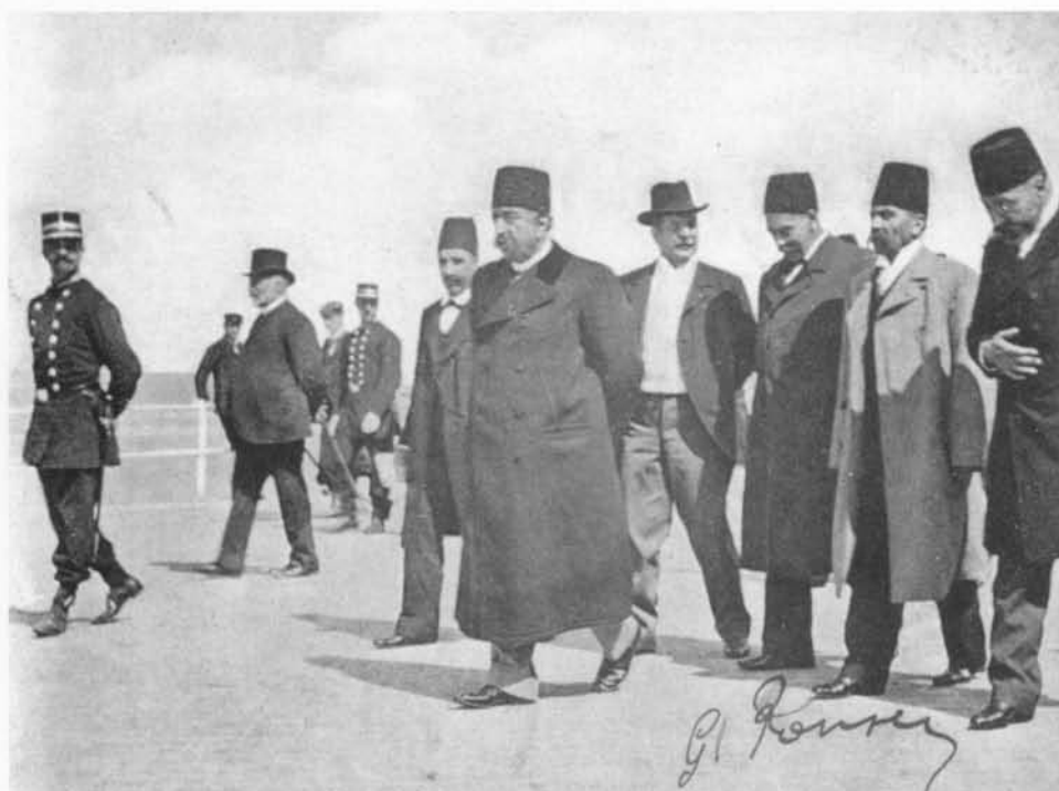
Sjah Mouzafer-Ed-Dine met zijn ministrieel gevolg op de zeedijk (1905).